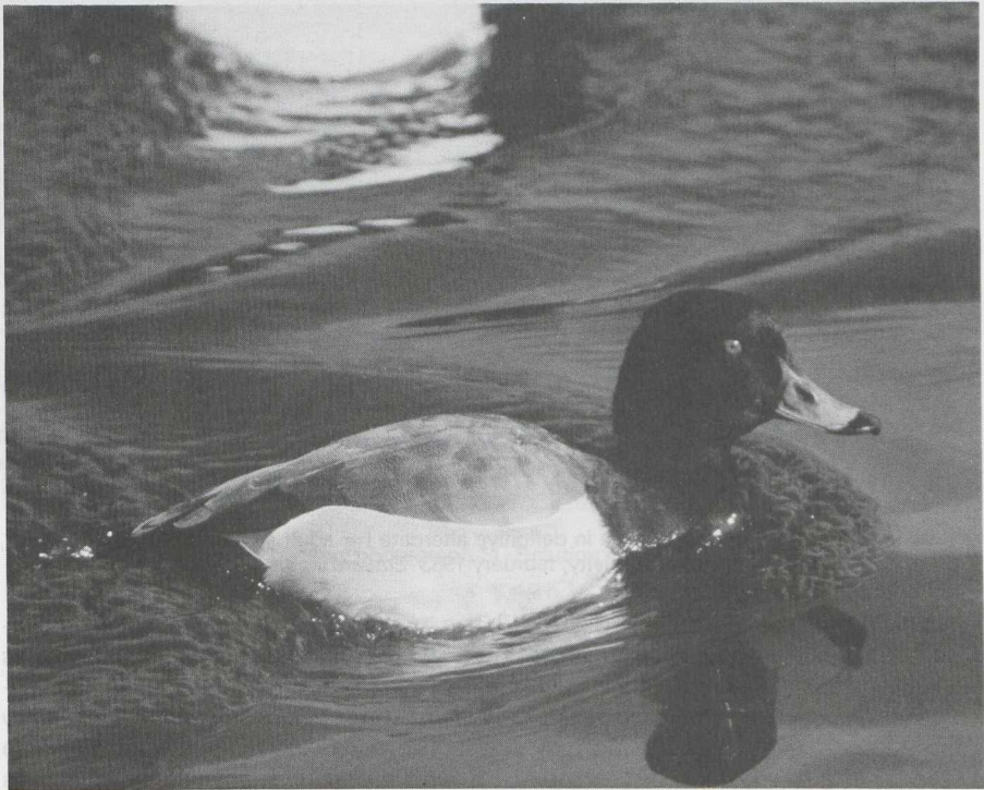
Pochard Aythya ferina x Tufted Duck A fuligula , male in definitive alternate (= adult summer) plumage, Halfweg, Noordholland, april 1982 (Edward J van IJzendoorn).

10 The male Aythya duck in definitive alternate (= adult summer) plumage in plate 79 ( Dutch Birding 4: 132, 1982) is a hybrid of the 'Lesser Scaup' type. This hybrid between a Pochard A ferina and a Tufted Duck A fuligula looks very like a Lesser Scaup A affinis (hence the hybrid's name). It also looks like a Scaup A marila . When studying the photograph of the hybrid, the following differences with male Lesser Scaup and Scaup in definitive alternate plumage can be noted. 1 The bill is blue-grey, lightening distally, with a broad black terminal band. Lesser Scaup and Scaup have an