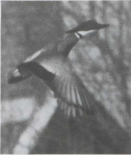
17 Bronskopeend Anas falcata , mannetje, Makkum, Friesland, maart 1983 (Jan Mulder).