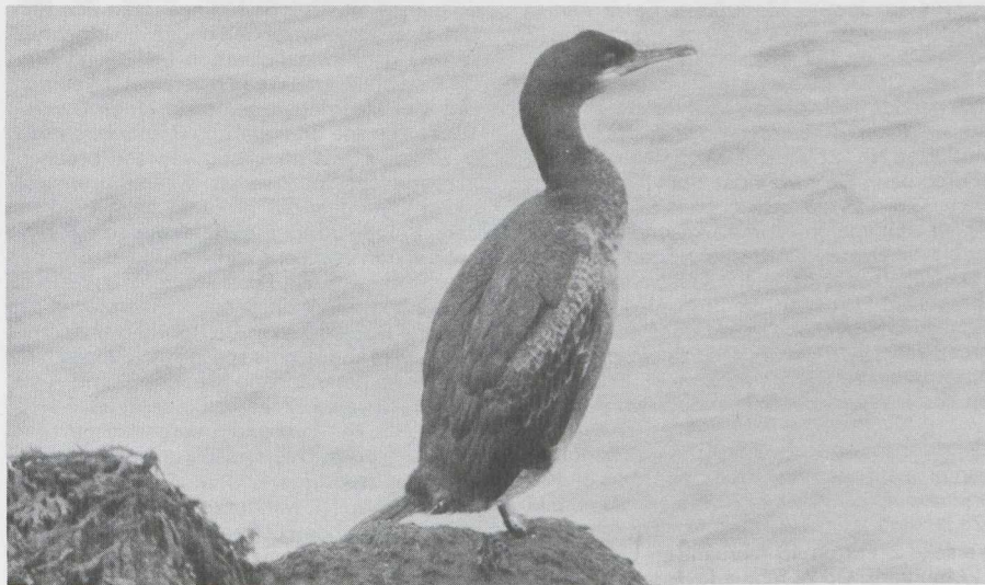
15 Kuifaalscholver Phalacrocorax aristotelis , De Maasvlakte, Zuidholland, maart 1983.

De Nederlandse en wetenschappelijke namen en hun volgorde komen overeen met de 'Naamlijst van in België en in Nederland waargenomen of vastgestelde vogelsoorten en hun ondersoorten' ( Wielewaal 47: 363-376, 1981).