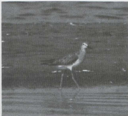
96-97 Kleine Geelpootruiter Tringa flavipes in eerste wisselkleed (= eerste zomerkleed), Doel, Oostvlanderen, augustus 1983 (Arnoud B van den Berg, Jef de Ridder & Chris Steeman).