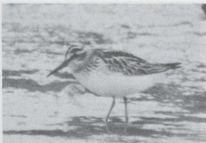
98 Breedbekstrandloper Limicola falcinellus in juveniel kleed, Serooskerke, Zeeland, augustus 1983 (Arnoud B van den Berg).

De waarnemingen van twee verschillende Reuzensterns op Texel op 25 augustus waren het derde en vierde geval voor dit waddeneiland. Maximaal zes Witvleugelsterns Chlidonia leucopterus verbleven in Flevoland. Andere werden waargenomen op het Balgzand in augustus en september (minstens twee), op Marken Nh op 12 augustus (zes), bij Den Oever op 6 en 20 augustus en te Serooskerke in de derde week van augustus.