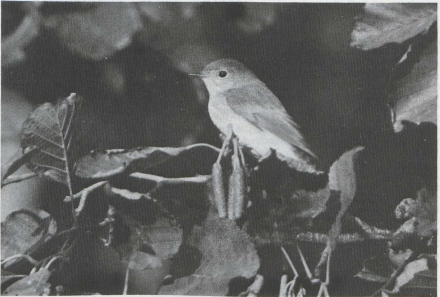
88 Kleine Vliegenvanger Ficedula parva in juveniel kleed, Terschelling, Friesland, oktober 1983 (Arnoud B van den Berg).

Vogelen op Terschelling in september en oktober 1983 De twee vogelweken welke door de Stichting Dutch Birding Association van 16 tot en met 23 september en van 7 tot en met 14 oktober 1983 op Terschelling Fr georganiseerd werden, verliepen ook dit jaar weer succesvol. Er werden in totaal niet minder dan 180 vogelsoorten gezien: 154 in september en 147 in oktober. Dit jaar werd het hoogtepunt gevormd door een Noordse Nachtegaal Luscinia luscinia die zich op 23 september een half uur lang bij Oosterend liet zien. Verder werden de volgende zeldzame en interessante vogels waargenomen: c 20 Grauwe Pijlstormvogels Puffinus griseus , enkele Noordse Pijlstormvogels P puffinus , c 30 Vale Stormvogeltjes Oceanodroma leucorhoa , een Kuifaalscholver Phalacrocorax aristotelis , een Visarend Pandion haliaetus , een Morinelplevier Charadrius morinellus , veel Bokjes Lymnocyptes minimus , c 30 Middelste Jagers Stercorarius pomarinus , minstens een Kleinste Jager S longicaudus , c 10 Grote Jagers S skua , minstens vijf Vorkstaartmeeuwen Larus sabini , enkele Grote Piepers Anthus novaeseelandiae , een Sperwergrasmus Sylvia nisoria , drie Bladkoninkjes Phylloscopus inornatus en een Kleine Vliegenvanger Ficedula parva . Bovendien werd op 7 en 8 oktober in de haven van Harlingen Fr een Witwangstern Chlidonias hybridus in eerste basiskleed (= eerste winterkleed) waargenomen.