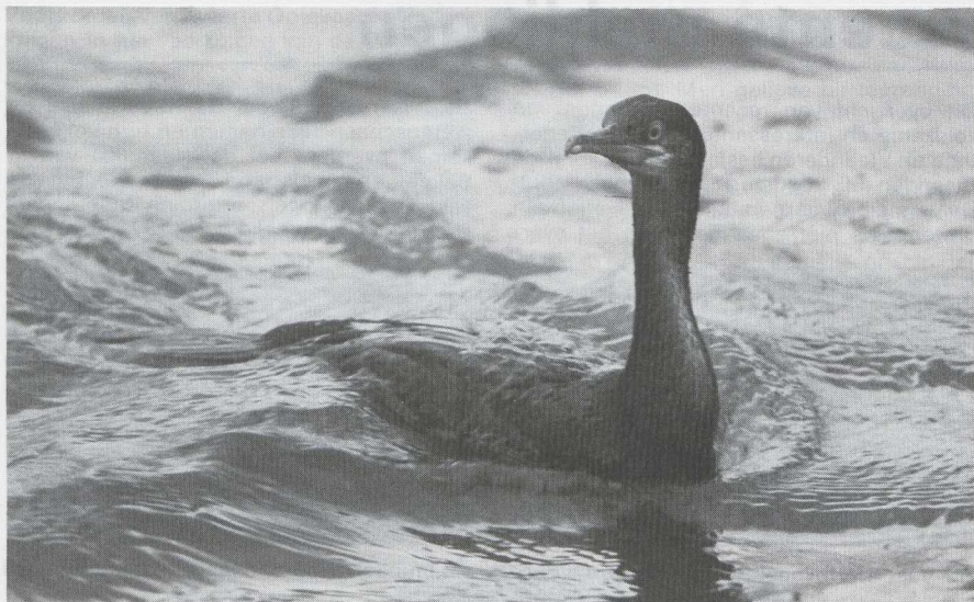
90-91 Kuifaalscholwers Phalacrocorax aristotelis in non-definitief (= onvolwassen) kleeed, IJmuiden, Noordholland, september 1983 (Arie de Knijff, Erik J Maassen).