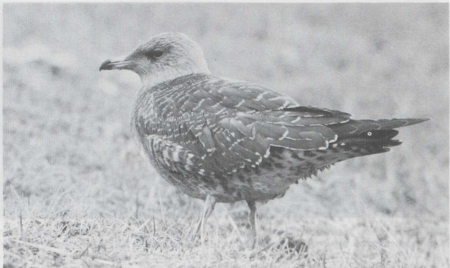
99 Kleinste Jager Stercorarius longicaudus in juveniel kleed, Hondsbosse Zeewering, Noordholland, september 1983 (Arnaud B van den Berg). 100 Grote Jager S skua in juveniel kleed, IJmuiden, Noordholland, september 1983 (Erik J Maassen).