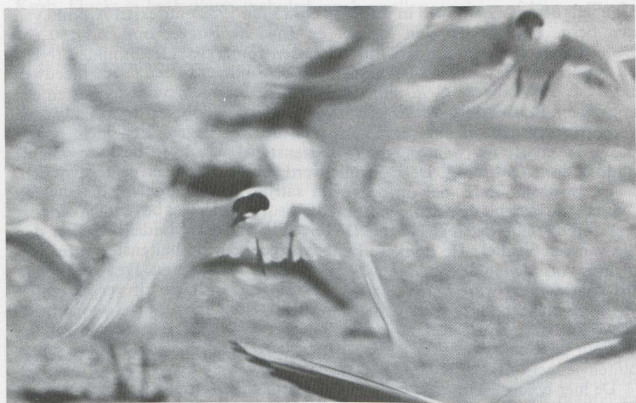
45-46. Dougalls Stern Sterna dougallii , volwassen vogel in zomerkleed, IJmuiden (NH), juli 1982 (Arnoud B. van den Berg)