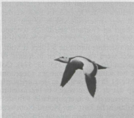
39-41. Stellers Eider Polysticta stelleri , mannetje in prachtkleed, Schiermonnikoog (Fr), mei 1981 (Luc L.M. de Bruijn). In plaat 39 samen met twee vrouwtjes Eider Somateria mollissima .

In het archief van de Commissie Dwaalgasten Nederlandse Avifauna (CDNA) zijn vanaf 1979 meldingen van een mannetje Stellers Eider in het Waddengebied te vinden die alle waarschijnlijk betrekking hebben op dezelfde vogel (tabel 1). Een aantal waarnemingen is onvoldoende gedocumenteerd en niet door de CDNA aanvaard. Aangezien de eerste waarneming op 28 februari 1979 werd gedaan, is het waarschijnlijk dat de Stellers met een van de oostelijke influxen van watervogels in de strenge winter van 1978/79 naar het Nederlandse Waddengebied is gekomen (cf. Chandler 1981, Helbig 1981). Het is opmerkelijk dat de Stellers in het voorjaar van 1979, 1981 en 1982 het zelfde gedrag vertoonde en steeds bij hoogwater terugkeerde naar de Oosterkwelder op Schiermonnikoog. In de zomer van 1980 is vermoedelijk de zelfde vogel ruiend op de Boschplaat op Terschelling (Fr) waargenomen. Het is goed mogelijk dat de Stellers zich ook in het voorjaar van 1980 op Schiermonnikoog heeft opgehouden want het wad is onoverzichtelijk en broedgebieden zijn niet vrij voor het publiek toegankelijk.