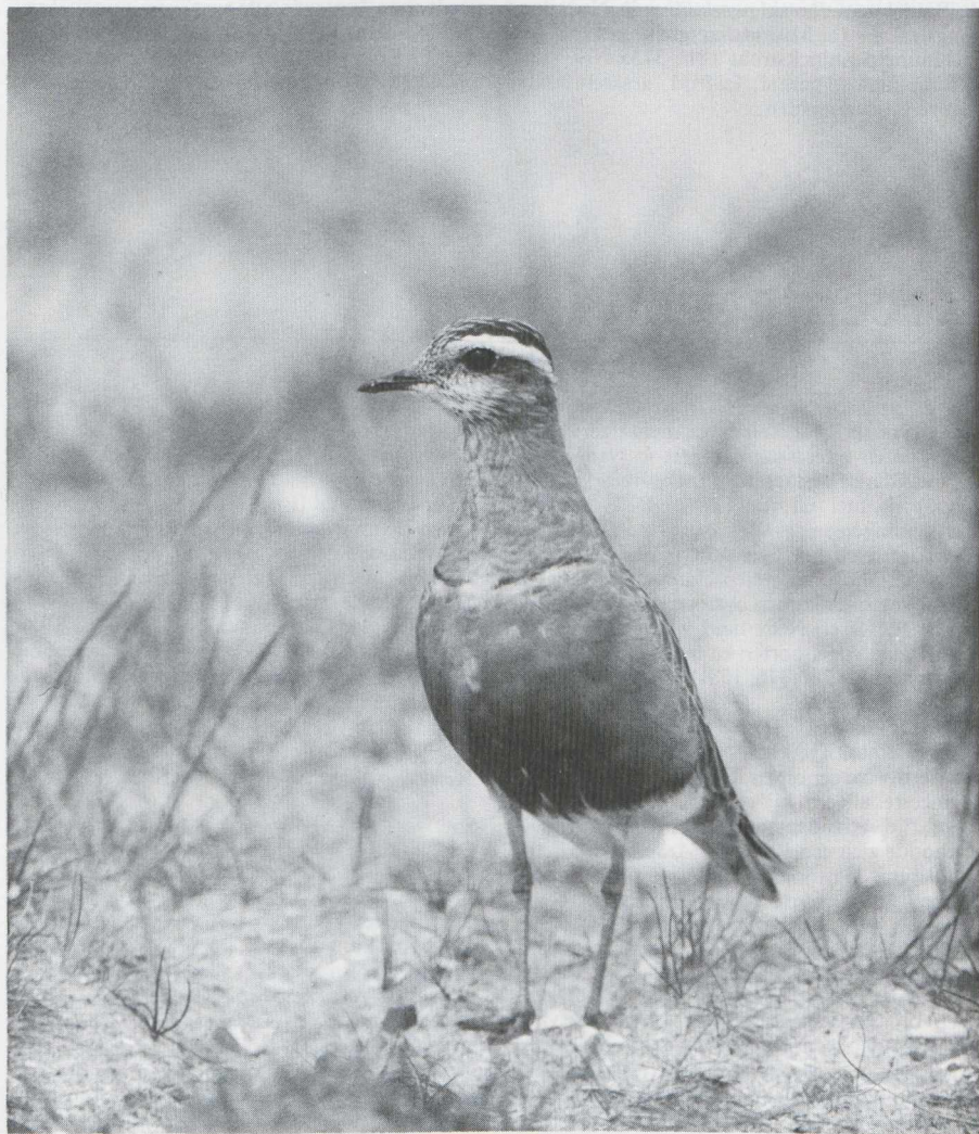
28. Morinelplevier Charadrius morinellus , De Maasvlakte (ZH), mei 1982 (Arie de Knijff)

Een Kraanvogel Grus grus trok over Beesd (Gld) op 13 mei en één over Castricum (NH) op 15 mei. In het Lauwersmeer (Fr/Gr) verbleven half juni vijf exemplaren waarvan één ook nadien nog werd gezien. Op verschillende plaatsen doken in mei Steltkluten Himantopus