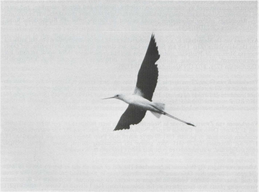
27. Steltkluut Himantopus himantopus , Oostvaardersplassen (Fl), juni 1981

Voorkomen van Steltkluut in Nederland Om een beter inzicht te krijgen in het voorkomen van de Steltkluut Himantopus himantopus in Nederland, wordt men verzocht alle waarnemingen en (nest)vondsten gedurende de periode 1951-80 op te sturen naar Karel Mauer (Hengelostraat 85, 1324 GV Almere-Stad/03240-33398). Men gelieve bij toezending datum, plaats, aantal, leeftijd, geslacht, omstandigheden, waarnemer(s) en eventuele andere gegevens te vermelden.