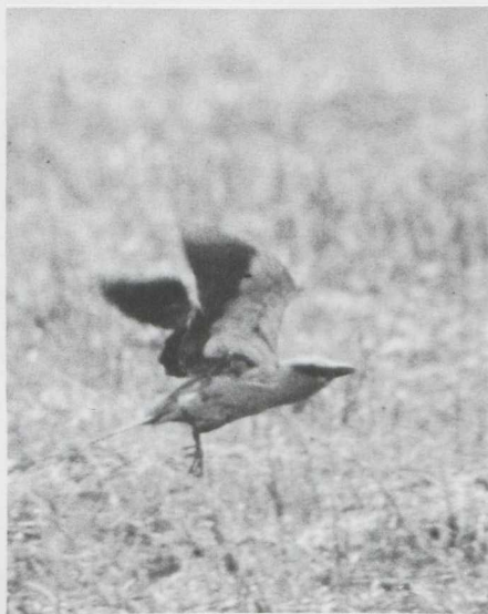
33. Scharrelaar Coracias garrulus , Zuidelijk Flevoland, mei 1982 (Edward van IJzendoorn)

Alpengierzwaluwen Apus melba werden waargenomen op 16 mei te Wassenaar (ZH) en op 21 mei te Boechout (A). Bijeneters Merops apiaster verbleven op Texel van 7 tot en met 9 mei en te Havelte (D) op 27 mei. De eerste Scharrelaar Coracias garrulus verscheen te Heiloo (NH) op 9 mei. Twee exemplaren lieten zich uitvoerig waarnemen in Zuidelijk Flevoland van 21 tot en met 26 mei; andere werden gezien in Oostelijk Flevoland, de AW-duinen