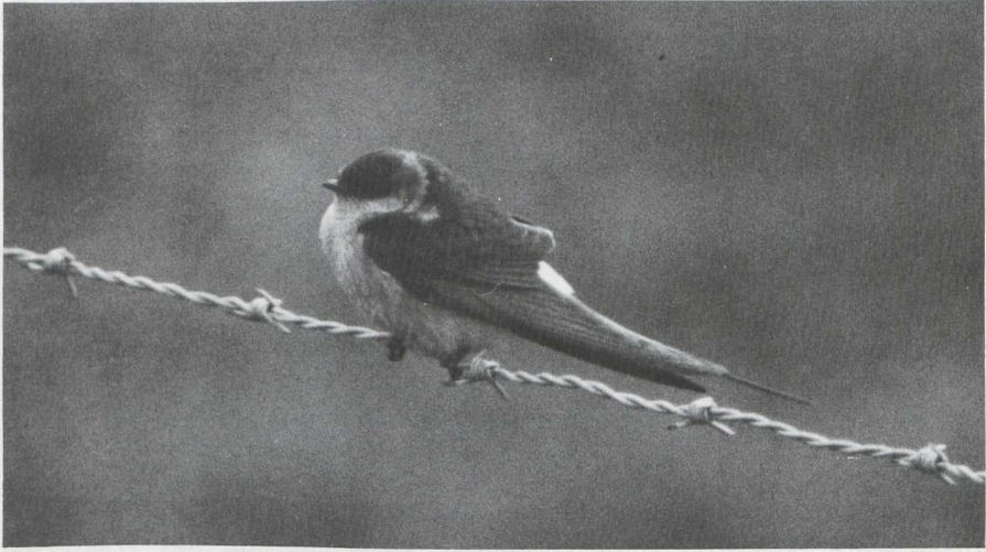
25. Roodstuitzwaluw Hirundo daurica , Lopik (U), april 1982 (Edward J. van IJzendoorn)

De ondervleugeldekveren hadden de zelfde kleur als de buik. De poten waren niet bevederd - hetgeen bij een Huiszwaluw wel het geval is. De vlucht leek wat minder beweeglijk dan die van een Boerenzwaluw. Geluid werd niet gehoord.