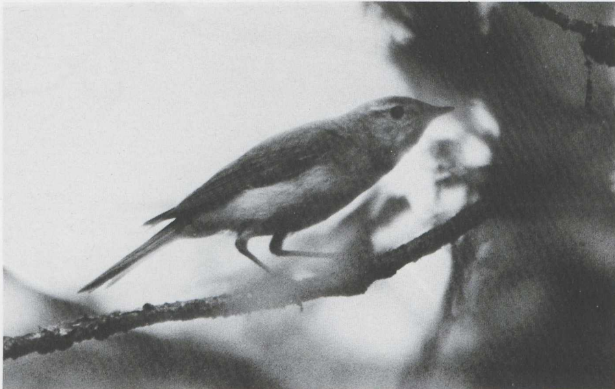
34. Bergfluitert Phylloscopus bonelli , Boswachterij Sint Anthonis (NB), juni 1982

(NH), Het Nationale Park De Kennemerduinen (NH) en op de Strabrechtse Heide in de laatste week van mei en de eerste week van juni. Van begin april tot begin mei werd een 10-tal Hoppen Upupa epops gemeld. Het mannetje Grijskopspecht Picus canus dat in 1981 een territorium bezette op de Brunsummerheide (L), maakte op de zelfde plek luid roepend zijn aanwezigheid kenbaar van half april tot in juni. De vogel die ook in de afgelopen winter in de nabije omgeving werd waargenomen, bleef opnieuw ongepaard. Op 12 en 13 april bevond zich een Roodstuitwaluw Hirundo daurica bij Tienhoven (ZH) en Lopik (U). In de tweede week van mei werden Roodkeelpiepers Anthus cervinus waargenomen te Eijsden (L), Rilland (Z) en Wuustwezel (A) (twee). Een Midden-europese Waterspreeuw Cinclus cinclus aquaticus werd aangetroffen langs de Gulp bij Gulpen (L) op 26 april. Op 15 mei rustte een mannetje Roodgerstede Blauwborst Luscinia s. svecica op De Maasvlakte. Langs de Maas