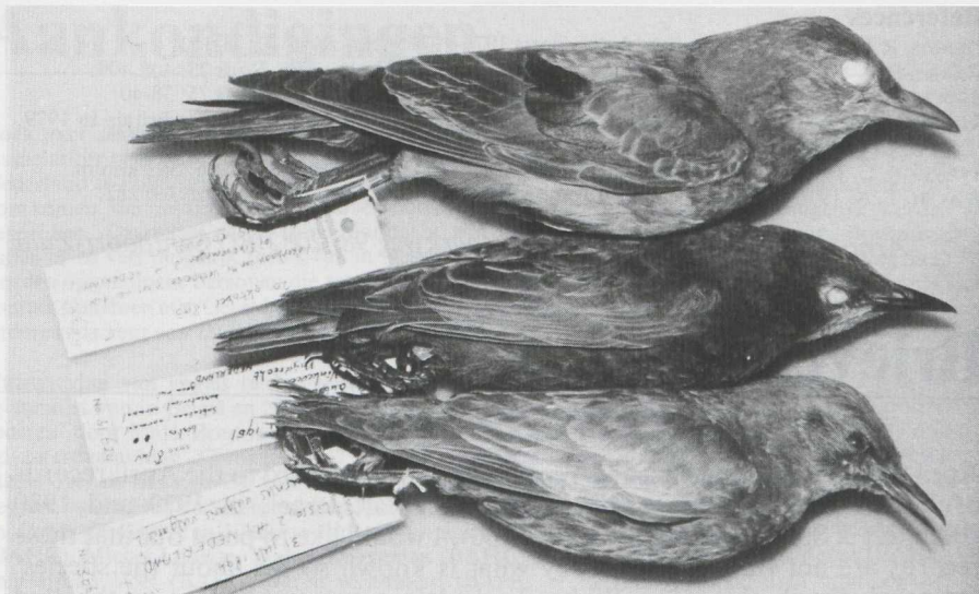
26. Rose-coloured Starling Sturnus roseus (above) and two Starlings S. vulgaris (middle and below), Zoölogisch Museum, Amsterdam (Noordholland), September 1981. The juvenile Rose-coloured, collected on 20 October 1893 at Scheveningen (Zuidholland), was moulting into its first-winter plumage. The bird had already replaced a few secondaries and most greater wing-coverts; it was moulting a few rectrices and lesser wing-coverts. There were no signs of body moult. The normally coloured juvenile Starling (middle) was collected on 28 June 1951 at Vinkeveen (Utrecht); the pale biscuit-coloured juvenile Starling (below) on 31 July 1894 at Lisse (Zuidholland)

the bill on a recently-fledged Starling may not be fully grown, and can be even shorter than that of a Rose-coloured. Because of this, I think differences in bill shape between juveniles of both species may need to be assessed with care.