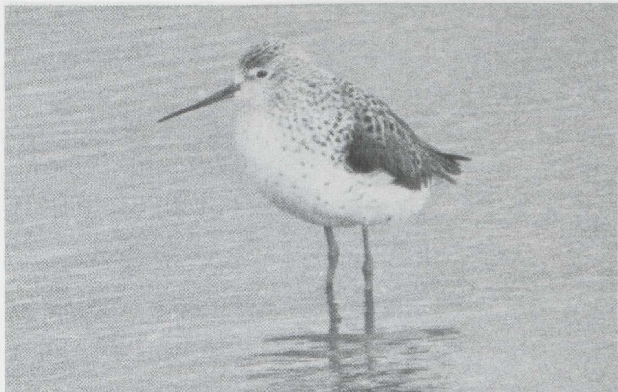
29. Poelruiter Tringa stagnatilis , volwassen in zomerkleed, Hurwenen (Gld), april 1982 (Arnoud B. van den Berg)