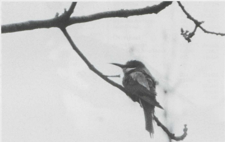
32. Bijeneter Merops apiaster , Texel (NH), mei 1982

onvolwassen Grote Burgemeester L. hyperboreus te IJmuiden (NH). Lachsterns Gelochelidon nilotica werden gemeld in de Harderbroek op 24 mei, te Uffelte (D) op 31 mei, op de Dwingelose Heide (D) op 3 juni en te Burgervlotbrug (NH) op 10 juni (Twee). Het was het zevende jaar in successie dat een Dougalls Stern Sterna dougallii , gepaard met een Visdief S. hirundo , broedde in Het Zwin. Witwangsterns Chlidonias hybridus werden waargenomen langs de Knardijk (Fl) op 26 mei (drie), op de Strabrechtse Heide (NB) in de eerste week van juni en te Aarlanderveen (ZH) op 24 juni. Eveneens op de Strabrechtse Heide was half mei een Witvleugelstern C. leucop-terus aanwezig.