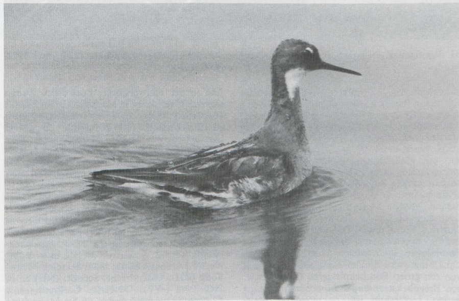
30. Grauwe Franjepoot Phalaropus lobatus , Lauwersmeer (Fr/Gr), juni 1982