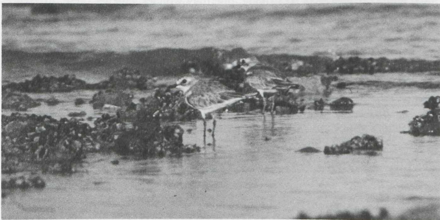
16. Two Greater Sand Plovers Charadrius leschenaultii showing black and orange-yellow legs, respectively, Egypt, September 1981

Rob G. Bijlsma, Bovenweg 36, 6721 HZ Bennekom