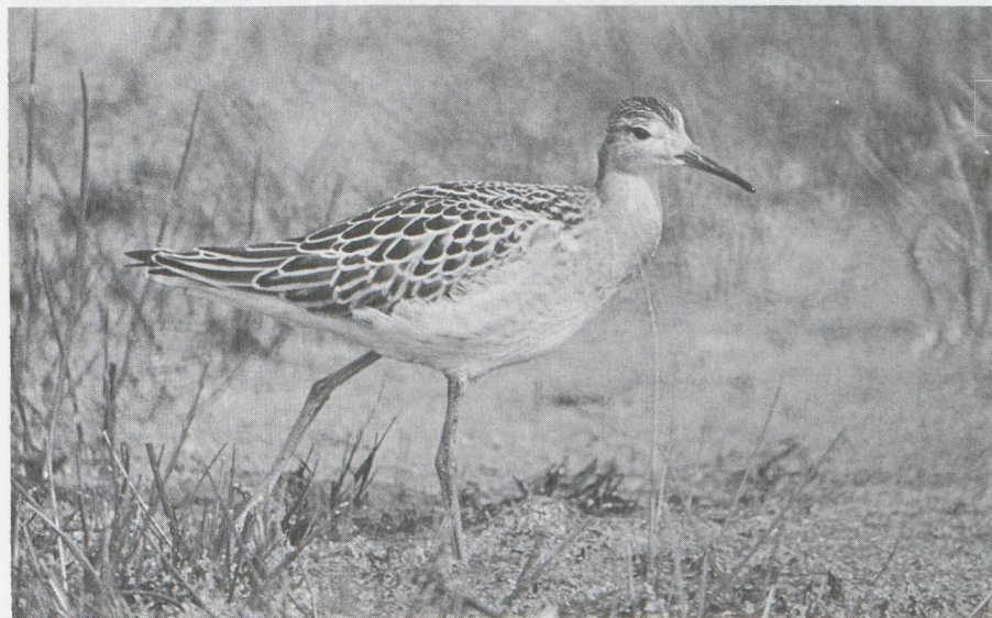
11. Juvenile Ruff Philomachus pugnax in pose where it could be confused with large Calidris sandpiper, England, August