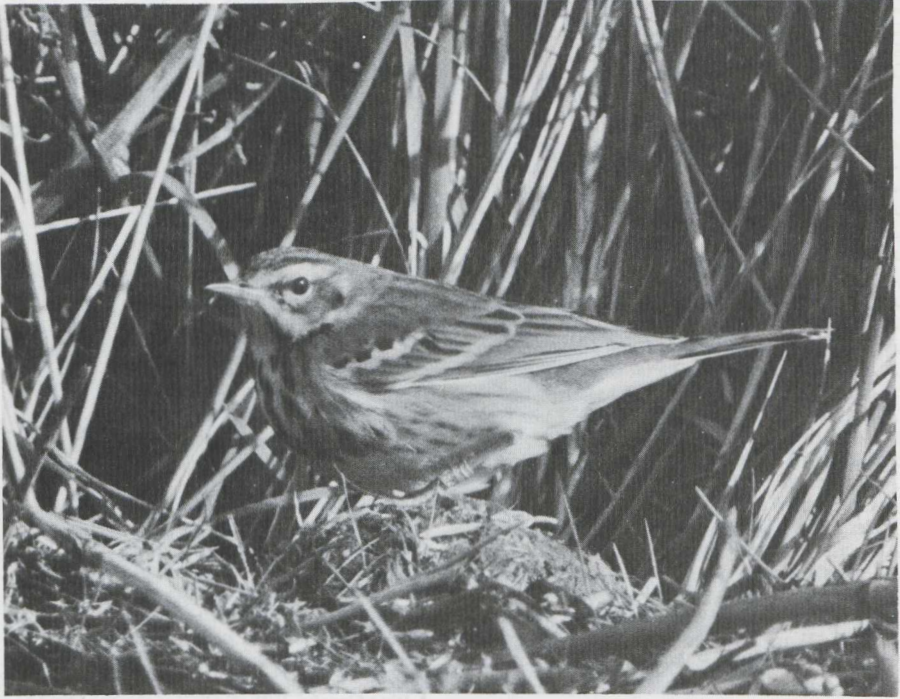
Olive-backed Pipit Anthus hodgsoni , England, October 1981

7 It likely would not require much study to us to decide that the individual in plate 15 ( Dutch Birding 4: 22, 1982) is one of the Palearctic pipits Anthus . The bill size and shape, the general body shape, and the terrestrial behaviour should eliminate all but pipits. Careful plumage analysis though is necessary to determine which species this is. On this still photograph the plumage characters are neatly delineated, a position we are less than always in when observing pipits. Yet even with an active or skulking individual, several conspicuous field marks are available to us given enough patience.