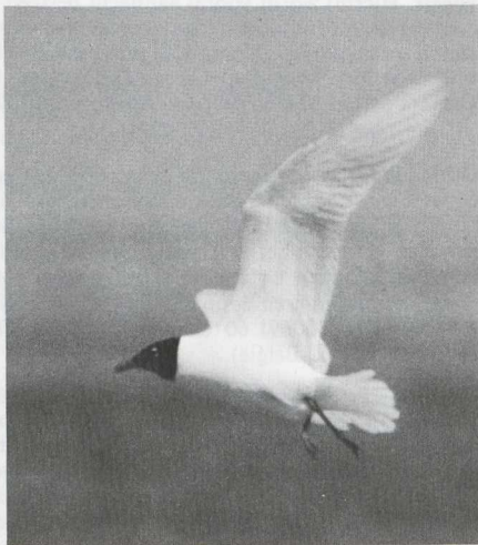
18. Zwartkopmeeuw Larus melanocephalus , De Maasvlakte (ZH), april 1981

Checklist of birds of Egypt In collaboration with the Egyptian Wildlife Service, the Holy Land Conservation Fund en the Ornithological Society of the Middle East Peter Meininger and Wim Mullié are collecting data on the birds of Egypt (including Sinai) in order to compile a checklist of the birds of this country. They would, therefore, greatly appreciate receiving unpublished records and other relevant information for inclusion in the checklist. Birders intending to visit Egypt are requested to contact Peter Meininger (Grevelingenstraat 127, 4335 XE Middelburg or Wim Mullié (Herberdsland 66, 4337 CP Middelburg) so that they can send them standard forms for the survey in behalf of the planned atlas of the breeding birds in this country. The collected information will also be used for summarizing the status of the birds in Egypt in The birds of the western Palearctic by S. Cramp & K. E. L. Simmons (1977-).