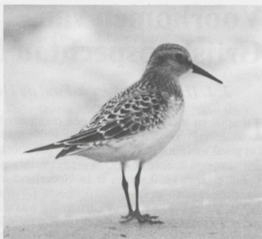
12-14. Bairds Strandloper Calidris bairdii , juveniel, Huizen (NH), augustus 1981