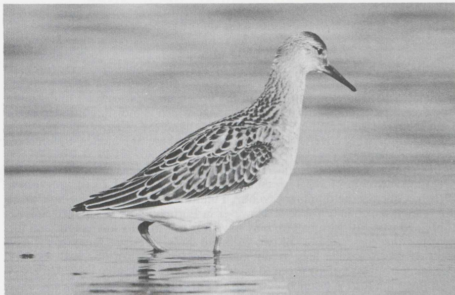
10 Juvenile male Ruff Philomachus pugnax showing typical shape, neat pattern of upperparts and unstreaked underparts, England, August