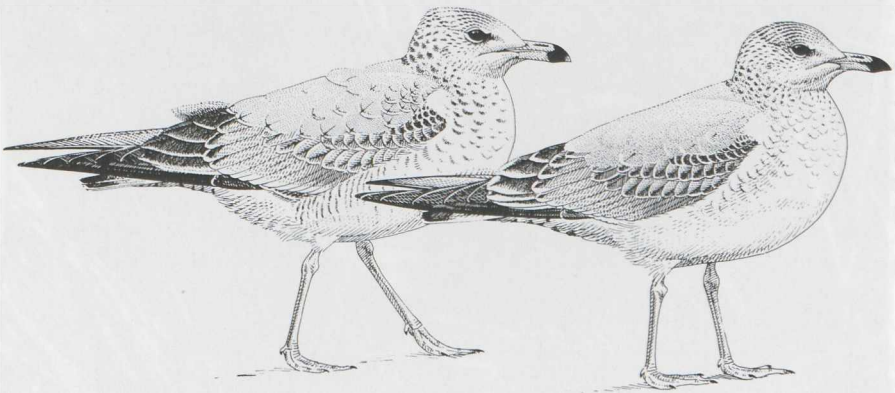
Figure 1. First-winter Ring-billed Gull Larus delawarensis (left) and first-winter Common Gull L. canus (right) (Killian Mullarney)

Most first-winter Ring-billed Gulls have paler mantling with delicate patterning of the scapulars until late February at least when their spring moult commences. Their is usually much less contrast between the scapulars and upperwing-coverts than in Common but Ring-billed that have acquired fresh scapulars, can show obvious contrast here if the coverts are faded. The greater coverts are usually pale dove-grey, fading to whitish towards the tips and forming an obvious light wing panel. The narrow-fringed tertials of first-winter Ring-billed are useful in winter but worn faded tertials of first-summer birds can resemble typical winter Common tertials.