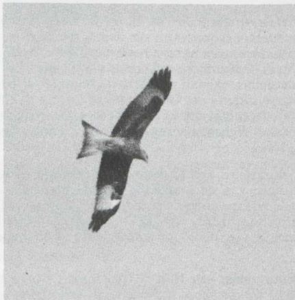
19. Rode Wouw Milvus milvus , Vogelenzang (NH), februari 1982 (René Pop)

Begin december werd een IJsduiker Gavia immer dood gevonden bij Dokkum (F). De IJsduiker die eind december bij Wijk bij Duurstede (U) verscheen bleef tot in 1982. Andere werden in januari gezien aan de Hondsbosse Zeewering (NH), bij Kats (Z) en De Maasvlakte (ZH). De laatste bleef tot in februari. Een Geelsnavelduiker G. adamsii verbleef van 10 tot en met 12 januari op het Veerse Meer (Z).