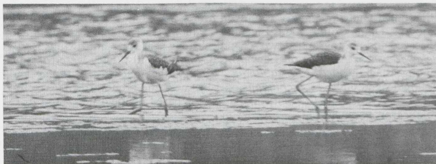
43. Steltkluten Himantopus himantopus , twee jonge vogels in juveniel kleeled, Harderbos (Fl), augustus 1982

NAAKTE DELEN. Ogen egaal donker. Snavel geheel zwart en leek enkele centimeters korter dan bij volwassen vogel. Poten en tenen flets oranje met lichter gekleurde gewrichten.