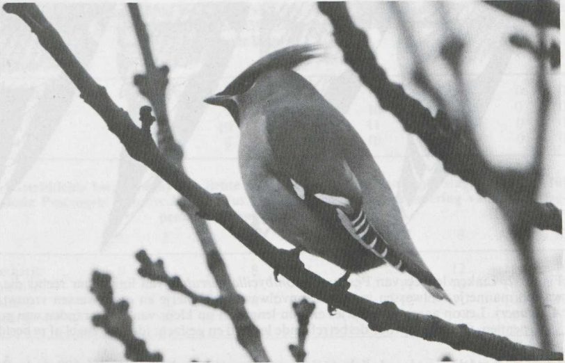
35-37. Pestvogels Bomycilla garrulus (Arie de Knijff). 35. Volwassen mannetje, Haarlem (NH), februari 1982. Lange kuif, groot aantal lange lakpuntjes en brede staarteindband wijzen op mannetje. Let op voor volwassen vogels kenmerkend 'haakjespatroon' op grote slagpennen. 36. Onvolwassen mannetje, Noordwijk (ZH), november 1981. Lange kuif, scherpe keelplekbe-grenzing, nauwelijks lichtere stuit, brede staarteindband en goed ontwikkelde lakpuntjes wijzen op mannetje. Let op voor onvolwassen vogels kenmerkende lichte streep over grote slagpennen. 37. Onvolwassen vrouwtje, Noordwijk (ZH), november 1981. Korte kuif, vage keelplekbe-grenzing en smalle staarteindband wijzen op vrouwtje.