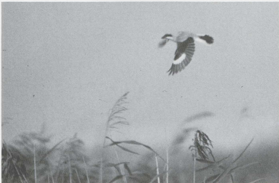
56. Kleine Klapekster Lanius minor , Terschelling (Fr), september 1982 (Eric Bos)

en met 17 juli. Flinke aantallen Grauwe Franjepoten P. lobatus bevonden zich in augustus in het Lauwersmeer (10) en in Zuidelijk Flevoland (zeven). Een juveniele Kleinste Jager Stercorarius longicaudus vloog langs IJmuiden op 22 augustus en een volwassen exemplaar verscheen op Terschelling op 12 september. Bij Oostende werd op 3 september een maximum aantal van 27 Geelpootmeeuwen Larus cachinans geteld. In de loop van de periode steeg het aantal exemplaren op De Maasvlakte tot zes. Verrassend was de ontdekking van twee Geelpoten in Zuidelijk Flevoland in augustus en september. Zoals ieder jaar verschenen in juli en augustus enkele 10-tallen Lachsterns Gelochelidon nilotica op hun slaappleats op het Balgzand (NH). Daarbuiten werden exemplaren gezien te Haren (Gr), Kalmthoutse Heide (A), Steile Bank (Fr), Smilde (D) en Het Zwin. Maximaal 22 Reuzensterns Sterna caspia werden geteld op de traditionele slaappleats op de Steile Bank op 29 augustus. Kleine groepjes werden bovendien vooral gezien in Flevoland. Op 13 juli pleisterde korte tijd een Dougalls Stern S. dougallii op het door badgasten druk bezochte strand van IJmuiden. Op 22 augustus verbleven twee Witwangsterns Chlidonias hybridus te Bloklersdijk. Na de eerste week van