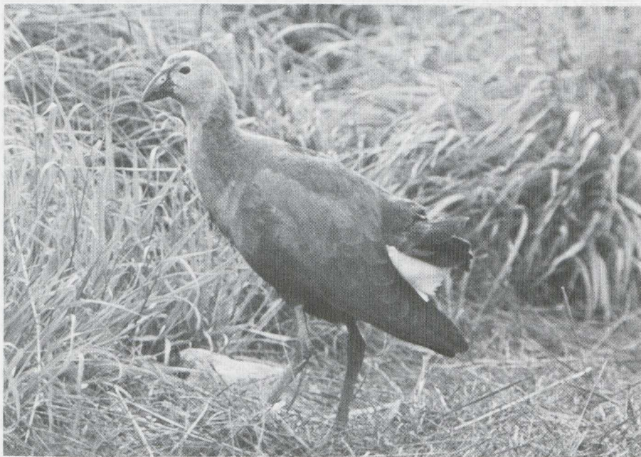
54. Purperkoet Porphyrio porphyrio , onvolwassen vogel, Oorderen (A), oktober 1982

Numansdorp (ZH) en in september te Antwerpen-Blokkersdijk (A), Ohé en Laak (L) en in het Verdrongen land van Saeftinge (Z).. In augustus was bijna dagelijks een drietal juveniele exemplaren te zien bij de observatiehut langs de Knardijk (F). Een Koereiger Bubulcus ibis werd gemeld bij Oudega (Fr) op 4 augustus en een te Emmen (D) op 10 september. Van half juli tot half september verbleven Kleine Zilverreigers Egretta garzetta te Blokkersdijk (maximaal vijf, Doel (OV) (twee), Kallo (OV), Ooypolder (Gld), Rotterdam (ZH) en Terschelling (Fr). Van drie Kleine Zilverers die zich in de Dortsche en Sliedrechtse Biesbosch (ZH) ophielden in augustus, stierven er twee aan botulisme. In Het Zwin (WV) broedde een gemengd paartje Kleine Zilverreiger x Blauwe Reiger Ardea cinerea twee jongen uit. Gedurende de gehele periode vertoefden Grote Zilverreigers E. alba in Zuidelijk Flevoland (F) en bij Piaam (Fr). In augustus werd langs de Knardijk een vermoedelijke