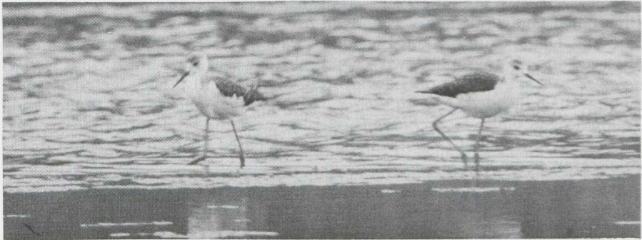
43. Steltkluten Himantopus himantopus , twee jonge vogels in juveniel kleeled, Harderbos (Fl), augustus 1982 (Arnoud B. van den Berg)

NAAKTE DELEN. Ogen egaal donker. Snavel geheel zwart en leek enkele centimeters korter dan bij volwassen vogel. Poten en tenen flets oranje met lichter gekleurde gewrichten.