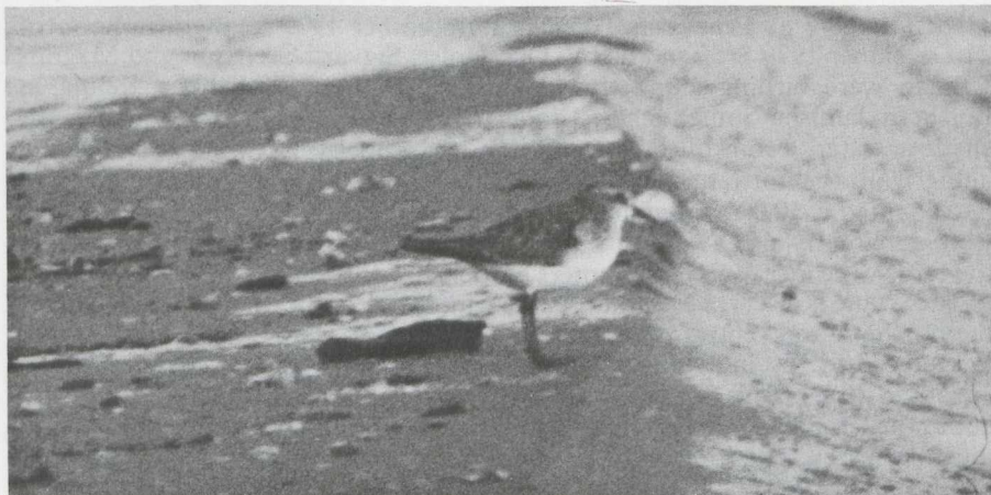
42. Bairds Strandloper Calidris bairdii , Oostvoorne (ZH), januari 1977

smal front weg. De jonge vogels volgen, zoals bij de meeste strandlopers, later. Zij trekken, zowel wat plaats als tijd betreft, meer gespreid en worden dan over de gehele breedte van het Noordamerikaanse continent waargenomen (Jehl 1978). Het zijn ook vrijwel uitsluitend jonge vogels die naar Europa afdwalen. Het is aannemelijk dat de Oostvoornse Bairds al in de voorafgaande herfst naar West-Europa is gekomen.