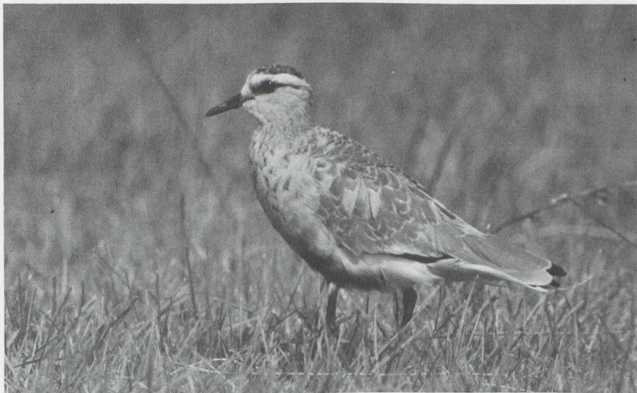
55. Steppekievit Chettusia gregaria , Schiermonnikoog (Fr), augustus 1982

Grote Zilverreiger x Blauwe Reiger geobserveerd. Zwarte Ooievaars Ciconia nigra waren schaars: zij werden gemeld te Kalmthout (A) op 16 augustus, in oostelijk Groningen op 4 september (twee) en in het Lauwersmeer (Fr/Gr) op 5 september.