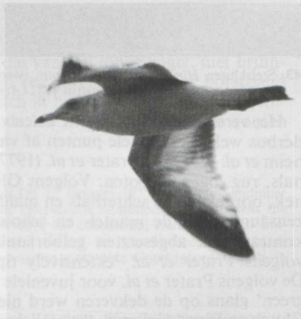
44. Ring-billed Gull Larus delawarensis , second calendar-year, Canary Islands, March 1982

PLUMAGE. Worn, especially on smaller individual which showed extremely worn wing-coverts and remiges. Head and neck white with some dark markings, especially near eye, and dark spots on nape and upperneck. Mantle and scapulars greyish, only little darker than Black-headed Gull. Breast, belly and flanks white with few spots on latter. Upperwing greyish-brown, lesser coverts greyish, median coverts dark brown, greater coverts grey, tertials dark with narrow pale fringes, secondaries pale with dark subterminal bar, inner primaries very pale with dark subterminal spots, outer primaries blackish-brown; underwing showed almost same contrast as upperwing; inner primaries very pale, almost translucent; in flight, black and white wing pattern prominent. Uppertail white with broad dark subterminal band, tips of rectrices whitish (visible only in very good light conditions), outer webs of outer rectrices white; undertail with broad irregular subterminal band.