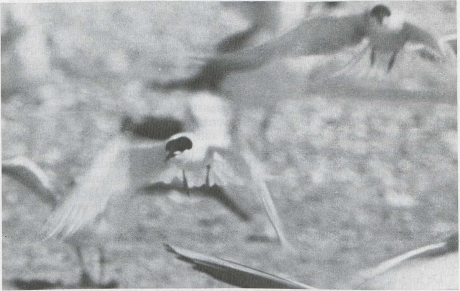
45-46. Dougalls Stern Sterna dougallii , volwassen vogel in zomerkleed, IJmuiden (NH), juli 1982 (Arnoud B. van den Berg)