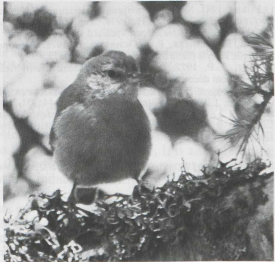
50-51. Algerian Nuthatches Sitta ledanti , probably female (left) and juvenile (right), Algeria, July 1982

may arise when in a favourable year two nests are made (like sometimes in the Corsican Nuthatch S. whiteheadi ). In that case, some first calendar-year birds may have completed their post-juvenile moult and resemble the adults while others are still in juvenile plumage. However, this does not seem the case since Vielliard observed juveniles which had just left the nest.