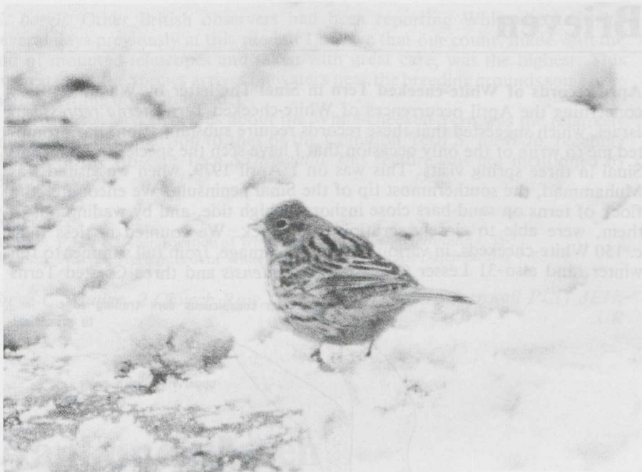
53. Ortolaan Emberiza hortulana , mannetje, Lelystad-Haven (Fl), december 1981

Misschien dat het systematisch verzamelen van winterwaarnemingen van zomervogels kan leiden tot een beter inzicht in de oorzaken die aan deze late waarnemingen ten grondslag liggen.