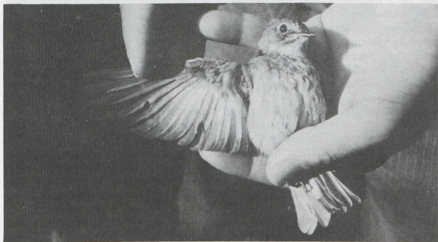
47. Brown Flycatcher Muscicapa latirostris , after first-year, BRD, August 1982 ( Vogelwarte Helgoland )

MEASUREMENTS AND WING FORMULA. Wing length (maximum length) 77.5 mm; tail length 47.5 mm; bill length (from forehead feathering) 13.0 mm and bill width (at base) 7.0 mm. First primary 45.9 mm shorter than second; outermost secondary 27.5 mm shorter than tip of wing. Third primary longer than or equal to fourth, fourth longer than second, second longer than fifth, and fifth longer than sixth primary.