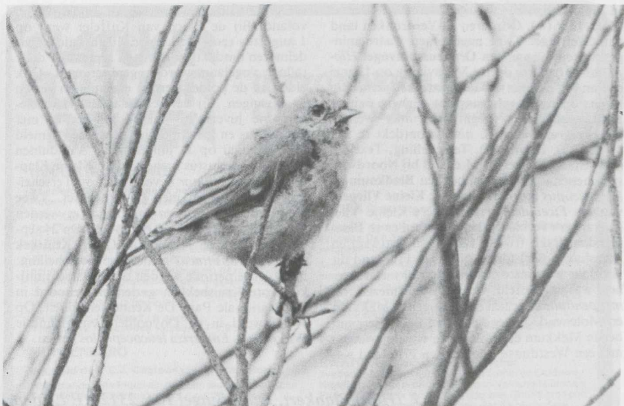
57-58. Buidelmezen Remiz pendulinus , jonge vogel in juveniel kleeed (boven) en ruiend naar volwassen kleeed (onder), De Blocq van Kuffeler (Fl), augustus en september 1982 ( René Pop )