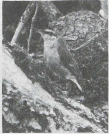
48-49. Algerian Nuthatches Sitta ledanti , adults (probably males), Algeria, July 1982