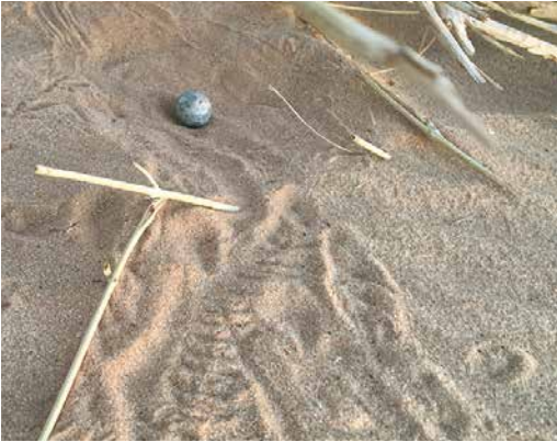
121 Nest with egg of Golden Nightjar / Goudgele Nachtzwaluw Caprimulgus eximius , near Ouadâne, Adrar, Mauritania, 19 April 2018 (Josh Jones). Close up of nest and single egg, showing footprints on and off nest.