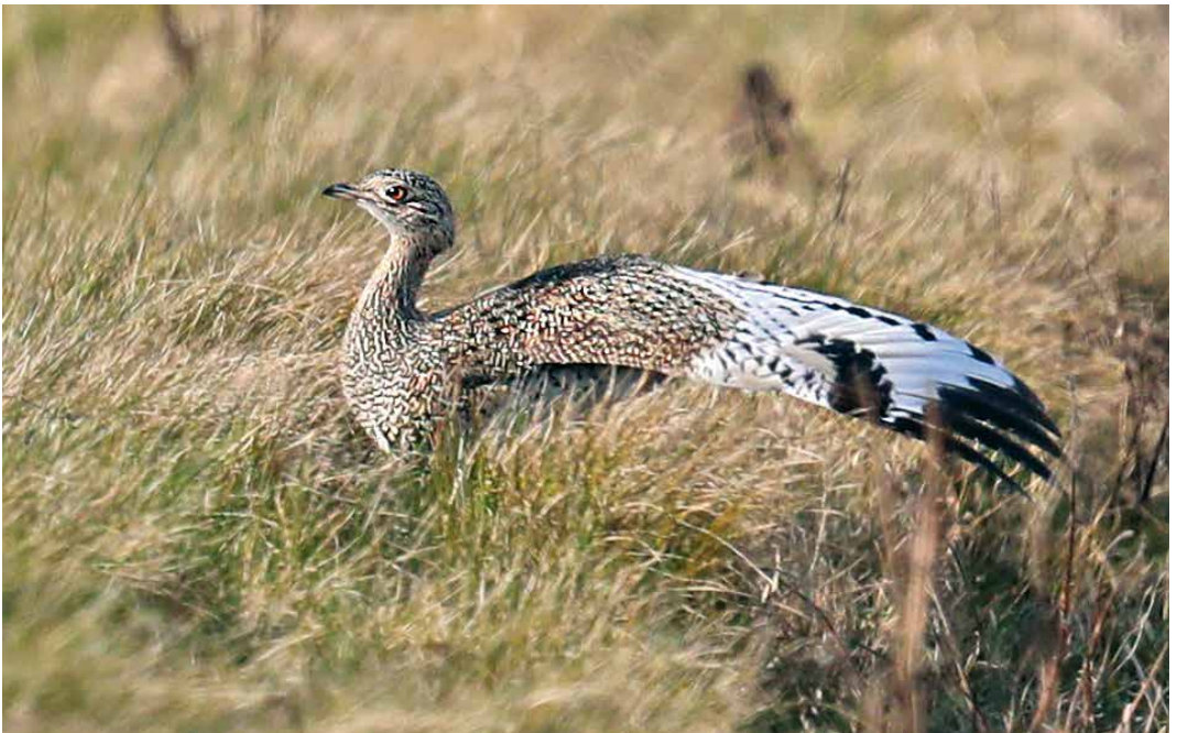
163 Kleine Trap / Little Bustard Tetrax tetrax , eerste-winter, De Zilk, Zuid-Holland, 17 februari 2019 (René van Rossum)