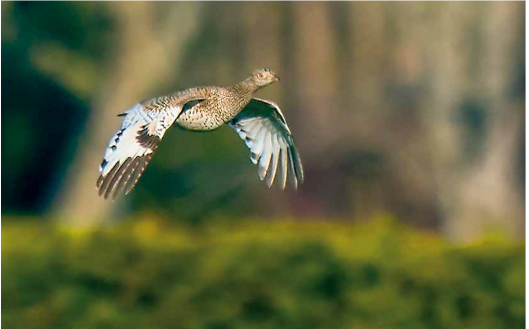
162 Kleine Trap / Little Bustard Tetrax tetrax , eerste-winter, De Zilk, Zuid-Holland, 15 februari 2019 (Arnoud B van den Berg)