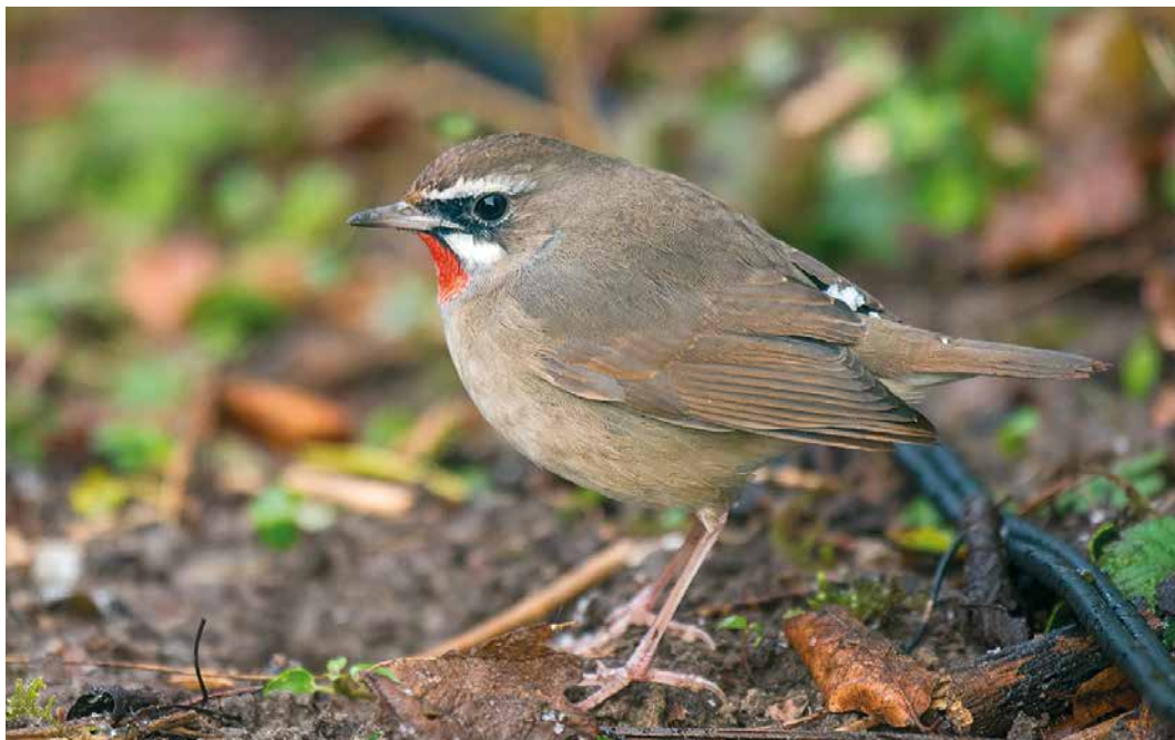
12 Roodkeelnachtegal / Siberian Rubythroat Calliope calliope , eerste-winter mannetje, Hoogwoud, Noord-Holland, 7 maart 2016 ( Arnoud B van den Berg )