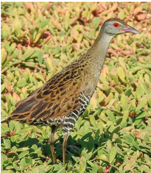
[Dutch Birding 41: 51-62, 2019]

56 African Crane / Afrikaanse Kwartelkoning Crex egregia , Santa Maria, Sal, Cape Verde Islands, 6 January 2019