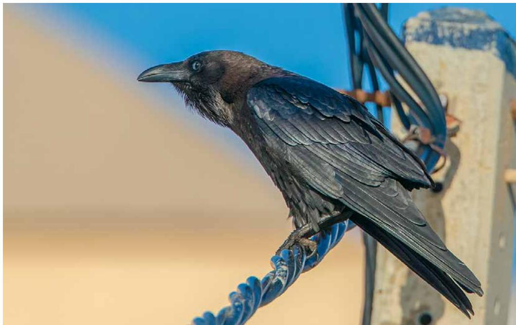
85 Brown-necked Raven / Bruinnekraaf Corvus ruficollis , adult, Cabo de Palos, Cartagena, Murcia, Spain, 3 January 2019

recorded at Leziria Grande, Vila Franca de Xira, Portugal, from 2 December to late January (one or two previous records). If accepted, an East Siberian Wagtail M. ocularis reported at Al Beed farm on 18 November will be the first for Oman. The first for Sweden was photographed at Sandhamn, Gotland, on 24 November. Previous WP records were in the UAE in November 2017 and in Cyprus in March-April 2018 (cf Dutch Birding 40: 174-177, 196, 2018). (Only) the fifth Citrine Wagtail M. citreola for Australia was seen at Whyalla on 27 December. If accepted, a Richard's Pipit Anthus richardi at Necunoscut, Constanța, from 20 December will be (only) the second for Romania. As many as c 41 were found in France in December. The third Blyth's Pipit A. godlewskii for Denmark stayed at Skagen on 16-28 November. The eighth Olive-backed Pipit A. hodgsoni for Morocco was reported at Rabat on 3 December. An adult Red-throated Pipit A. cervinus photographed at Sierra Los Cuchumatanes, near La Capellania, on 15 April 2018 was the first for Guatemala and Central America (Bull Br Ornithol Club 138: 383-385, 2018). A Siberian Buff-bellied Pipit A. rubescens japonicus at Clos de Gouine, Arles, from 22 December onwards was the first for France.