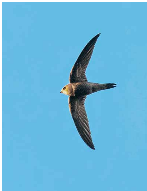
87 Vale Gierzwaluw / Pallid Swift Apus pallidus , juveniel, De Cocksdoorp, Texel, Noord-Holland, 11 november 2018 88 Vale Gierzwaluw / Pallid Swift Apus pallidus , juveniel, Oostkapelle, Zeeland, 11 november 2018 89 Bairds Strandloper / Baird's Sandpiper Calidris bairdii , eerstejaars, Bolwerksplas, Deventer, Overijssel, 3 november 2018