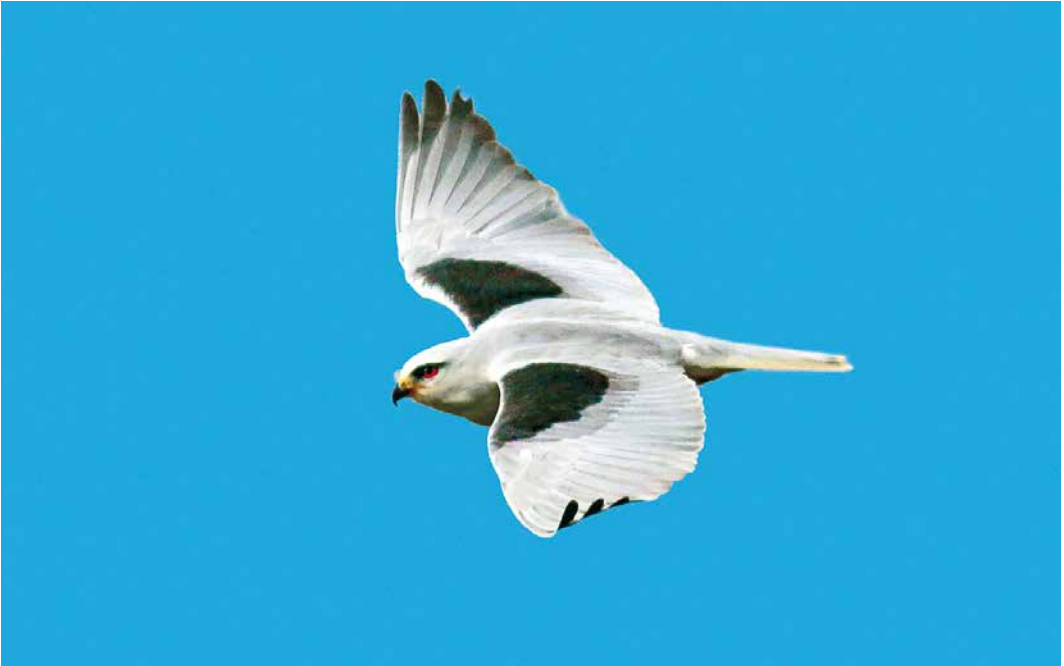
90 Grijsse Wouw / Black-winged Kite Elanus caeruleus , eerstejaars, Polderweg, Wieringen, Noord-Holland, 11 november 2018

onvolwassen Grauwe Franjepoot P. lobatus van 17 tot 22 november in Waal en Burg op Texel. Deze periode was niet goed voor zeetrek. Dat bleek ook uit het lage aantal van acht Rosse Franjepoten langs telposten, een soort die normaliter in november-december piekt. In de afgelopen 10 jaar was alleen 2009 slechter (met twee). Topjaar was 2011 met 81 in deze twee maanden. Vermeldenswaard is een exemplaar op 4 en 5 december nabij Aerdt, Gelderland, vlakbij de grens met Duitsland. De eerstejaars Steppevorkstaartplevier Glareola nordmanni die zich van 21 oktober tot 7 november ophield bij Batenburg, Gelderland, werd op 18 november teruggevonden bij Lith, Noord-Brabant, waar hij tot 30 november bleef.