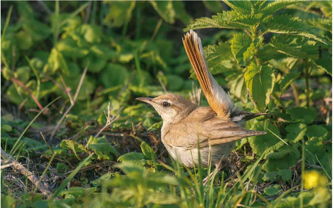
14 Rosse Waaiertaart / Rufous-tailed Scrub Robin Cercotrichas galactotes , eerstejaars, Maasvlakte, Zuid-Holland, 20 september 2016