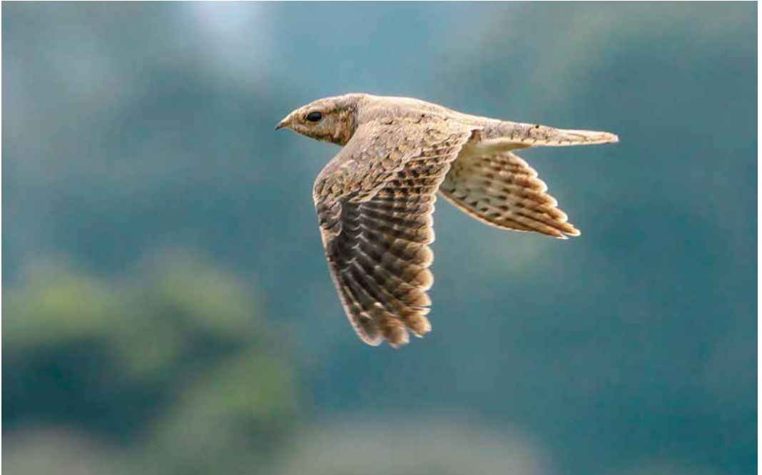
42-43 Egyptian Nightjar / Egyptische Nachtzwaluw Caprimulgus aegyptius , Chorokhi delta, Batumi, Georgia, 27 August 2017 ( Simon Cavallès )