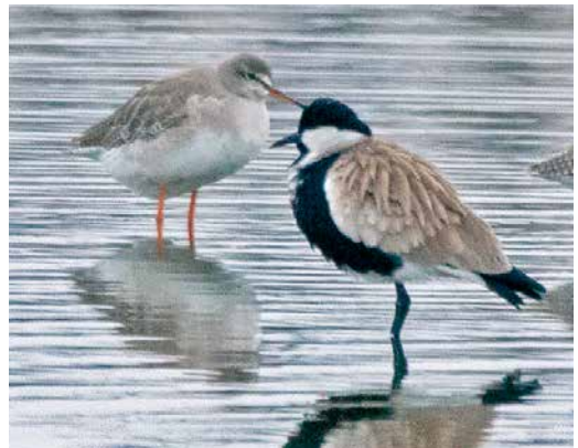
58 King Eider / Koningseider Somateria spectabilis , first-winter male, with Common Eider / Eider S. mollissima , Tróia, Grândola, Setúbal, Portugal, 1 January 2019 59 American Royal Tern / Amerikaanse Koningsstern Sterna maxima , third-year, St Mary's, Scilly, England, 26 December 2018 60 Laughing Gull / Lachmeeuw Larus atricilla , first-winter, Hamburg, Germany, 21 December 2018 61 Spur-winged Lapwing / Sporenkievit Vanellus spinosus , with Spotted Redshank / Zwarte Ruiterting Tringa erythropus , Pisculeț, Dolj, Romania, 25 November 2018

Skara, Sweden, on 2-13 December and another one was photographed on Faial, Azores, on 14 January. The identification of the first confirmed female Green-winged Teal A. carolinensis for Britain and Ireland, on Mainland, Shetland, Scotland, in May 2018, is discussed by Roger Riddington in Br Birds 112: 35-40, 2019; the bird was paired with a male Green-winged.