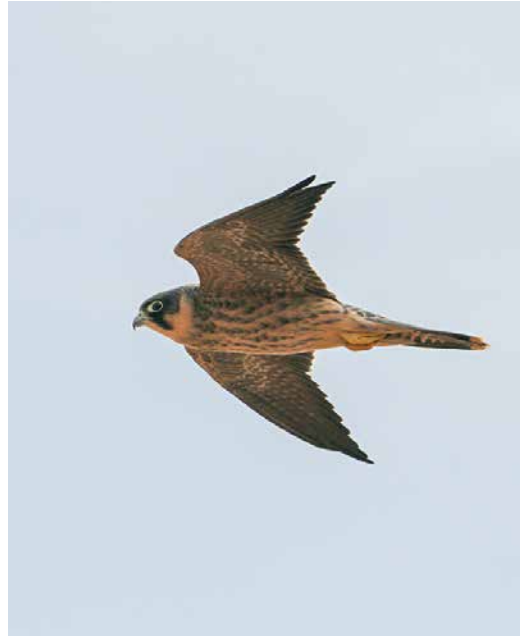
39 Sooty Falcon / Woestijnvalk Falco concolor , juvenile, Wadi el Gemal island, Egypt, 15 November 2017 (Mohamed I Habib). Resembling Eurasian Hobby F. subbuteo in head pattern but upperparts greyish brown with pale rufous fringed feathers. Cere and other bare parts dirty greenish. Also note long and narrow wings reaching well beyond tail-tip. 40 Sooty Falcon / Woestijnvalk Falco concolor , juvenile, Wadi el Gemal island, Egypt, 15 November 2017 (Mohamed I Habib). Underwing appearing very dark and uniform. 41 Eleonora's Falcon / Eleonora's Valk Falco eleonora , juvenile, Gebel al Ziat, Egypt, 26 October 2013 (Mohamed I Habib). Living decoy used by falconer.