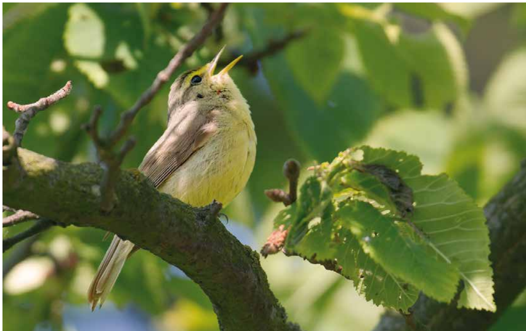
203-204 Sulphur-bellied Warbler / Steenboszanger Phylloscopus griseolus , Christiansø, Bornholm, Denmark, 3 June 2016