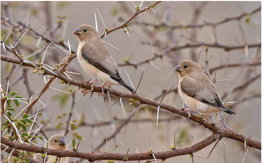
251 African Silverbills / Zilverbekjes Euodice cantans , Oued Tamanrasset, Algeria, 24 March 2019