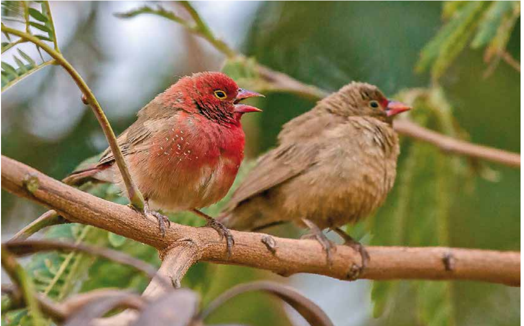
250 Red-billed Firefinches / Vuurvinkjes Lagonosticta senegala , male and female, garden at Hotel Bois Petrifie, Tamanrasset, Algeria, 24 March 2019