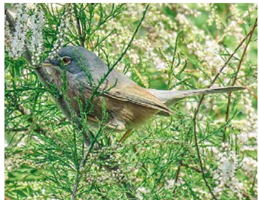
242 Seebohm's Wheatear / Seebohms Tapuut Oenanthe seebohmi , first-summer male, Templeuve, Hainaut, Belgium, 7 May 2019 ( Vincent Legrand ) 243 Pallas's Reed Bunting / Pallas' Rietgors Emberiza pallasii , male, Rönnskär, Kirkkonummi, Finland, 19 May 2019 ( Mika Bruun ) 244 White-crowned Sparrow / Witkruingors Zonotrichia leucophrys , Sandøy, Bulandet, Sogn og Fjordane, Norway, 5 May 2019 ( Anders Braanaas ) 245 Spanish Sparrow / Spaanse Mus Passer hispaniolensis , male, Brovande, Skagen, Denmark, 15 May 2019 ( Leif Jensen ) 246 Black-headed Wagtail / Balkankwikstaart Motacilla feldegg , male, Santa Maria, Sal, Cape Verde Islands, 19 April 2019 ( Uwe Thom ) 247 Tristram's Warbler / Atlasgrasmus Sylvia deserticola , male, Platja de l'Arbre del Gos, Albufera de Valencia, Valencia, Spain, 13 April 2019 ( Joan Ballagon )