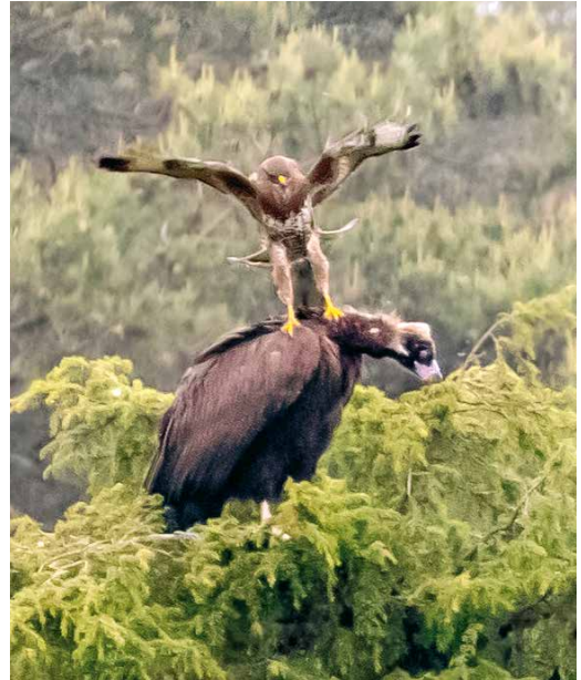
268 Monniksgier / Cinereous Vulture Aegypius monachus , tweede-kalenderjaar, aangevallen door Buizerd / Common Buzzard Buteo buteo , Hellendoorn, Overijssel, 25 mei 2019

landse grens. De vogel was in het wild geboren, droeg een witte kleurring met zwarte letters FUH en was afkomstig van de Franse herintroductiepopulatie in de Grands Causses (sinds 2004 zelfvoorzienend). Op 21 mei gingen beide gieren aan het begin van de middag op de wieden en werden door drie waarnemers boven Nederlands grondgebied gezien aan de noordkant van Maastricht, Limburg, om daarna van de radar te verdwijnen.