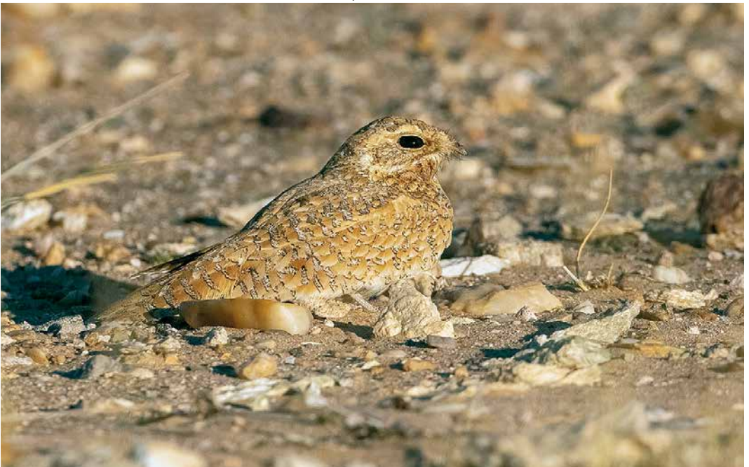
228 Golden Nightjar / Goudgele Nachtzwaluw Caprimulgus eximius , Oued Chiaf, c 55 km of Aousserd, Western Sahara, Morocco, 8 April 2019 (David Monticelli)