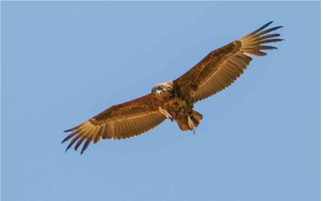
232 Bateleur / Bateleur Terathopius ecaudatus , second calendar-year, Eilat, Israel, 10 April 2019 233 Omani Owl / Omaanse Uil Strix butleri , juvenile, Kangan, Bushehr, Iran, 10 May 2019 234 Brown-necked Raven / Bruinnekraaf Corvus ruicollis , Lampedusa, Italy, 29 March 2019