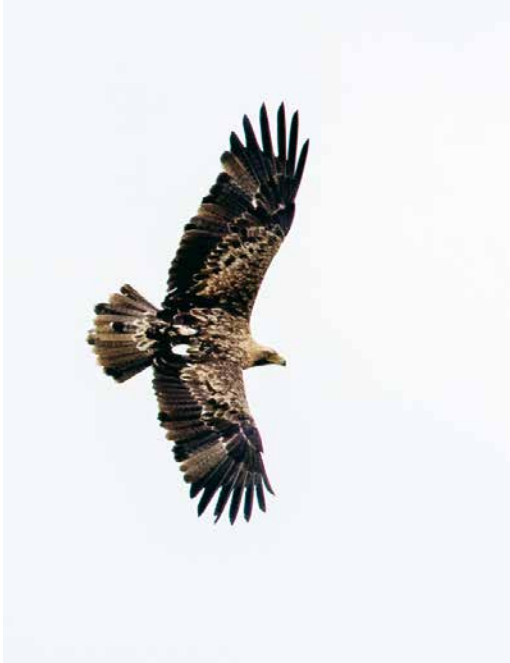
190 Keizerarend / Eastern Imperial Eagle Aquila heliaca , vierde-kalenderjaar mannetje (A506), Genemuiden, Overijssel, 4 oktober 2017

name buitenste middelste armdekveren lichter. Grote dekveren met vrij brede lichte randen. Ondervleugel met groot contrast tussen overwegend donkere slagpenen en veel lichtere dekveren. Handpenen en armpennen overwegend donker (zwartachtig), met onopvallende lichtere bandering. Binnenste handpenen en buitenste armpennen veel lichter, duidelijk venster vertoend, als op bovenzleugel; basale bandering hier meest opvallend. Ondervleugeldekveren licht geelbruin, met opvallende, donkerdere vlekking/streping (in middelste dekveren bijna 50% donkere veren).