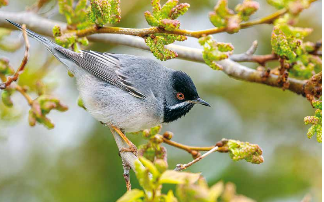
237 Rüppell's Warbler / Rüppells Grasmus Sylvia ruppeli , second calendar-year male, Saintes-Maries-de-la-Mer, Bouches-du-Rhône, France, 6 April 2019