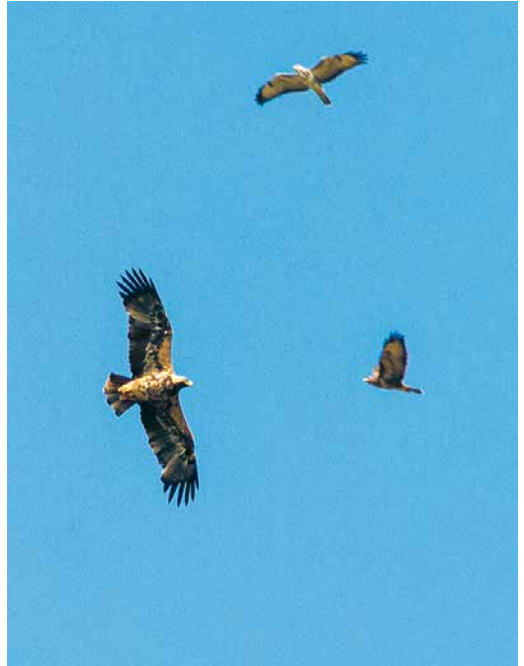
183 Keizerarend / Eastern Imperial Eagle Aquila heliaca , vierde-kalenderjaar mannetje (A506), Brobbelbies-Noord, Noord-Brabant, 27 september 2017 184 Keizerarend / Eastern Imperial Eagle Aquila heliaca , vierde-kalenderjaar mannetje (A506), met Buizerds / Common Buzzards Buteo buteo , Brobbelbies-Noord, Noord-Brabant, 27 september 2017 185 Keizerarend / Eastern Imperial Eagle Aquila heliaca , vierde-kalenderjaar mannetje (A506), met Haas / Brown Hare Lepus europaeus , Genemuïden, Overijssel, 4 oktober 2017