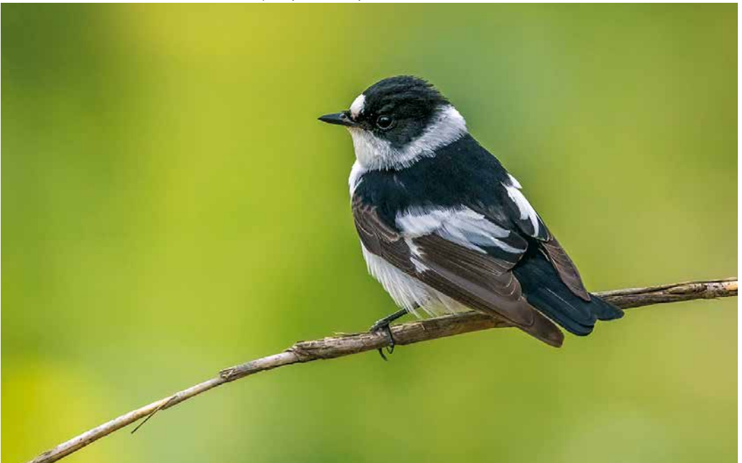
238 Collared Flycatcher / Withalsvliegenvanger Ficedula albicollis , second calendar-year male, Barcelona, Catalunya, Spain, 20 April 2019 ( Rafael Armada )