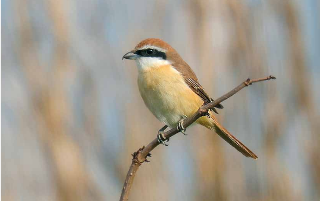
235 Brown Shrike / Bruine Klauwier Lanius cristatus , adult male, Great Cowden, East Yorkshire, England, 11 May 2019 (Graham Jepson)