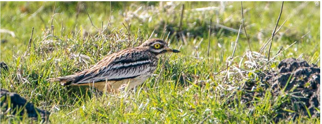
258 Dwerggors / Little Bunting Emberiza pusilla , Bilthoven, Utrecht, 2 maart 2019 259 Pallas' Boszanger / Pallas's Leaf Warbler Phylloscopus proregulus , Haarlem, Noord-Holland, 6 april 2019 260 Griel / Eurasian Stone-Curlew Burhinus oediconemus , Lentevreugd, Wassenaar, Zuid-Holland, 24 maart 2019

Voor al deze soorten waren dit de hoogste aantallen in maart-april van de laatste 10 jaar (Grauwe Kiekendief scoorde ook in 2011 51 exemplaren)! Vooral de telposten Noordkaap en Eemshaven in Groningen scoorden erg goed. Sperwer Accipiter nisus verdient een aparte vermelding, met maar liefst 6130 over telposten. De nieuwe voorjaarsrecords die daarbij op 17 (165), 18 (174) en 19 april (228) in de Eemshaven werden opgetekend, bleven telkens maar kort staan en culmineerden toen er op 24 april zelfs 260 passeerden. Op die dag vlogen er ook 235 (ongetwijfeld veelal dezelfde) langs de nabijgelegen Noordkaap, waardoor de hele top vijf van beste voorjaarsdagen nu uit 2019 stamt. Het oude record was ook van de Eemshaven: 159 in 2003. Het najaarsrecord ligt niet alleen een stuk hoger (387 op 3 oktober 2010 langs De Vulkaan), ook stammen alle topdagen van de westkust. Het aantal Grijze Wouwen Elanus caeruleus was opnieuw amper bij te houden. Er waren meldingen op 30 en 31 maart in het Haaksbergerveen, Overijssel; op 31 maart bij Slenaken, Limburg; op 5 april bij Lopik,