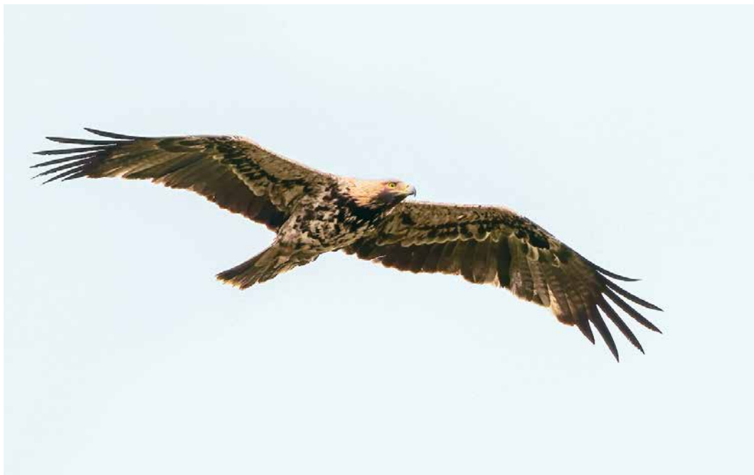
186-187 Keizerarend / Eastern Imperial Eagle Aquila heliaca , vierde-kalenderjaar mannetje (A506), Genemuiden, Overijssel, 4 oktober 2017