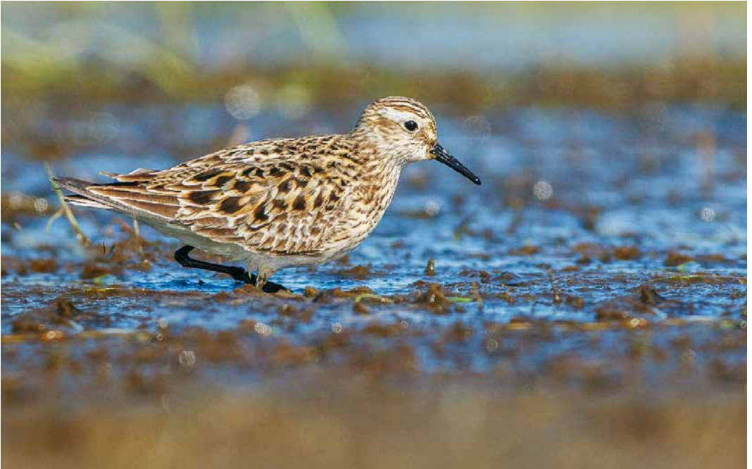
227 Baird's Sandpiper / Bairds Strandloper Calidris bairdii , Garður, Iceland, 10 May 2019