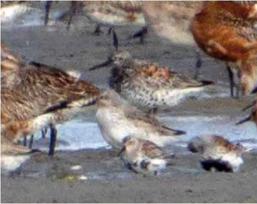
176 Grote Kanoet / Great Knot Calidris tenuirostris , adult, met Rosse Grutto's / Bar-tailed Godwits Limosa lapponica , Kanoeten / Red Knots C. canutus en Bonte Strandlopers / Dunlins C. alpina , De Cocksdorp, Texel, Noord-Holland, 15 mei 2016