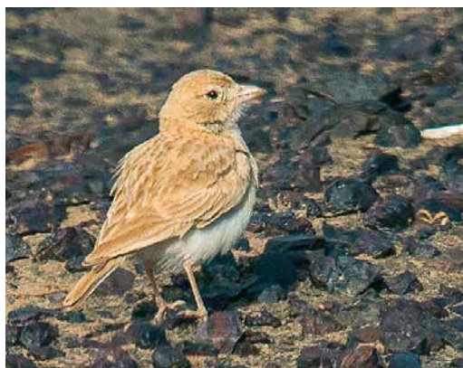
219 Red-footed Booby / Roodpootgent Sula sula , adult, Raso, Cape Verde Islands, 24 April 2019 ( Daniel López-Velasco ) 220 Black-winged Kite / Grijze Wouw Elanus caeruleus , Kondratowice, Dolnośląskie, Poland, 12 April 2019 ( Krzysztof Ostrowski ) 221 Black Heron / Zwarte Reiger Egretta ardesiaca , Santiago, Cape Verde Islands, 28 April 2019 ( Daniel López-Velasco ) 222 Belted Kingfisher / Bandijsvogel Megasceryle alcyon , female, Varmá river, Mosfellsbær, Iceland, 10 April 2019 ( Guðmundur Falk ) 223 Mourning Dove / Treurduif Zenaida macroura , North Ronaldsay, Orkney, Scotland, 29 April 2019 ( Toby Green ) 224 African Dunn's Lark / Afrikaanse Dunns Leeuwerik Eremalauda dunnii dunnii , Dayet Srij, Merzouga, Morocco, 2 April 2019 ( Arnaud B van den Berg )