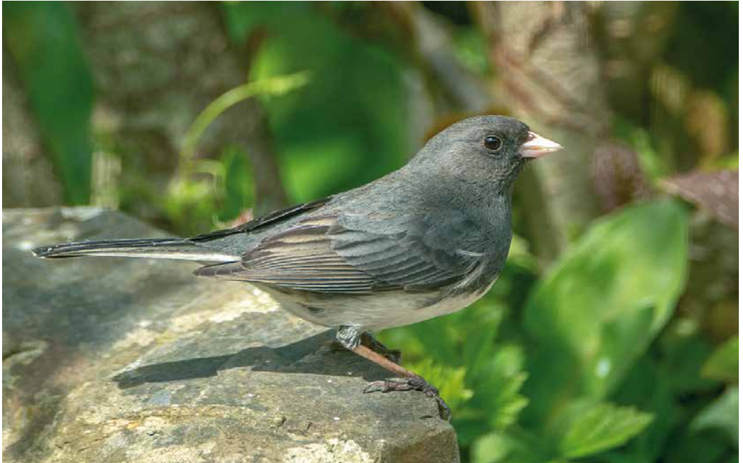
248 Dark-eyed Junco / Grijze Junco Junco hyemalis , first-summer male, Westward Ho!, Devon, England, 27 April 2019 ( John Wall )