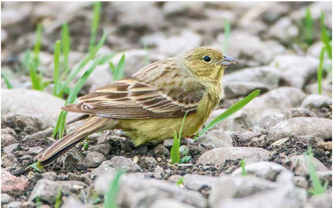
249 Eastern Cinereous Bunting / Oostelijke Smyrnagors Emberiza cineracea semenowi , male, Sundre, Gotland, Sweden, 17 May 2019