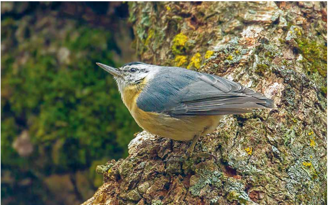
236 Algerian Nuthatch / Algerijnse Boomklever Sitta ledanti , male, Djimla forest, Jijel, Algeria, 27 March 2019