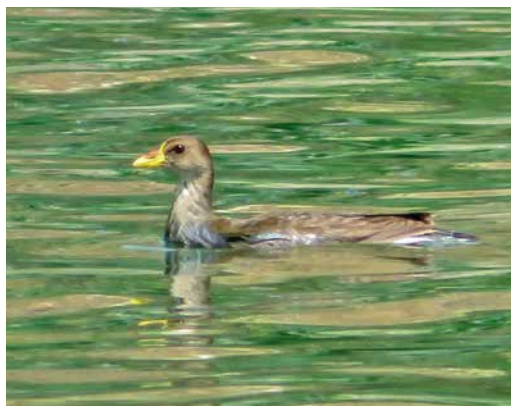
139 Little Bustard / Kleine Trap Tetrax tetrax , first-winter, De Zilk, Zuid-Holland, Netherlands, 15 February 2019 140 Lesser Moorhen / Afrikaans Waterhoen Paragallinula angulata , immature, Santa Maria, Sal, Cape Verde Islands, 9 March 2019 141 Bufflehead / Buffelkoepeend Bucephala albeola , female, Rabil lagoon, Boa Vista, Cape Verde Islands, 24 January 2019 142 Lesser Moorhen / Afrikaans Waterhoen Paragallinula angulata , first-winter, Barragem de Figueira Gorda, Santiago, Cape Verde Islands, 24 February 2019

mental North America and the Atlantic Ocean was seen out of Hatteras, North Carolina, USA, on 29 May 2018. One photographed from a boat off Durban on 11 November 2018 was the first for South Africa. The first for the WP was photographed c 5 nautical miles south off Mirbat, Dhofar, Oman, on 23 February. A Jouanin's Petrel Bulweria fallax at Jahra pools reserve on 12 May 2018 has been accepted as the first for Kuwait; in the 'greater' WP, the species is a regular visitor to the coasts of Yemen, Oman and the United Arab Emirates (UAE). Roman et al analysed the cause of death of 1733 seabirds (mainly tubenoses) from 51 species in Australia and New Zealand. They found that one in three had ingested debris and that balloons were the highest-risk plastics, being 32 times more likely to kill seabirds than hard plastics (Sci Rep 9: 3202, 2019).