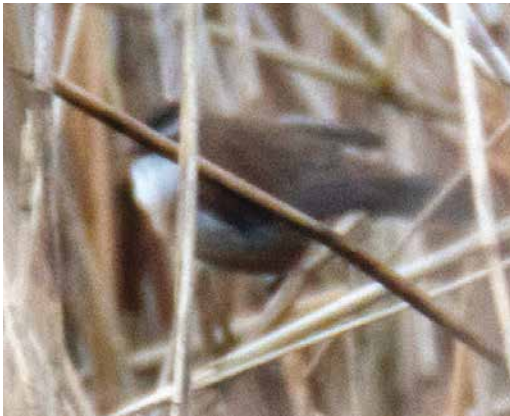
112 Zwartkoprietzanger / Moustached Warbler Acrocephalus melanopogon , Brabantse Biesbosch, Noord-Brabant, 21 maart 2017 (Ad van Benten)

Bij de zang van beide vogels ontbraken het voor Kleine Karekiet karakteristieke regelmatige ritme en de voor Rietzanger karakteristieke krassende to-