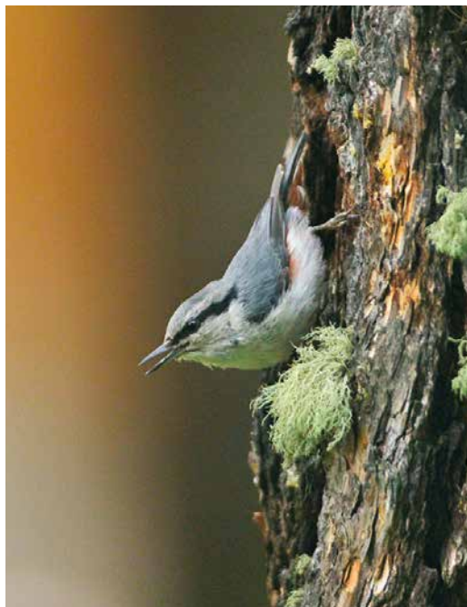
115 Eurasian Nuthatch / Boomklever Sitta europaea asiatica , Aktru Camp, Siberian Altai, Russia, 23 June 2017 (Laurent Vallotton). Viewed from an angle, maybe in conjunction with abrasion or coal staining, one can get impression of black cap. Small size, whitish underparts and white supercilium may lead to confusion with Chinese Nuthatch S. villosa . 116-117 Eurasian Nuthatch / Boomklever Sitta europaea asiatica , Aktru Camp, Siberian Altai, Russia, 23 June 2017 (Laurent Vallotton). Rufous on flank and undertail-coverts rule out Chinese Nuthatch S. villosa .