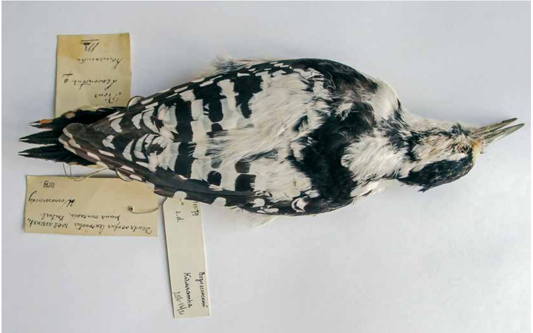
124-125 White-backed Woodpecker / Witrujspecht Dendrocopos leucotos voznesenskii Buturlin, 1907, type specimen, Zoological Museum, Moscow State University, Russia (Yaroslav A Red'kin). Large white back patch and wide white dorsal bands. Flank slightly streaked on very white background, quite different from forms of Russian Far East ( D l sinicus-leucotos ). Rectrices predominantly white.

White-backed Woodpecker does not occur in Kamchatka, Russia