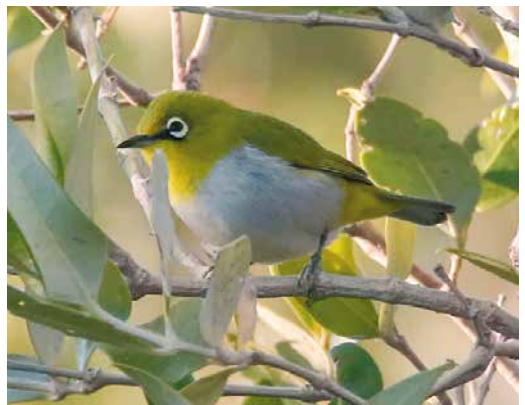
143 Intermediate Egret / Middelste Zilverreiger Ardea intermedia , Khour-e Tiab, Hormozgan, Iran, 21 November 2018 (Lasse / Laine) 144 Long-billed Dowitcher / Grote Grijsze Snip Limnodromus scolopaceus , first-winter, Bandar Abbas, Hormozgan, Iran, 10 February 2019 (Zbigniew Kajzer) 145 Vega Gull / Vegameeuw Larus vegae , adult, Qeshm island, Hormozgan, Iran, 24 January 2019 (Javad Parastegari) 146 Siberian Crane / Siberische Witte Kraanvogel Leucogeranus leucogeranus , adult male ('Omid'), Fereydunkenar, Mazandaran, Iran, 3 February 2019 (Zbigniew Kajzer) 147 White-crowned Wheatear / Witkruintapuit Oenanthe leucopyga , adult, Ghatrouiyeh, Fars, Iran, 14 February 2019 (Mohammad Rahimi) 148 Indian White-eye / Indiase Brillvogel Zosterops palpebrosus , Gaz river mouth, Bandar-e Sirik, Hormozgan, Iran, 8 February 2019 (Zbigniew Kajzer)