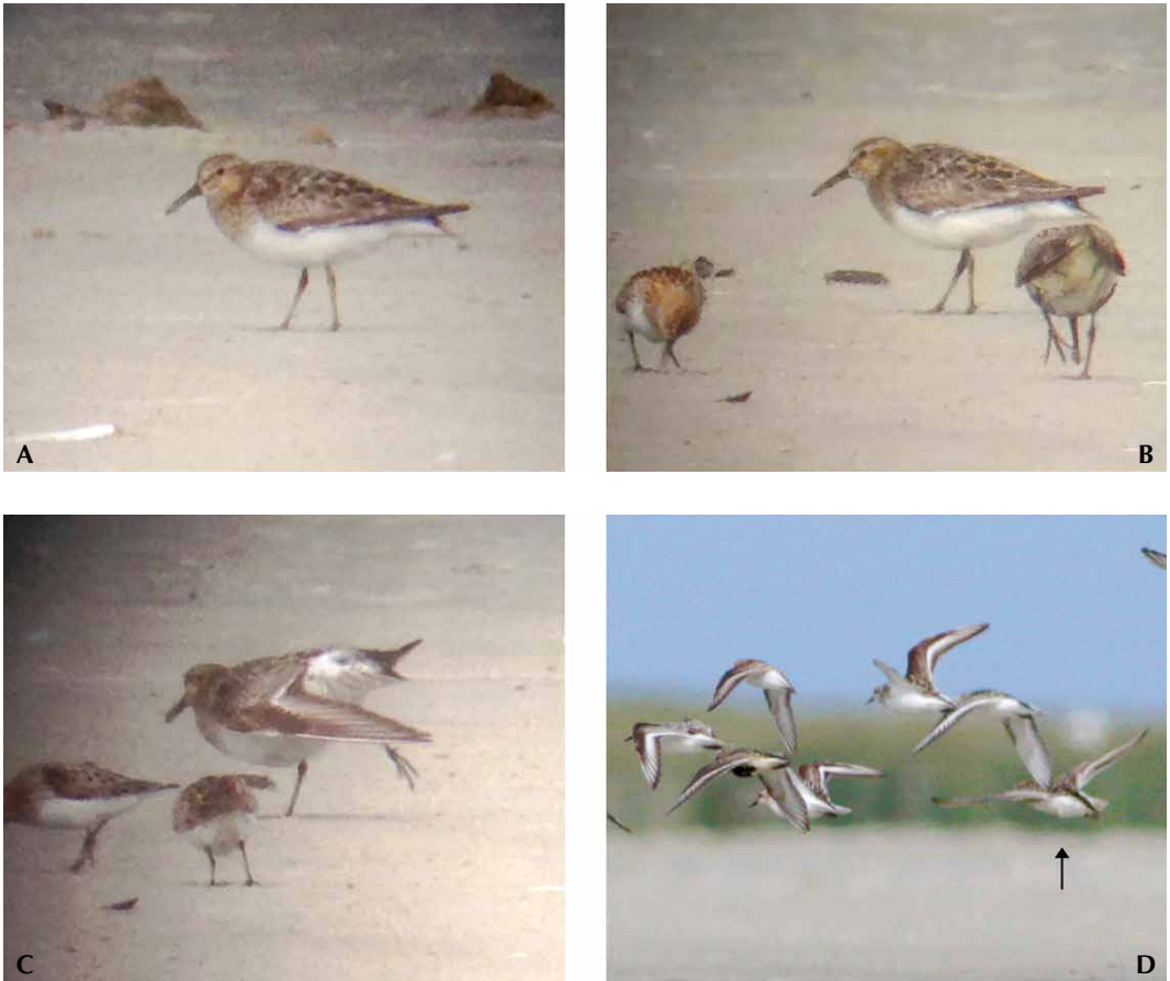
FIGURE 1 Presumed hybrid Sanderling x Pectoral Sandpiper / vermoedelijke hybride Drieteenstrandloper x Gestreepte Strandloper Calidris alba x melanotos , Ameland, Friesland, Netherlands, 2 August 2017. A 'horizontal' posture and drooping tail; B best image, together with Little Stint C minuta (left) and Dunlin C alpina (right); C showing stretched wing (together with two Little Stints); D in flight with four Sanderlings C alba , Dunlin and Little Stint. Arrow points to Calidris hybrid.

adult. Various features did not fit an (adult) Pectoral, most notably: 1 dark leg colour; 2 irregular, patchy pattern of the scapulars; 3 conspicuous white wing-bar; 4 absence of pale bill base; and 5 rather short tibia. The bird showed some features that can be seen in adult Baird's Sandpiper C bairdii , most notably the wing pattern. However, Baird's is a relatively small and slender sandpiper (eg, smaller, more elongated and shorter legged than Sanderling), and has primaries extending far beyond the tail-tip. The bird also somewhat recalled a Sanderling. Adult Sanderling in breeding plumage can show dense breast streaking that is sharply separated from the white belly. Adults may also develop a pale supercilium behind the