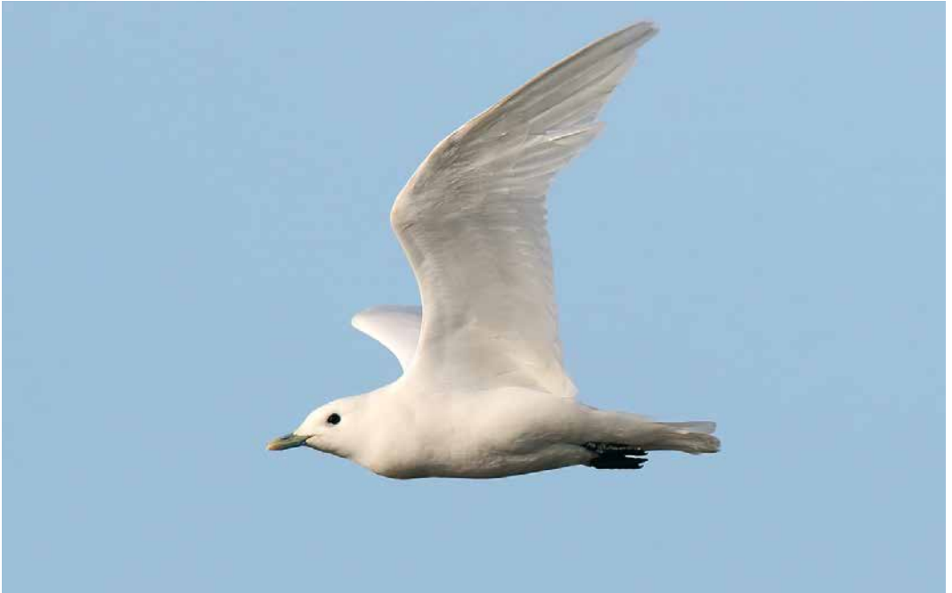
151 Ivory Gull / Ivoormeeuw Pagophila eburnea , adult, Stevenston Point, Ayrshire, Scotland, 11 February 2019 (Andrew Jordan)