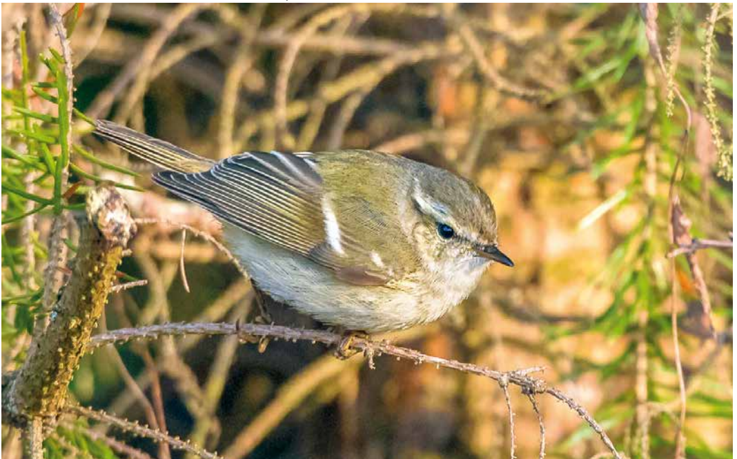
169 Humes Bladkoning / Hume's Leaf Warbler Phylloscopus humei , Sint-Oedenrode, Noord-Brabant, 2 januari 2019