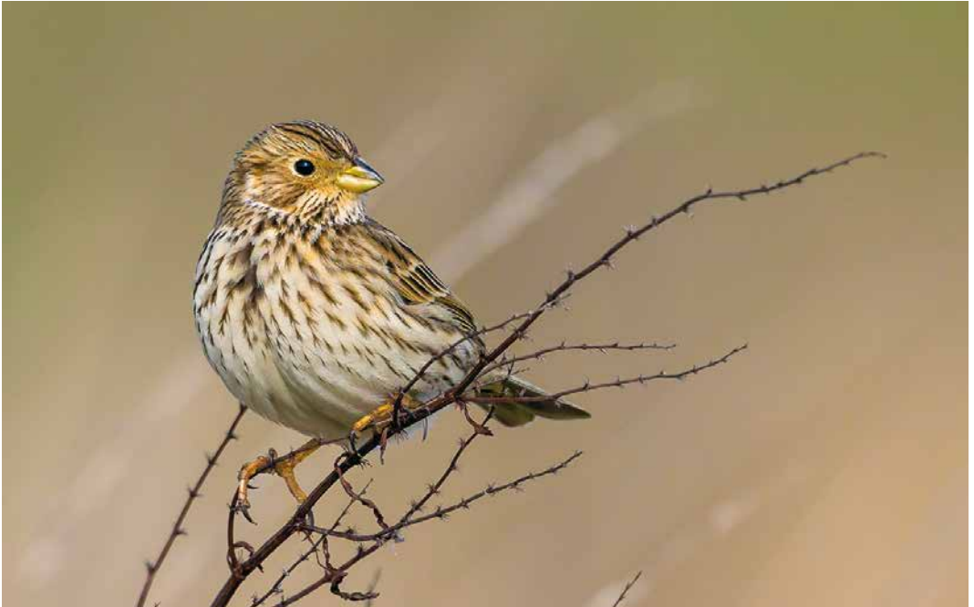
170 Grauwe Gors / Corn Bunting Emberiza calandra , Bruinisse, Zeeland, 2 maart 2019 (Paul van Tuil)