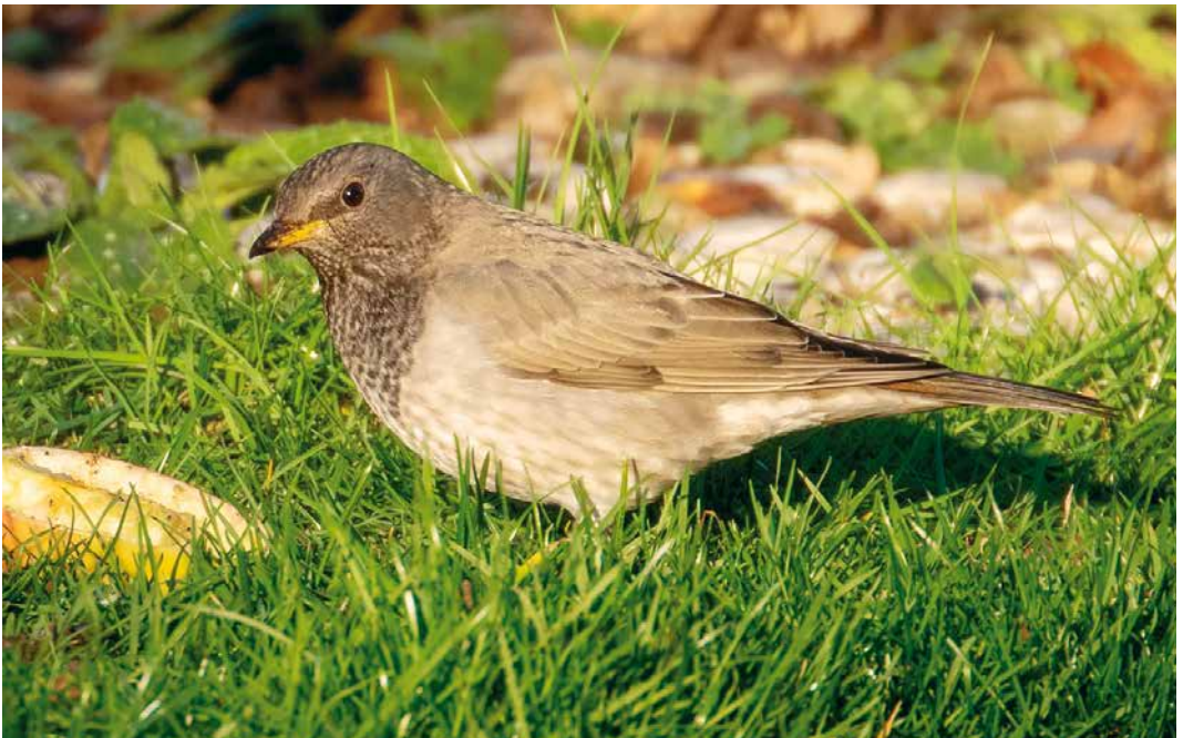
171 Zwartkeellijster / Black-throated Thrush Turdus atrogularis , mannetje, Coevorden, Drenthe, 16 februari 2019 (Hans Tetteroo)