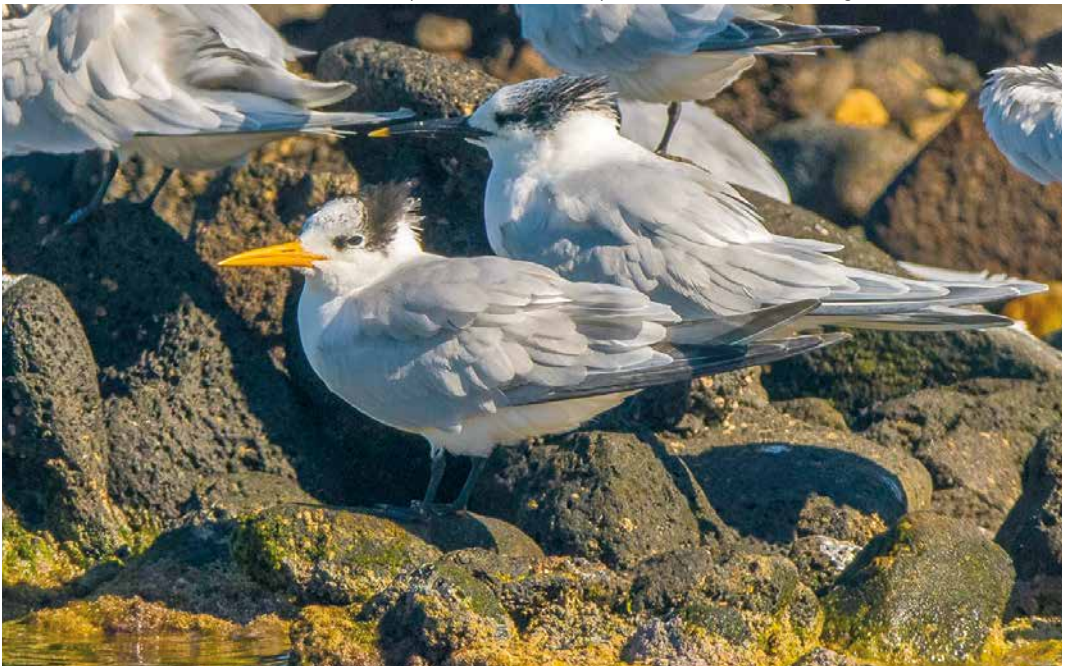
152 Lesser Crested Tern / Bengaalse Stern Sterna bengalensis , with Sandwich Terns / Grote Sterns S sandvicensis , Arrecife, Lanzarote, Canary Islands, 12 February 2019