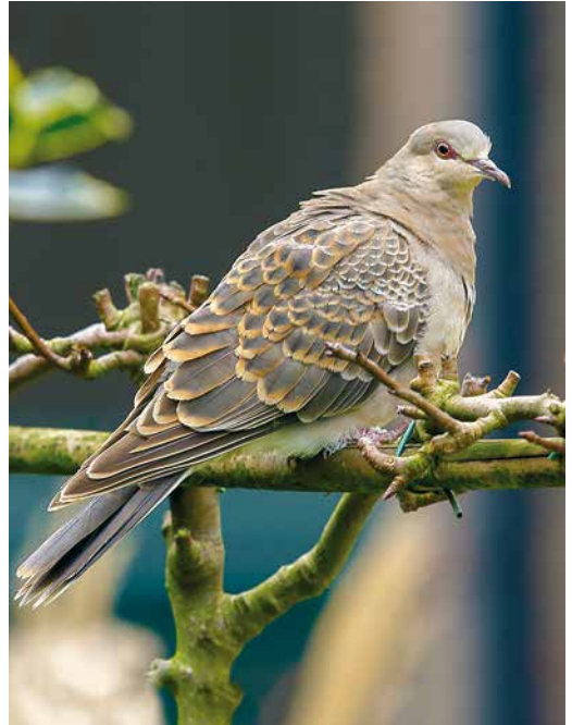
153 Upland Buzzard / Mongoolse Buizerd Buteo hemilasius , Lar, Fars, Iran, 16 November 2018 154 Rufous Turtle Dove / Meenatortel Streptopelia orientalis meena , first-winter, Limmen, Noord-Holland, Netherlands, 30 January 2019 155 Yellow-browed Warbler / Bladkoning Phylloscopus inornatus , first-winter, Berenice, Egypt, 5 January 2019 cf Dutch Birding 41: 59, 2019