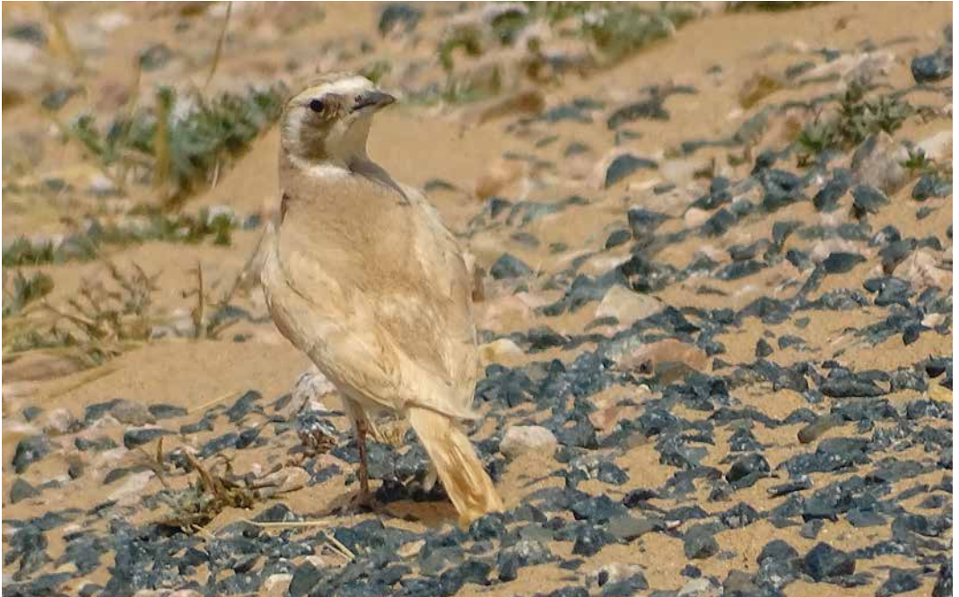
129-130 Temminck's Lark / Temmincks Strandleeuwerik Eremophila bilopha , c 100 km west of Aousserd, Western Sahara, Morocco, 30 March 2018 (Enno B Ebels). Bird with mutation 'Brown'.