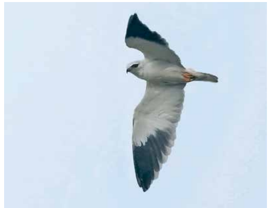
66 Wahlberg's Eagle / Wahlbergs Arend Aquila wahlbergi , adult, El Haouaria, Nabeul, Tunisia, 23 April 2018 (Mohamed El Goll) 67 Bateleur / Bateleur Terathopus ecaudatus , first-winter, Sharm El-Sheikh, Sinai, Egypt, 2 December 2018 (Volker Mauerhofer) 68 Sooty Shearwater / Grauwe Pijlstormvogel Ardenna grisea , Sempach lake, Luzern, Switzerland, 8 December 2018 (Stefan Werner) 69 Black-winged Kite / Grijze Wouw Elanus caeruleus , Kunszentmiklós, Bács-Kiskun, Hungary, 3 December 2018 (Zoltán Bajor)

dom' (the oldest-known wild bird) returned to lay an egg in her colony on Midway Atoll in the Hawaiian archipelago; ringed as an adult of at least five years old in 1956, she raised c 30 chicks until 2006 and then almost one a year since. A first-winter British Storm Petrel Hydrobates pelagicus found dead at Człopino on the Baltic coast on 9 December was the eighth for Poland. If accepted, a Cory's Shearwater Calonectris borealis (or perhaps Scopoli's Shearwater C diomedea ) photographed off Bremer Bay, Western Australia, on 19 January will be the first for Australia. A Sooty Shearwater Ardenna grisea was reported at Zeller See, Salzburg, Austria, on 2 December and possibly the same individual was discovered at Sempach lake, Luzern, Switzerland, on 8 December (second record). In the Indian Ocean, the first Great Shearwater A gravis for Amsterdam Island was photographed on 2 February 2017 (Marine Ornithol 46: 89-91, 2018).