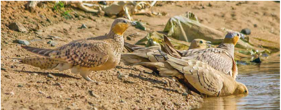
44 Chestnut-bellied Sandgrouse / Roodbuikzandhoen Pterocles exustus floweri , male, Gebel Elba, Halaib Triangle, Egypt, 25 June 2013 ( Ali Dora ) 45 Chestnut-bellied Sandgrouse / Roodbuikzandhoenders Pterocles exustus floweri , males, Gebel Elba, Halaib Triangle, Egypt, 22 August 2015 ( Ali Dora ) 46 Chestnut-bellied Sandgrouse / Roodbuikzandhoenders Pterocles exustus floweri , males, with Crowned Sandgrouse / Kroonzandhoenders P. coronatus , males, Gebel Elba, Halaib Triangle, Egypt, 8 June 2016 ( Ali Dora )

Cinnyris habessinicus (Goodman & Meininger 1989, Meininger & Goodman 1996, Baha El Din 2002, Moldovan 2012). It is also a hotspot for vagrants (mainly Afrotropical species), and many have been recorded here, eg, Pied Crow Corvus albus , Black Scrub Robin Cercotrichas podobe and Red-tailed Wheatear Oenanthe chrysopygia (Baha El Din & Baha El Din 2001, Jiguet et al 2014, 2018; see below). If accepted, a Broad-billed Roller Eurystomus glaucurus found dead at Adal Deeb on 30 October 2010 will be the first record of this species for Egypt and the third for the WP (Haas 2017). Very few foreign birdwatchers have been able to visit Gebel Elba because access to this area is still restricted for foreign visitors (Meininger & Goodman 1996, Baha El Din 2002, Moldovan 2012). As