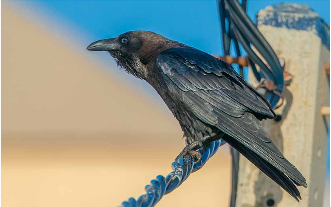
85 Brown-necked Raven / Bruinnekraaf Corvus ruficollis , adult, Cabo de Palos, Cartagena, Murcia, Spain, 3 January 2019

recorded at Leziria Grande, Vila Franca de Xira, Portugal, from 2 December to late January (one or two previous records). If accepted, an East Siberian Wagtail M. ocularis reported at Al Beed farm on 18 November will be the first for Oman. The first for Sweden was photographed at Sandhamn, Gotland, on 24 November. Previous WP records were in the UAE in November 2017 and in Cyprus in March-April 2018 (cf Dutch Birding 40: 174-177, 196, 2018). (Only) the fifth Citrine Wagtail M. citreola for Australia was seen at Whyalla on 27 December. If accepted, a Richard's Pipit Anthus richardi at Necunoscut, Constanța, from 20 December will be (only) the second for Romania. As many as c 41 were found in France in December. The third Blyth's Pipit A. godlewskii for Denmark stayed at Skagen on 16-28 November. The eighth Olive-backed Pipit A. hodgsoni for Morocco was reported at Rabat on 3 December. An adult Red-throated Pipit A. cervinus photographed at Sierra Los Cuchumatanes, near La Capellanía, on 15 April 2018 was the first for Guatemala and Central America (Bull Br Ornithol Club 138: 383-385, 2018). A Siberian Buff-bellied Pipit A. rubescens japonicus at Clos de Gouine, Arles, from 22 December onwards was the first for France.