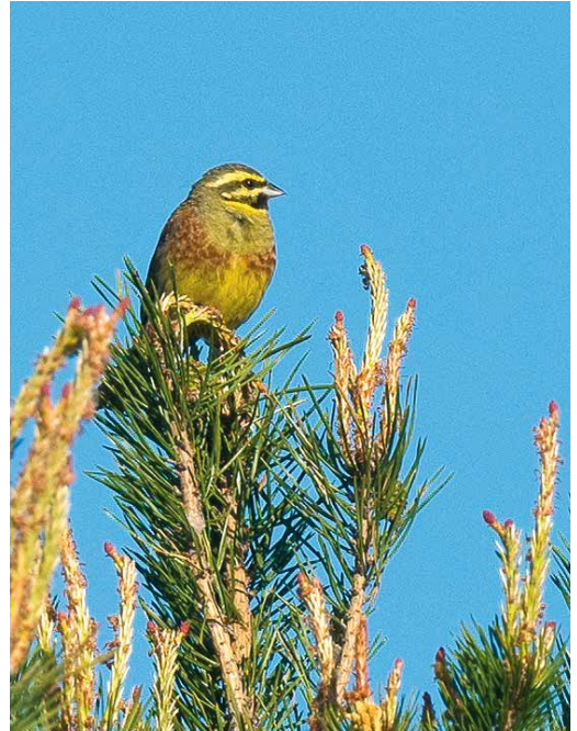
18 Ross' Meeuw / Ross's Gull Rhodostethia rosea , eerste-winter, Vlissingen, Zeeland, 25 januari 2018 (Edwin Winkel) 19 Cirlgors / Cirl Bunting Emberiza cirlus , mannetje, Weerter- en Budelerbergen, Noord-Brabant, 6 mei 2018 (Paul S Ruiters) 20 Witkeelkwikstaart / White-throated Wagtail Motacilla cinereocapilla , mannetje, Onnerpolder, Haren, Groningen, 13 mei 2018 (Thijs Glastra)