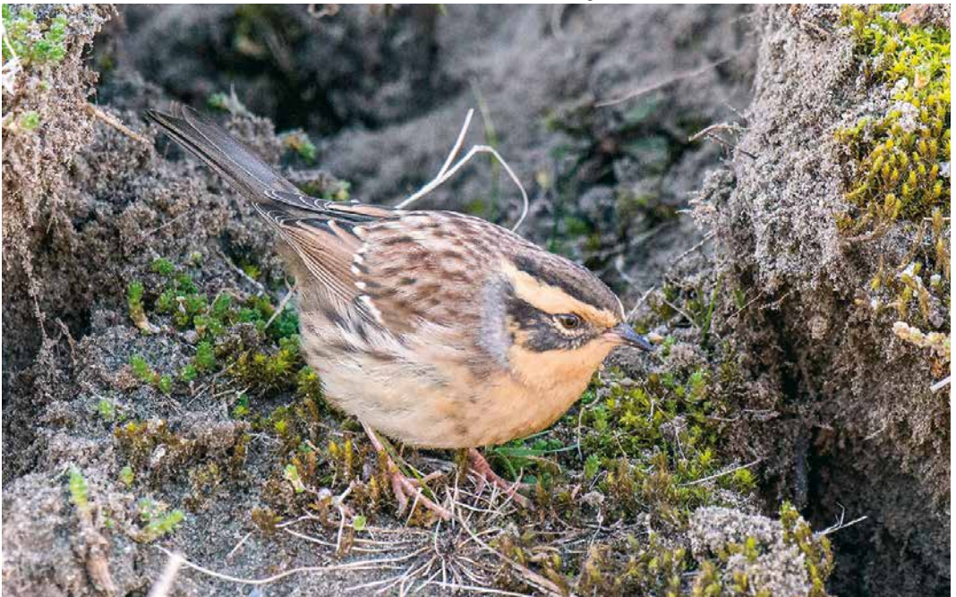
15 Bergheggenmus / Siberian Accentor Prunella montanella , eerstejaars, Maasvlakte, Zuid-Holland, 21 oktober 2016