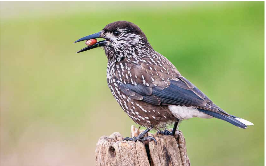
92 Dunsnavelnotenkraaker / Siberian Spotted Nutcracker Nucifraga caryocatactes macrorhynchos , eerste-winter, Wageningen, Gelderland, 27 november 2018