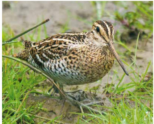
5 Amerikaanse Oeverloper / Spotted Sandpiper Actitis macularius , Medemblik, Noord-Holland, 17 april 2015 (Co van der Wardt) 6 Grijsje Junco / Dark-eyed Junco Junco hyemalis , tweede-kalenderjaar vrouwtje, Beijum, Groningen, Groningen, 19 februari 2015 (Arnoud B van den Berg) 7 Woestijngasmus / Asian Desert Warbler Sylvia nana , Terschelling, Friesland, 14 november 2015 (Jaap Denee) 8 Poelsnip / Great Snipe Gallinago media , Broekhuizen, Limburg, 28 april 2015 (Arnoud B van den Berg)

uit te gaan. Wel trok na acht jaar zonder Siberische Strandloper C acuminata de door Pierre van der Wielen ontdekte vogel in de Putten van Camperduin, Noord-Holland, tussen 6 en 19 september veel aandacht (achtste geval van in totaal negen vogels) en was een Ruigpootuil Aegolius funereus die zich tegen een Amsterdams schoolraam doodvloog op 12 oktober opmerkelijk als 's lands meest westelijke ooit. Curieus was dat een Vorkstaartplevier G pratincola op 18-23 oktober juist Terneuzen, Zeeland, uitkoos omdat de vorige twee gevallen in het late najaar uit precies dezelfde gemeente stamden. Een Mongoolse Pieper A godlewskii , de eerste twitchbare sinds 2007, liet zich op 31 oktober en 1 november bij tijd en wijle goed zien bij Ridderkerk, Zuid-Holland. De vogel was op de