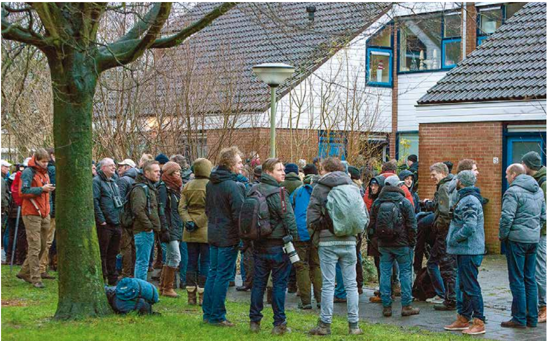
11 Vogelaars op hun beurt wachtend bij Roodkeelnachtegaal / birders waiting for their turn at Siberian Rubythroat Calliope calliope , Hoogwoud, Noord-Holland, 16 januari 2016

onbeduidende Facebookgroepen afstruint. Hanneke de Boer vroeg zich op 15 januari af welke vogel haar zoon al een week in zijn tuin in Hoogwoud, Noord-Holland, had... Nou, een Roodkeelnachtegaal! Met dank aan de oplettendheid van Wietze, het CSI-werk van Jaap Denee en doortastend optreden van Remco Hofland werd dit een van de opmerkelijkste twitches uit de geschiedenis van de DBA. Voor vijf euro per persoon – een idee van Remco om de aanvankelijk niet zo enthousiaste zoon over te halen – kon iedereen om beurten (kort) naar de vogel kijken, waarna de meesten weer achteraan de rij aansloten voor de volgende sessie. Buiten werden door andere buurtbewoners op meerdere plekken koffie en koeken verkocht en ook burens begonnen hun huis tegen betaling aan te bieden. Na verloop van tijd liet de vogel zich tot 12 april ook steeds vaker buiten de tuin zien. Op waarneming.nl werd de vogel liefst 2000 keer ingevoerd. Dat de vogel geboren en getogen was op de taiga, bleek uit de grote hoeveelheid imitaties van Noord-Aziatische soorten die hij aan het einde van zijn verblijf in zijn zang liet horen. Toen dat bekend werd, reisden zelfs vogelaars uit verre buitenland naar Hoogwoud af om de soort bij te schrijven.