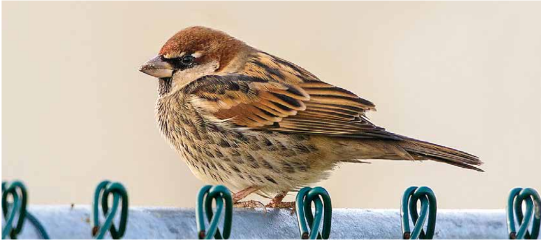
106 Spaanse Mus / Spanish Sparrow Passer hispaniolensis , mannetje, Maasvlakte, Zuid-Holland, 3 november 2018

teld. In totaal 151 Ijsgorzen Calcarius lapponicus werden vanaf de telposten gemeld. Ook uit het binnenland kwamen aardig wat waarnemingen. Maar de kust leverde toch weer het hoogste aantal: maximaal 15 waren gedurende langere tijd aanwezig op de Kwade Hoek bij Goedereede, Zuid-Holland. Op verschillende zogenaamde wintervoedselveldjes in Groningen doken Grauwe Gorzen Emberiza calandra op. In totaal ging het om maar liefst c 95 exemplaren. Op de meer traditionele plaatsen zoals Zeeuws-Vlaanderen en de hamsterreservaten in Zuid-Limburg was de soort ook weer present; bij Puth, Limburg, werden er op 28 december bijvoorbeeld 36 gemeld. Leuk was verder de waarneming van een trekker op 3 november in Noord-Holland langs achter-