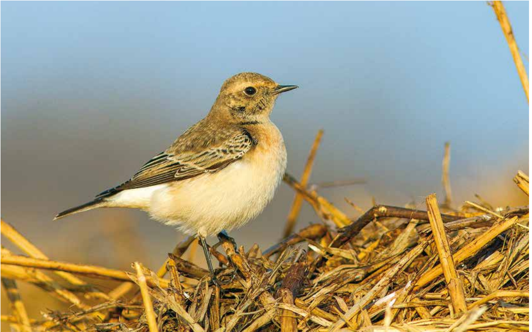
93 Bonte Tapuit / Pied Wheatear Oenanthe pleschanka , eerste-winter mannetje, Schiermonnikoog, Friesland, 4 november 2018

Braamsluiers S althaea blythi werden gezien op 17 en 18 november bij Netterden, Gelderland, en op ten minste 1 en 26 december in Spijkenisse, Zuid-Holland.