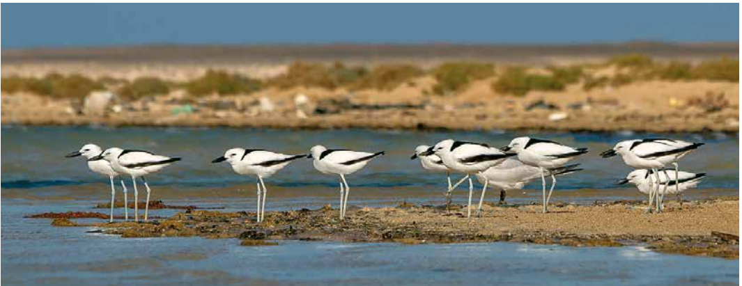
51 Pied Crow / Schildraaf Corvus albus , Red Sea coast, Gebel Elba, Halaib Triangle, Egypt, 2 April 2015 ( Ali Dora ) 52 Black Scrub Robin / Zwarte Waaiersaart Cercotrichas podobe , Wadi Shallal, Gebel Elba, Halaib Triangle, Egypt, 8 March 2016 ( Ali Dora ) 53 Crested Honey Buzzard / Aziatische Wespensdief Pernis ptilorhynchus , adult male, Wadi Shallal, Gebel Elba, Halaib Triangle, Egypt, 10 May 2016 ( Ali Dora ) 54 Lappet-faced Vulture / Oorgier Torgos tracheliotos , Gebel Elba, Halaib Triangle, Egypt, 29 April 2017 ( Ali Dora ) 55 Crab-plovers / Krabplevieren Dromas ardeola , Red Sea coast, Gebel Elba, Halaib Triangle, Egypt, 11 April 2018 ( Ali Dora )