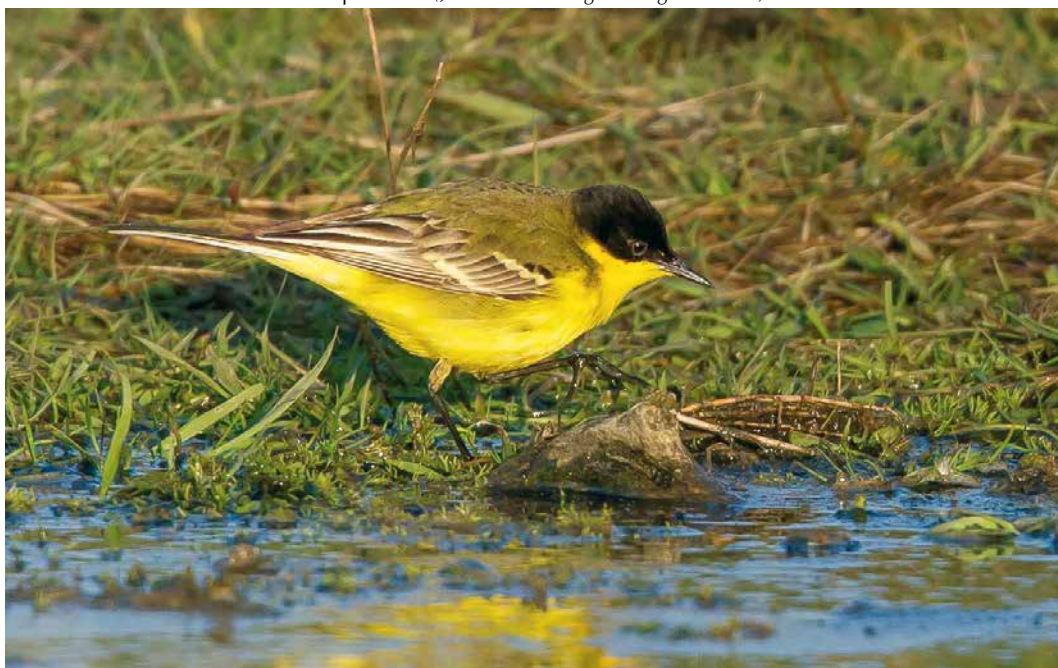
13 Balkankwikstaart / Black-headed Wagtail Motacilla feldegg , mannetje, De Nederlanden, Texel, Noord-Holland, 30 april 2016