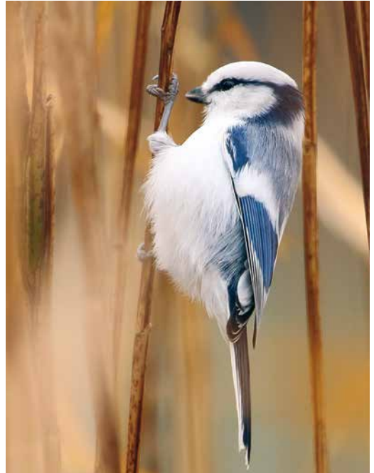
82 Dwarf Bittern / Afrikaanse Woudaap Ixobrychus sturmii , Barranco del Rio Cabras, Fuerteventura, Canary Islands, 3 January 2019 ( Peter Alfrey ) 83 Azure Tit / Azuurmees Cyanistes cyanus , Fehér lake, Szeged, Hungary, 19 November 2018 ( Csaba Barkóczy ) 84 Cretzschmar's Bunting / Bruinkeelortolaan Emberiza caesia , first-winter male, Skutskär, Uppsala, Sweden, 6 January 2019 ( Tomas Lundquist )