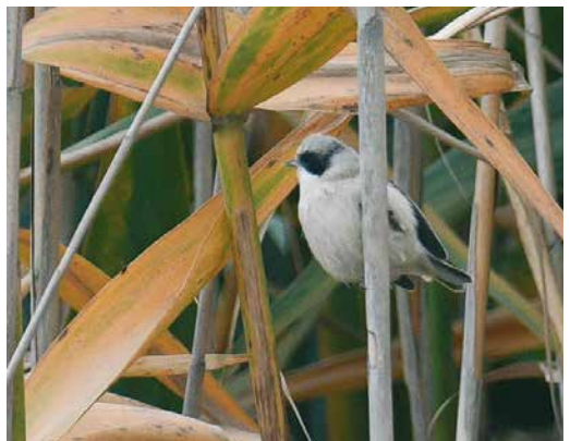
70 Dusky Thrush / Bruine Lijster Turdus eunomus , first-winter male, Whalsay, Shetland, Scotland, 5 December 2018 71 Naumann's Thrush / Naumanns Lijster Turdus naumanni , first-winter female, Patamalm, Mönsterås, Småland, Sweden, 13 November 2018 cf Dutch Birding 40: 419, 2018 72 Siberian Buff-bellied Pipit / Siberische Waterpieper Anthus rubescens japonicus , Clos de Gouine, Arles, France, 22 December 2018 73 East Siberian Wagtail / Oost-Siberische Kwikstaart Motacilla ocularis , first-winter, Sandhamn, Gotland, Sweden, 24 November 2018 74 Pied Crow / Schilddraaf Corvus albus , adult, between Ad Duqm and Haima, Al Wusta, Oman, 21 November 2018 75 White-crowned Penduline Tit / Witkruinbuidelmees Remiz coronatus , male, Alagol lake, Golestan, Iran, 2 December 2018