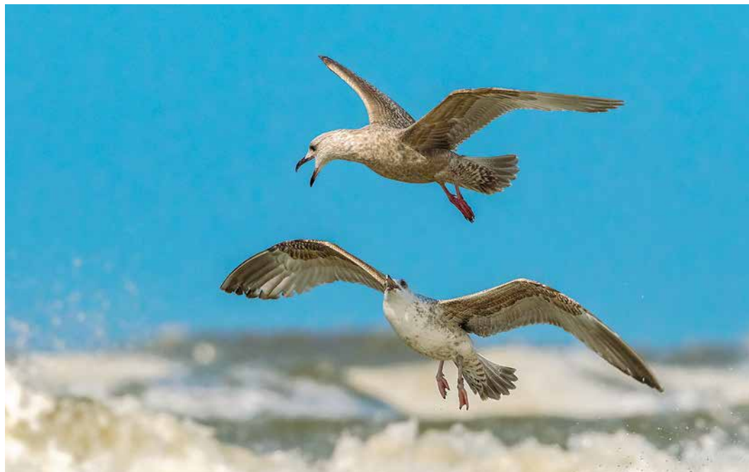
9 Thayers Meeuw / Thayer's Gull Larus thayeri , juveniel, met Zilvermeeuw / European Herring Gull L. argentatus , Egmond aan Zee, Noord-Holland, 12 april 2015