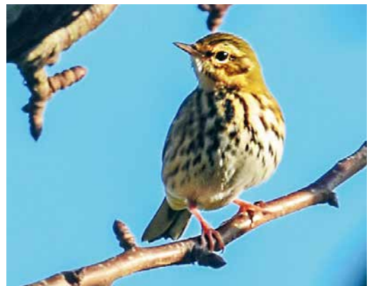
100 Pallas' Boszanger / Pallas's Leaf Warbler Phylloscopus proregulus , Hondsbossche Zeewering, Noord-Holland, 5 november 2018 (Ruud E Brouwer) 101 Bruine Boszanger / Dusky Warbler Phylloscopus fuscatus , Amsterdam-Buitenveldert, Noord-Holland, 24 december 2018 (Edial Dekker) 102 Humes Bladkoning / Hume's Leaf Warbler Phylloscopus humei , Sint-Oedenrode, Noord-Brabant, 21 november 2018 (Ludo Van Dorst) 103 Witsluitbarmsijs / Coues's Redpoll Acanthis hornemanni exilipes , adult mannetje, Meijndel, Wassenaar, Zuid-Holland, 9 november 2018 (Vincent van der Spek) 104 Mogelijke Oostelijke Gele Kwikstaart / possible Eastern Yellow Wagtail Motacilla tschutschensis , eerste-winter, Rhooon, Zuid-Holland, 2 december 2018 (Rob Half) 105 Siberische Boompieper / Olive-backed Pipit Anthus hodgsoni , Noordwijk, Zuid-Holland, 8 november 2018 (Casper Zuyderduyn)