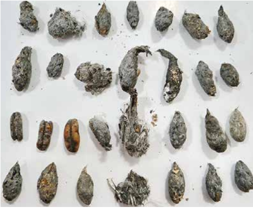
37 Pellets of Sooty Falcon / Woestijnvalk Falco concolor , Wadi el Gemal island, Egypt, 29 November 2017. Note date palm seeds.

Seven pellets found at 'nest 1' on Wadi El Gemal in October 2017 ranged in size between 20 mm and 27 mm in length and between 11 mm and 12.5 mm in width. The 24 pellets found at 'nest 2' on the same island in October 2017 ranged in size between 17 mm and 31 mm in length and between 8.5 mm and 12 mm in width. Pellets of nest 1 only contained passerine remains (bone and feather fragments), while those of nest 2 also some insect material (12.5%), besides passerine remains (87.5%). For an extensive list of prey items in the Arabian peninsula, see Jennings (2010).