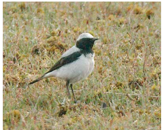
17 Seebohms Tapuit / Seebohm's Wheatear Oenanthe seebohmi , eerste-zomer mannetje, Solleveld, Den Haag, Zuid-Holland, 22 mei 2017 (Tom Visbeek)

26 april was ook 2017 geen uitzondering. Twitchers hadden veel moeite met deze vogel omdat hij op 26 april vertrok net voor de aankomst van de meute. Wonder boven wonder werd hij echter herontdekt halverwege het eiland, c 7 km van de oorspronkelijke locatie, waar hij tot het einde van de dag bleef. De derde Grijze Junco op 7-8 mei in