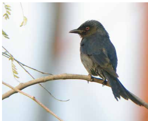
22-23 Ashy Drongo / Griize Drongo Dicrurus leucophaeus , Minab, Hormozgan, Iran, 19 February 2014 ( Leander Khil ). First for Iran. 24 Ashy Drongo / Griize Drongo Dicrurus leucophaeus , Dargas, Raask, Sistan and Baluchestan, Iran, 26 January 2017 ( Ehsan Talebi ). Third for Iran. 25 Ashy Drongo / Griize Drongo Dicrurus leucophaeus , Abu Dhabi, United Arab Emirates, 17 December 2006 ( Nick Moran ). First for UAE and 'greater' WP.

eastern vagrants, eg, two Olive-backed Pipits Anthus hodgsoni (the third record for Iran). On 19 January, they were birding in Jahad park (27.26071°N, 56.41677°E), 16 km east of Bandar Abbas, when Mattias spotted a drongo. Magnus and Per Øystein were involved in the discovery of the first Ashy Drongo for Oman (Klunderud et al 2016; plate 28) so identification was straightforward (plate 27). The bird was still around in the same trees when Magnus and Mattias again visited Jahad Park on 26 January. The record was accepted as the second for Iran (Khaleghizadeh et al 2017).