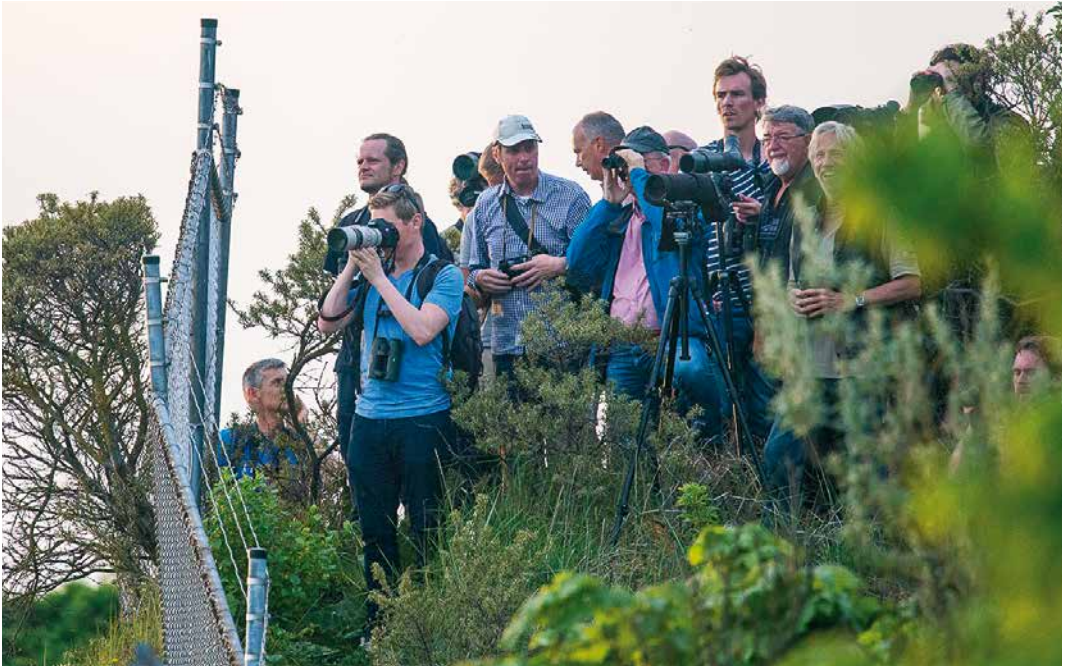
16 Vogelaars bij Seebohms Tapuit / birders at Seebohm's Wheatear Oenanthe seebohmi , Solleveld, Den Haag, Zuid-Holland, 22 mei 2017

plaar worden veiliggesteld voor museum Naturalis te Leiden, Zuid-Holland.