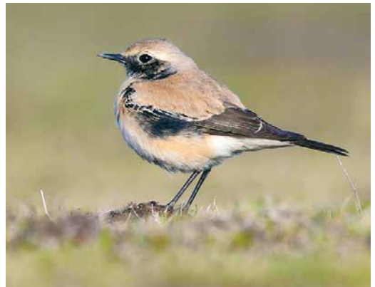
76 Long-tailed Rosefinch / Langstaartroodmus Carpodacus sibiricus , first-winter male, Besh Barmag, Azerbaijan, 22 November 2018 77 Long-tailed Shrike / Langstaartklauwier Lanius schach , first-winter, Grandson, Vaud, Switzerland, 24 November 2018 78 Pied Bush Chat / Zwarte Roodborstapuit Saxicola caprata , male, Ulricehamn, Västergötland, Sweden, 8 November 2018 cf Dutch Birding 40: 419, 2018 79 Basalt Wheatear / Basalttapuit Oenanthe lugens warriae , Ovda valley, Israel, 21 December 2018 80 Asian Desert Warbler / Woestijngrasmus Sylvia nana , Torre Canne, Puglia, Italy, 21 November 2018 81 Desert Wheatear / Woestijntapuit Oenanthe deserti , first-winter male, Chişineu-Criş, Arad, Romania, 11 December 2018