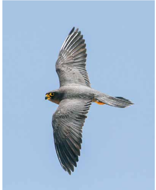
30 Sooty Falcons / Woestijnvalken Falco concolor , adult male (left) and adult female (right), Shawareet, Egypt, 1 August 2016 ( Mohamed I Habib ). Sexes differ slightly in size (females c 5% larger than males) and plumage (males having paler blue to lead-grey upperparts). 31 Sooty Falcon / Woestijnvalk Falco concolor , adult female, Shawareet, Egypt, 30 July 2016 ( Mohamed I Habib ). Tail wedge-shaped due to slightly longer central feathers. Relatively dark blue upperparts. Also note yellow cere and other bare parts. 32 Sooty Falcons / Woestijnvalken Falco concolor , adult male (right) and adult female (left), Shawareet, Egypt, 30 July 2016 ( Mohamed I Habib ). Note differences in bare part coloration, with male having more yellow-orange cere and other bare parts than female.