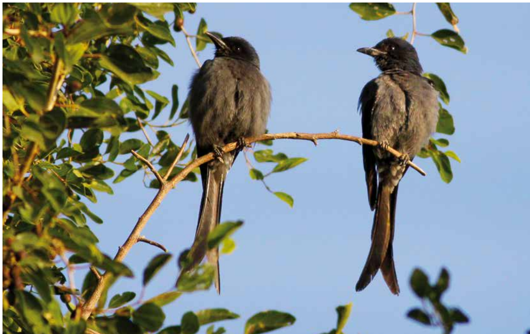
26 Ashy Drongos / Grijze Drongo's Dicrurus leucophaeus , Jahra farms, Kuwait, 10 December 2010 ( Mike Pope ). One of two records of two individuals together in the WP. 27 Ashy Drongo / Grijze Drongo Dicrurus leucophaeus , Jahad park, Bandar Abbas, Hormozgan, Iran, 19 January 2016 ( Magnus Ullman ). Second for Iran. 28 Ashy Drongo / Grijze Drongo Dicrurus leucophaeus , Qatbit, Oman, 24 November 2014 ( Magnus Ullman ). First for Oman.