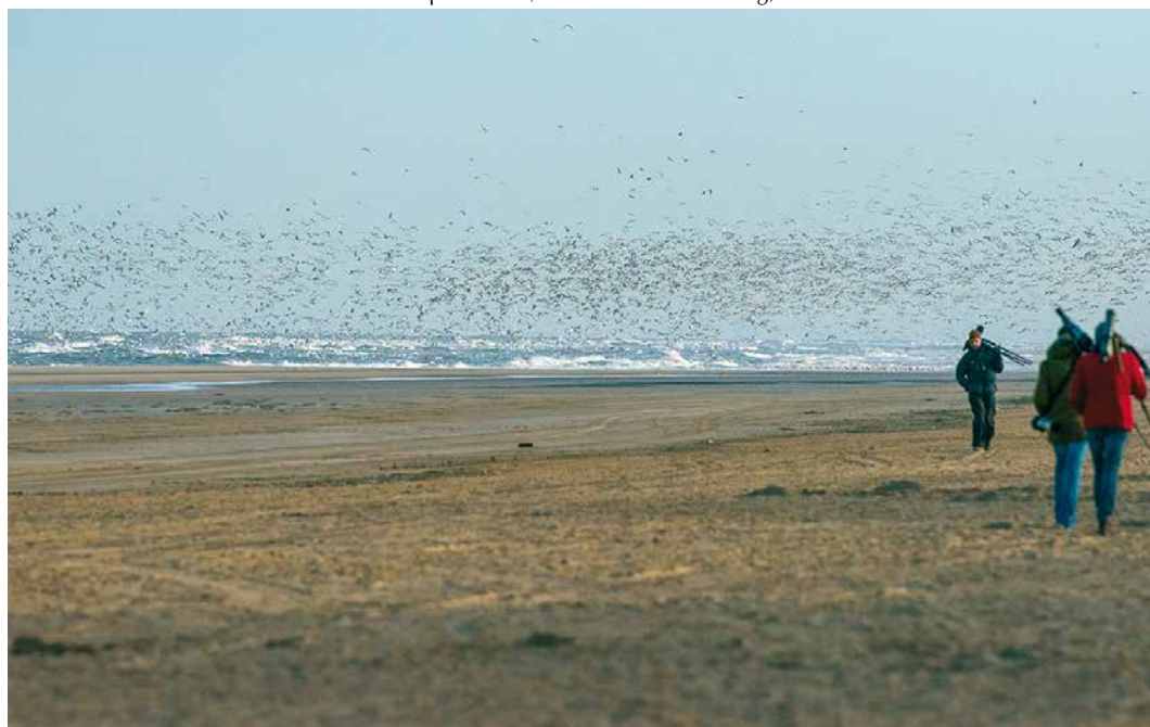
10 Vogelaars bij Thayers Meeuw / birders at Thayer's Gull Larus thayeri , Egmond aan Zee, Noord-Holland, 12 april 2015 (Arnoud B van den Berg)