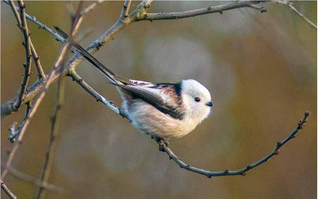
91 Witkopstaartmees / White-headed Long-tailed Tit Aegithalos caudatus caudatus , Bunnik, Utrecht, 18 november 2018 ( Julian Bosch )