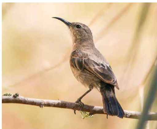
47 Rosy-patched Bushshrike / Roodbuikklaauwier Rhodophoneus cruentus , female, Gebel Elba, Halaib Triangle, Egypt, 23 December 2017 ( Ali Dora ) 48 Goliath Heron / Reuzenreiger Ardea goliath , adult, Red Sea coast, Gebel Elba, Halaib Triangle, Egypt, 25 February 2018 ( Ali Dora ) 49 Shining Sunbird / Glanshoningzuiger Cinnyris habessinicus , male, Gebel Elba, Halaib Triangle, Egypt, 8 September 2016 ( Ali Dora ) 50 Shining Sunbird / Glanshoningzuiger Cinnyris habessinicus , female, Gebel Elba, Halaib Triangle, Egypt, 15 May 2016 ( Ali Dora )

ber 2014, a flock of c 50 Chestnut-bellied was recorded flying 1 km north of the 2013 site. I found probably the same flock again on 14 October 2014 near the water treatment station at 22°10'37.2"N, 36°40'8.4"E. In 2015, I observed c 50 individuals on 6 April at the same site as in 2013 (in a big flock of Spotted and Crowned), and again here, I photographed two males on 22 August (plate 45). Other sightings of the species were on 8 June 2016 (32 individuals; plate 46) and on 19 February 2017 (22 individuals), both at the 2013 site. All these sightings have been accepted by the Egyptian Ornithological Rarities Committee (EORC). On 24 July 2018, near the water treatment station (the 2014 site), I again photographed 19 Chestnut-bellied including seven males, six females and six juveniles