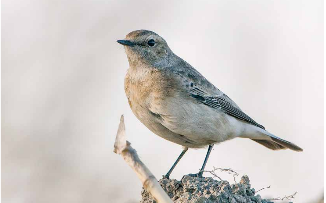
94 Bonte Tapuit / Pied Wheatear Oenanthe pleschanka , eerste-winter vrouwtje, Eemshaven-West, Groningen, 7 november 2018 (Co van der Wardt) 95 Grijswangdwerglijster / Grey-cheeked Thrush Catharus minimus , eerste-winter (gevonden te Monster, Zuid-Holland, op 5 november 2018), Den Haag, Zuid-Holland, 15 november 2018 (Vincent van der Spek/Vogelopvang De Wulp)