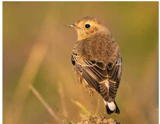
96 Kleine Trap / Little Bustard Tetrax tetrax , Haamstede, Schouwen-Duiveland, Zeeland, 4 december 2018 ( Niels Godijn ) 97 Woestijntapuit / Desert Wheatear Oenanthe deserti , eerste-winter mannetje, Ellemeet, Zeeland, 14 november 2018 ( Jean-François Depuydt ) 98 Roze Spreeuw / Rosy Starling Pastor roseus , eerstejaars, Dokkum, Friesland, 29 november 2018 ( Willem Hartholt ) 99 Bonte Tapuit / Pied Wheatear Oenanthe pleschanka , eerste-winter vrouwtje, Bodegraven, Zuid-Holland, 14 december 2018 ( Johannes Luiten )

genomen, waaronder 16 op de telposten (met zes langs Kustweg Lauwersmeer). Het vermelden waard zijn verder een exemplaar op 1 en 2 december bij Heteren, Gelderland, en een groepje van maximaal drie van 14 november tot 15 december op het Paulinaschor bij Terneuzen. Een Mongoolse Pieper A godlewskii op 27 december bij Huisduinen, Noord-Holland, liet zich helaas niet vastleggen op foto of geluidsopname... Begin november werden in totaal negen Siberische Boompiepers A hodgsoni opgemerkt op de telposten. De enige ter plaatse werd op 8 november gefotografeerd bij Noordwijk aan Zee, Zuid-Holland.