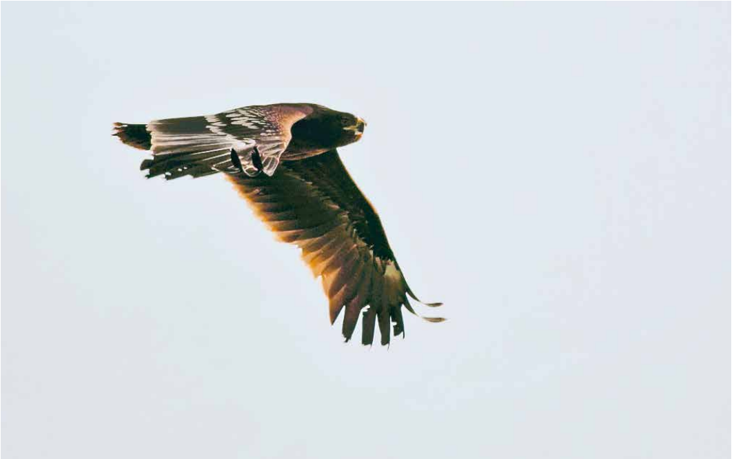
21 Bastaardarend / Greater Spotted Eagle Clanga clanga , eerste-winter, Polsbroekerdam, Utrecht, 18 februari 2018 (Kees de Leeuw)

langsvliegende Kuhls Pijlstormvogel C borealis langs drie trektelposten in Zuid-Holland had men natuurlijk direct in de auto moeten springen richting Westkapelle, waar de vogel inderdaad zeer fraai en op zijn dooie akkertje langs kwam vliegen; hij kon daarna nog tot ver langs de Vlaamse kust worden opgepikt. Voor de 'next generation' was de negende Roodoogvireo Vireo olivaceus zeer welkom want het was slechts de derde twitchbare: te zien op Texel op 27-30 oktober. Na een Geelkop-troepiaal Xanthocephalus xanthocephalus uit een ver en grijs verleden was dit pas de tweede Amerikaanse zangvogel voor het eiland. Het was extra leuk dat hij werd ontdekt door Arend Wassink die 40 jaar geleden aan de wieg stond van de DBA. Een juveniele Bairds Strandloper C bairdii te Deventer, Overijssel, op 2-3 november was de eerste waarneming in deze maand voor deze soort en zelfs een van de weinige zo laat in het jaar voor het noordelijke halfrond. De beste soort van het jaar kwam ons pas op 20 november ter ore, toen bekend werd gemaakt dat op 5 november een sterk vermagerde Grijswangdwerglijster Catharus minimus in de duinen van Monster, Zuid-Holland, was gevonden en naar een nabijgelegen vogelasiel gebracht. Daar kon hij worden opgelapt, waarna hij in de ochtend van 20 november werd losgela-