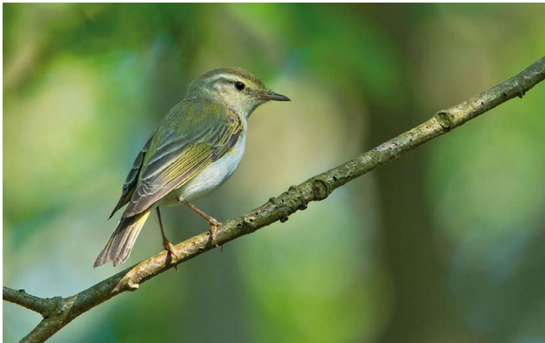
366 Hybride Bergfluitier x Fluitier / hybrid Western Bonelli's x Wood Warbler Phylloscopus bonelli x sibilatrix , Noordhollands Duinreservaat, Noord-Holland, 15 mei 2018 (Leo J R Boon)