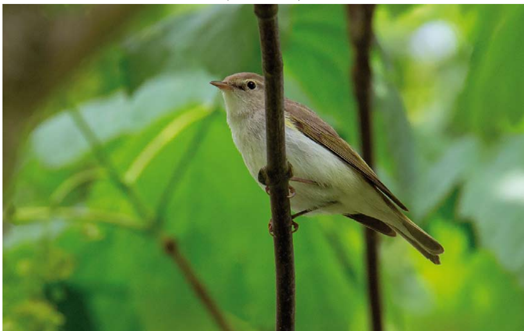
367 Bergfluitier / Western Bonelli's Warbler Phylloscopus bonelli , Schiermonnikoog, Friesland, 13 mei 2018