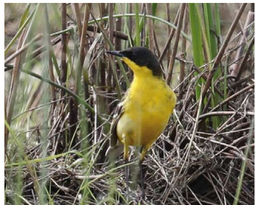
378 Roze Spreeuw / Rose-coloured Starling Pastor roseus , adult zomerkleed, Robbenjager, Texel, Noord-Holland, 3 juni 2018 379 Cirlgors / Cirl Bunting Emberiza cirlus , mannetje, Weeter- en Budelerbergen, Noord-Brabant/Limburg, 27 april 2018 380 Balkanbergfluitier / Eastern Bonelli's Warbler Phylloscopus orientalis , Noordhollands Duinreservaat, Noord-Holland, 14 mei 2018 381 Roodstuitzwaluw / Red-rumped Swallow Cecropis daurica , Gagelpolder, Utrecht, 2 mei 2018 382 Roodsterblauwborst / Red-spotted Bluethroat Luscinia svecica svecica , tweedekalenderjaar mannetje, Gemaal Leemans, Den Oever, Noord-Holland, 10 mei 2018 383 Balkankwikstaart / Black-headed Wagtail Motacilla feldegg , mannetje, Lentevreugd, Wassenaar, Zuid-Holland, 11 mei 2018