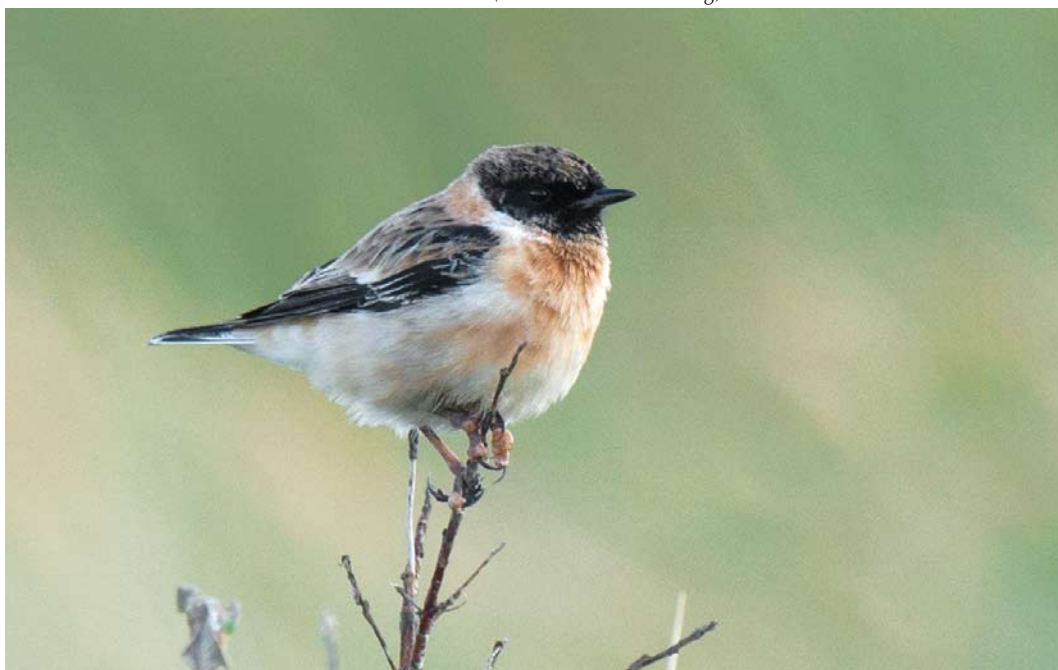
308 Kaspische Roodborsttapuit / Caspian Stonechat Saxicola maurus hemprichii , mannetje, Vlieland, Friesland, 6 oktober 2012 (Arnoud B van den Berg)