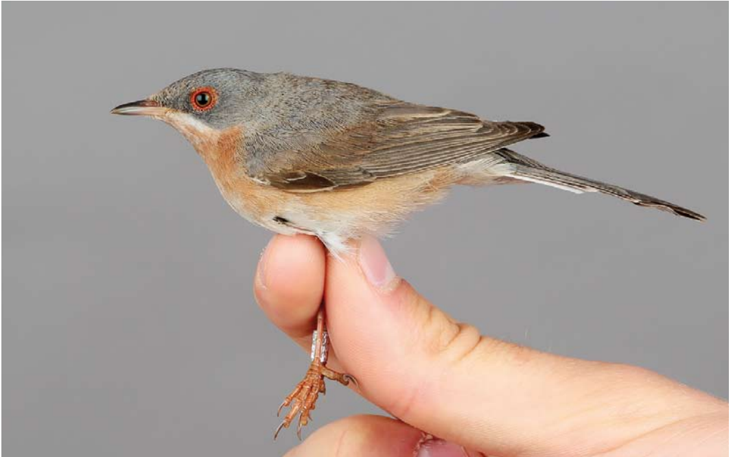
341 Moltoni's Warbler / Moltoni's Beardgrasmus Sylvia subalpina , male, Ottenby, Öland, Sweden, 26 May 2018