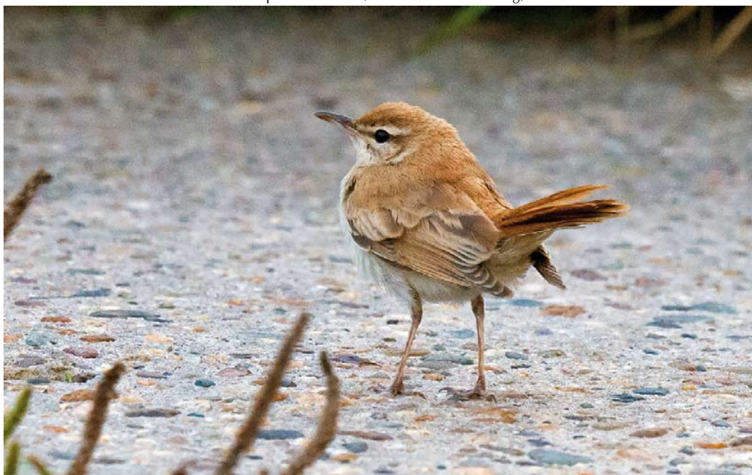
314 Rosse Waaiersstaart / Rufous-tailed Scrub Robin Cercotrichas galactotes , Petten, Noord-Holland, 27 september 2013 (Arnoud B van den Berg)