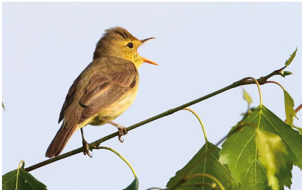
339 Melodious Warbler / Orpheusspotvogel Hippolais polyglotta , Sady, Łódzkie, Poland, 9 June 2018 (Radosław Gwóźdź)