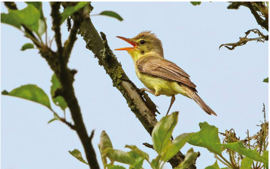
373 Orpheusspotvogel / Melodious Warbler Hippolais polyglotta , Spaarndam, Noord-Holland, 1 juni 2018