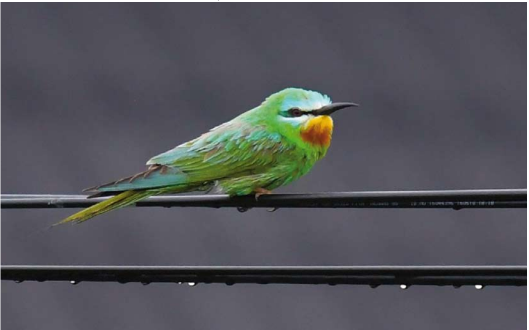
338 Blue-cheeked Bee-eater / Groene Bijeneter Merops persicus , Bulandet, Sogn og Fjordane, Norway, 14 July 2018