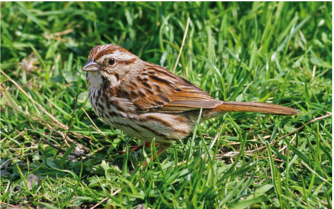
350 Song Sparrow / Zangors Melospiza melodia , adult, Fair Isle, Shetland, Scotland, 15 May 2018 cf Dutch Birding 40: 198, 2018