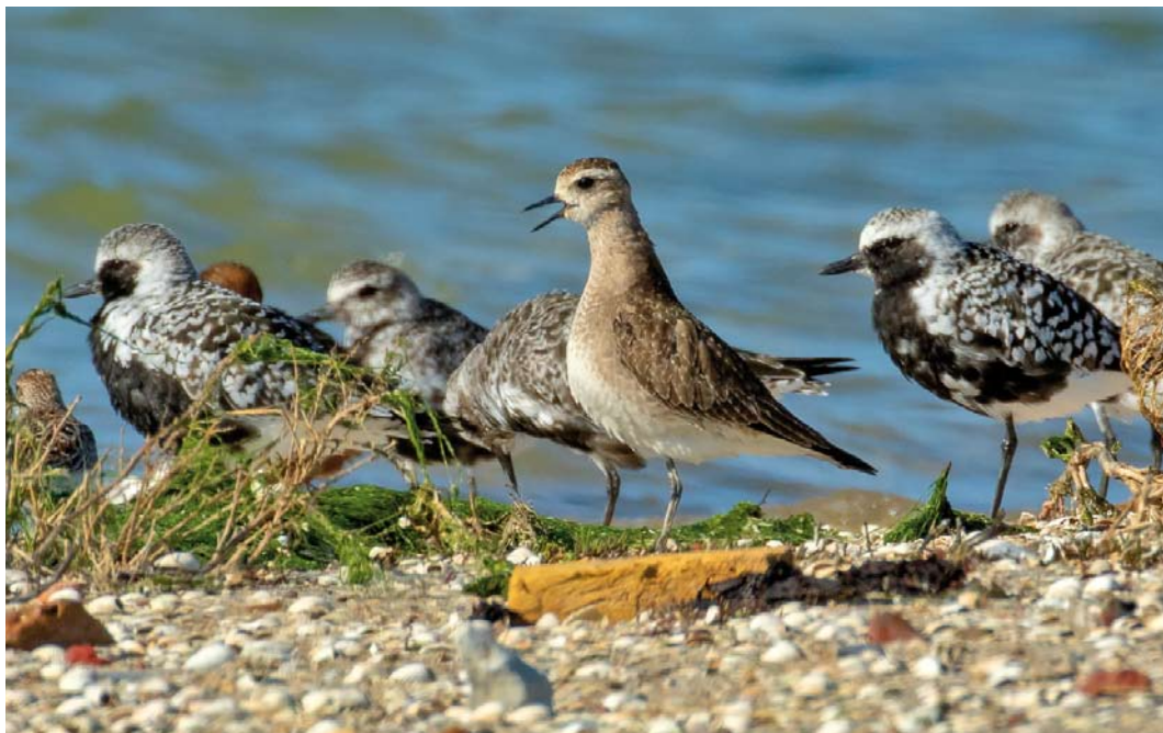
353 Amerikaanse Goudplevier / American Golden Plover Pluvialis dominica , met Zilverplevieren / Grey Plovers P. squatarola , Wilhelminadorp, Zeeland, 1 mei 2018