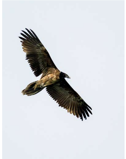
359 Bastaardarend / Greater Spotted Eagle Aquila clanga , tweede- of derde-kalenderjaar, Robbenoordbos, Noord-Holland, 8 mei 2018 ( Renate Visscher ) 360 Lammergier / Bearded Vulture Gypaetus barbatus , derde-kalenderjaar, Dishoek, Zeeland, 27 mei 2018 ( Corstiaan Beeke ) 361 Bastaardarend / Greater Spotted Eagle Aquila clanga , vierde-kalenderjaar, Texel, Noord-Holland, 26 mei 2018 ( Diederik Kok )