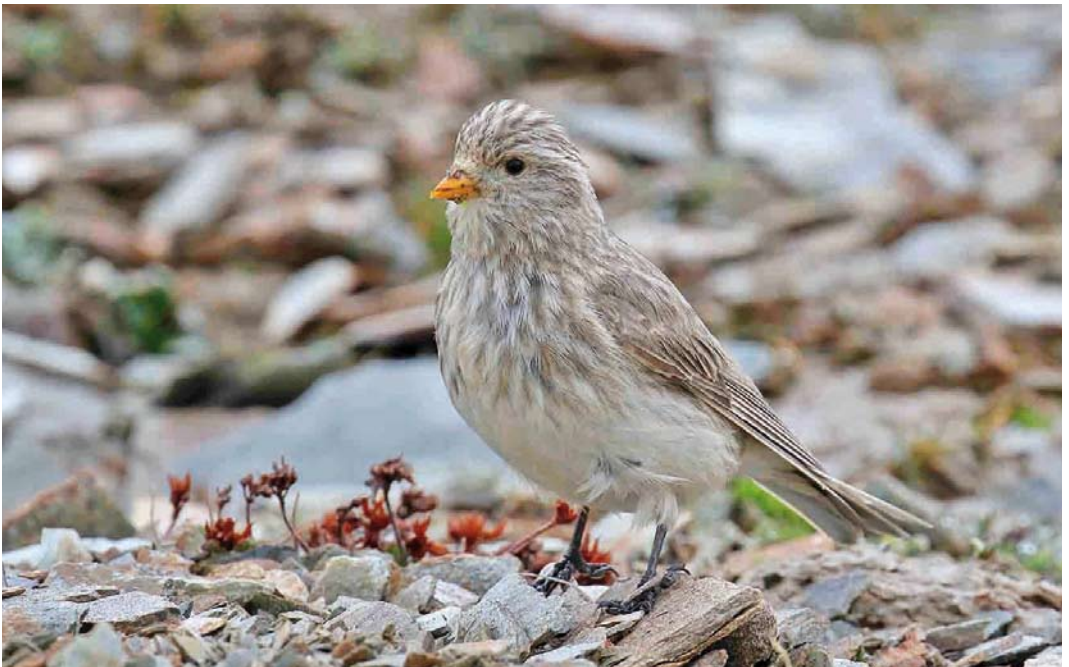
352 Sillem's Mountain Finch / Sillems Bergvink Leucosticte sillemi , female, Qinghai, China, 25 June 2018