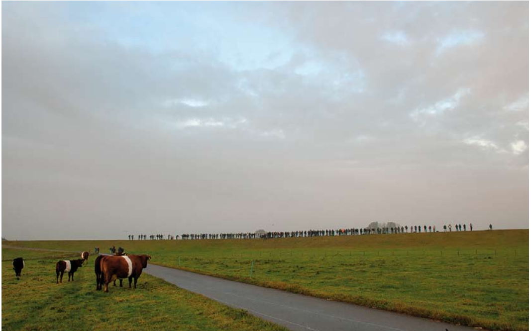
287 Vogelaars bij Taigastrandloper / birders at Long-toed Stint Calidris subminuta , Vreugderijkerwaard, Zwolle, Overijssel, 24 oktober 2009 (Roland Wantia)

schap van Martijn Renders. Een dergelijke stabiele situatie is natuurlijk gewoon goed nieuws omdat het iets zegt over waardering en behoefte van deze rubrieken. Wel stopte al vroeg in de periode, na 12 jaar, de rubriek 'Masters of Mystery'. De zesde en laatste ronde verscheen in het eerste nummer van 2009, waarna alle auteurs twee nummers later gezamenlijk nog eenmaal terugblikten waarbij en passant nog een foute determinatie werd gerectificeerd (een Oostelijke Orpheusgrasmus Sylvia crassirostris bleek toch een Braamsluiper S curruca )... Gelukkig bleek deze determinatiefout geen invloed te hebben gehad op de uitslag: hierover kon dan ook niet worden gecorrespondeerd. Een direct resultaat van de enquête, dat wellicht door slechts enkelen zal zijn opgemerkt, was de overstap naar mat papier met ingang van nummer 2 in 2010 zodat de leesbaarheid verbeterde en de foto's (nog!) scherper uitkwamen. Een andere veel gehoorde wens werd sinds maart 2011 gerealiseerd toen alle oude nummers van Dutch Birding als pdf online beschikbaar kwamen.