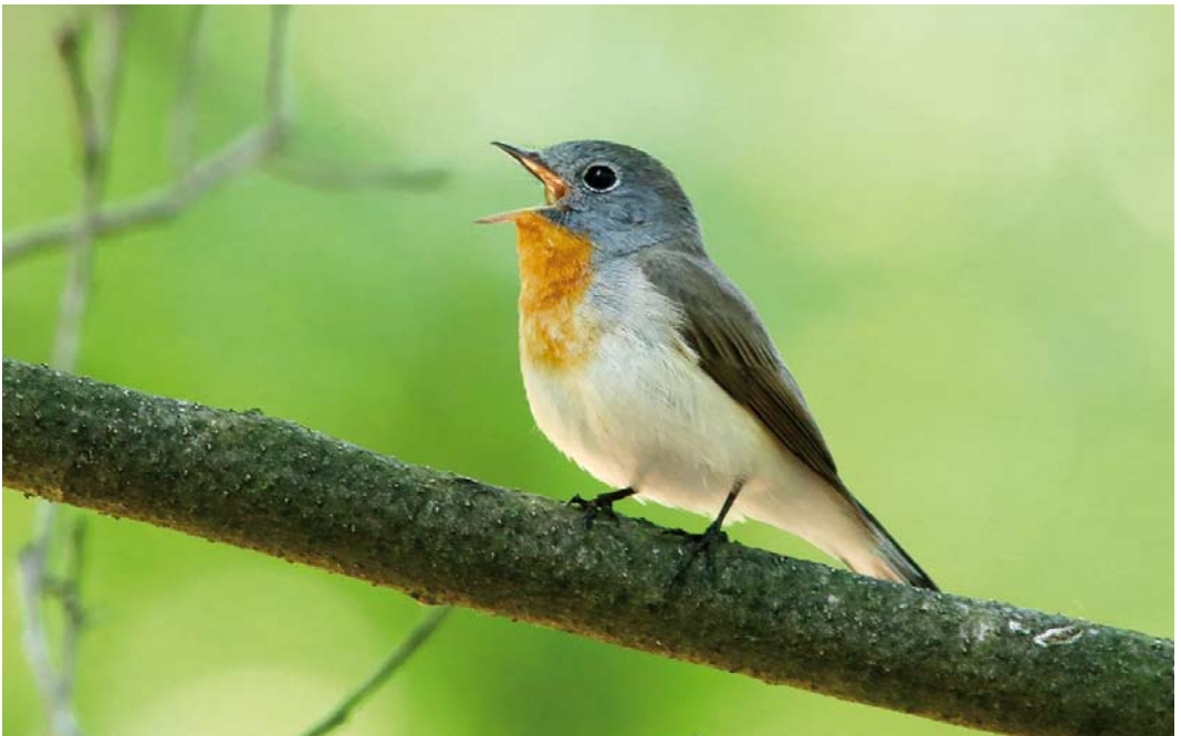
369 Kleine Vliegenvanger / Red-breasted Flycatcher Ficedula parva , adult mannetje, Hoge Veluwe, Gelderland, 22 mei 2018 ( Rob Half )