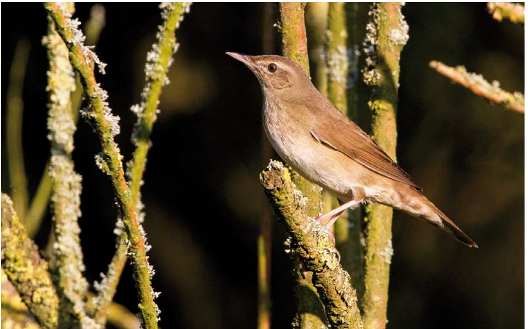
377 Krekelzanger / River Warbler Locustella fluviatilis , Boetelerbroek, Raalte, Overijssel, 15 mei 2018 (Edwin Winkel)