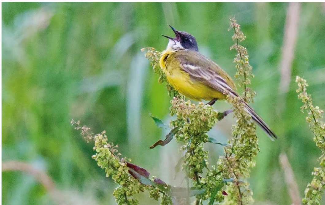
370 Witkeelkwikstaart / White-throated Wagtail Motacilla cinereocapilla , mannetje, Onnerpolder, Groningen, 11 juni 2018