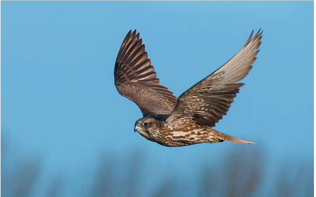
305 Giervalk / Gyr Falcon Falco rusticolus , Zandstraat, Sas van Gent, Zeeland, 22 januari 2012 (Alain de Broyer)