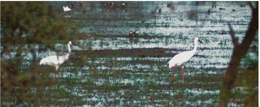
319-321 Siberian Cranes / Siberische Witte Kraanvogels Grus leucogeranus , family groups, Bharatpur, Rajasthan, India, 18 February 1976. In winter of 1975/76, up to 60 adult and seven juvenile individuals were counted. Note Great Egret / Grote Zilverreiger Ardea alba at left in plate 320.