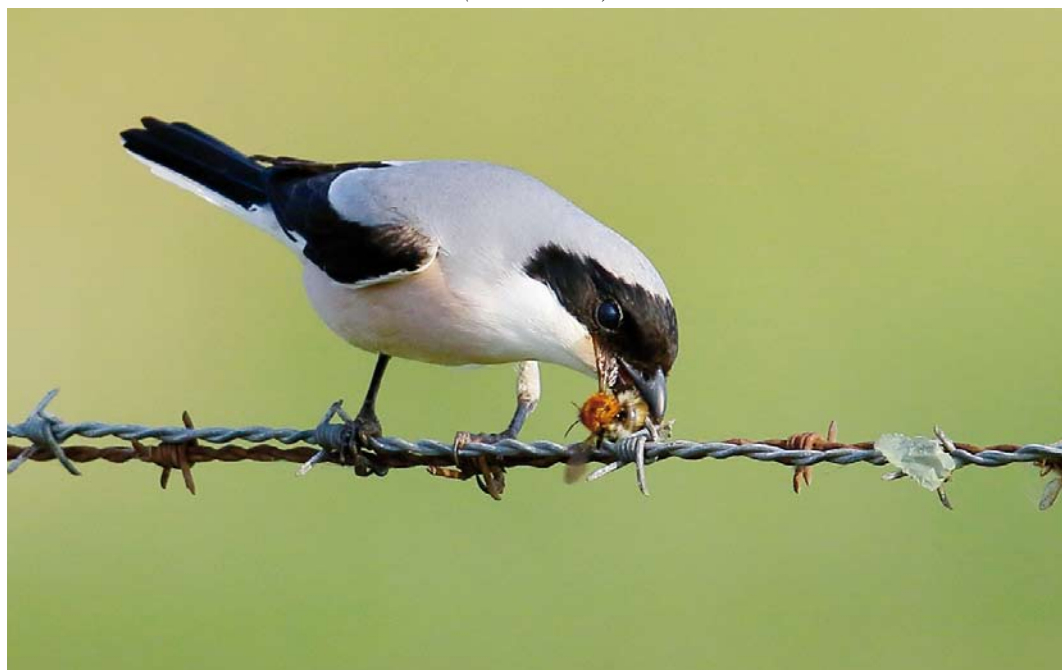
375 Kleine Klapekster / Lesser Grey Shrike Lanius minor , mannetje, Texel, Noord-Holland, 26 mei 2018