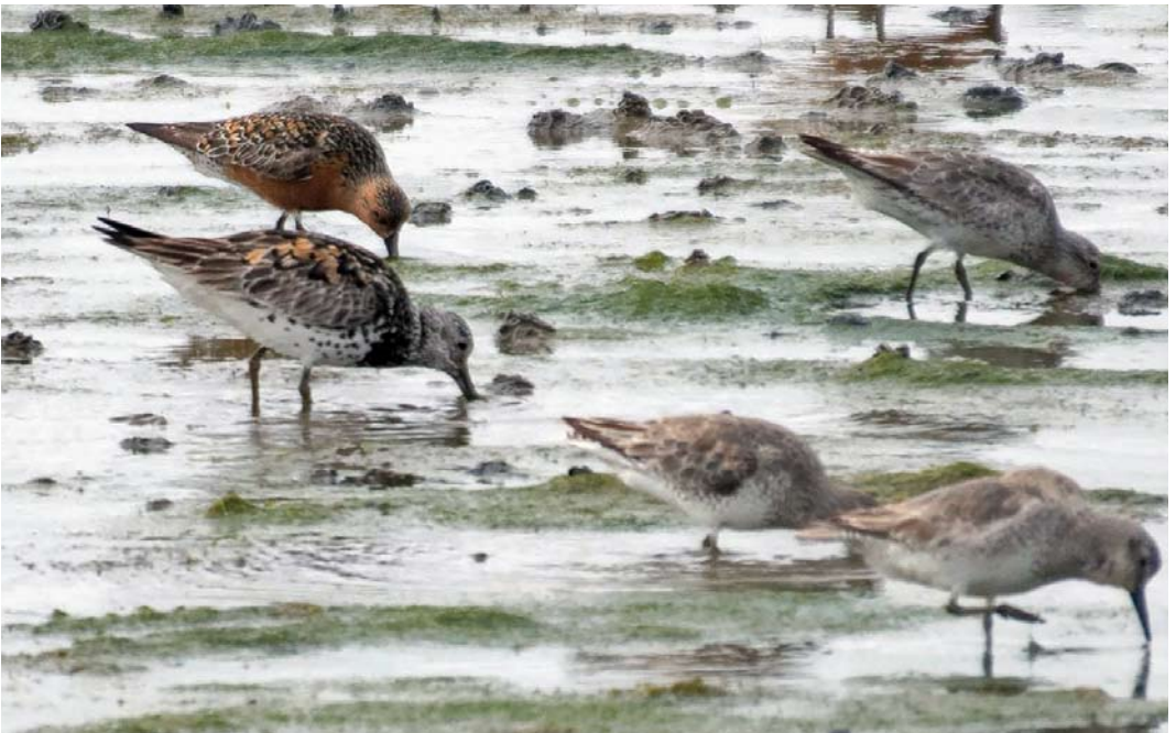
331 Great Knot / Grote Kanoet Calidris tenuirostris , with Red Knots / Kanoeten C. canutus , Seeryp, Terschelling, Friesland, Netherlands, 17 June 2018