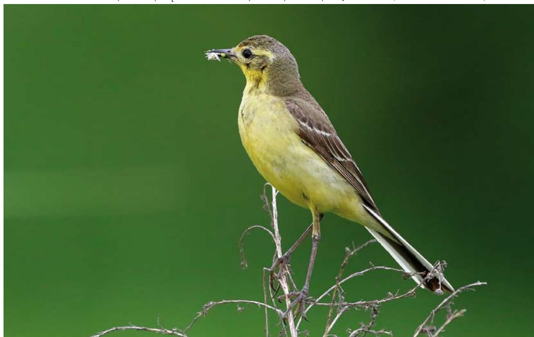
340 Hybrid Western Citrine x Blue-headed Wagtail / hybride Citroenkwikstaart x Gele Kwikstaart Motacilla citreola x flava , female, Dąbrowa Górnicza, Silesia, Poland, 17 June 2018