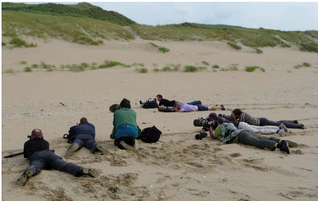
307 Vogelaars bij Bairds Strandloper / birders at Baird's Sandpiper Calidris bairdii (links / left), Meijendel, Zuid-Holland, 29 augustus 2012 (John van der Woude)