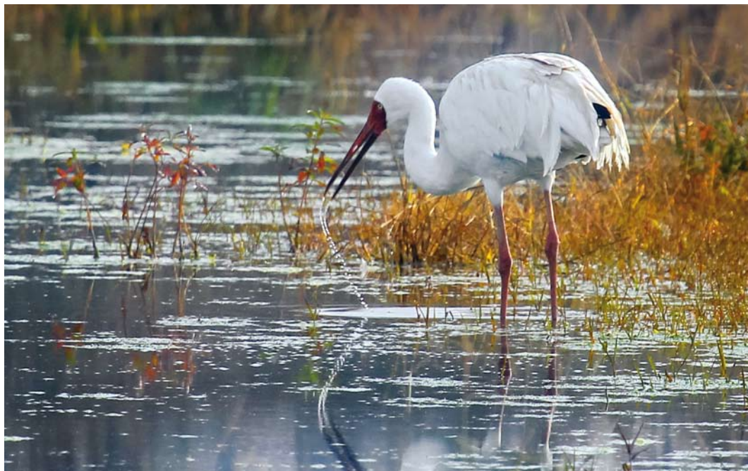
324 Siberian Crane / Siberische Witte Kraanvogel Grus leucogeranus , adult male ('Omid'), Fereydunkenar, Mazandaran, Iran, 15 January 2015 (Hamed Tizrooyan)

National Park, and Kurinskaya Kosa in Kyzyl-Agachsky reserve (Patrikeev 2004). The most recent records in Azerbaijan concerned two individuals in wetlands near Julfa in early November 2008 (Sorokin 2012), and a single bird in Kyzyl-Agachsky reserve on 29 January 2010 (Rozenfeld 2012). The status in Turkey is uncertain. Once, it may have been a vagrant or even a scarce but regular passage migrant but no certain evidence for this is forthcoming (for details, see Kirwan et al 2008). There are at least two records in Ukraine: three individuals were reported near Donetsk in September 1906 and a group of four and a single one were present at Askania Nova reserve near the Black Sea coast from 16 to 24 October 1996 (Snow & Perrins 1998, Havrilenko et al 2012; Paul Bradbeer in litt). Surprising was the first record for Jordan, which concerned three adults roosting at Qa' Khanna, 35 km north-west of Azraq, on 2 February 2001 (Hamidan 2003). A medieval record from the Nile delta in Egypt is also interesting (Provençal & Sørensen 1998).