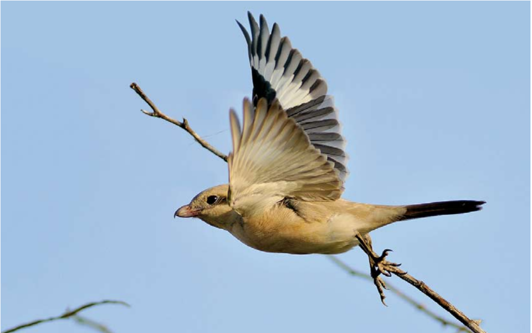
309 Steppeklapekster / Steppe Grey Shrike Lanius lahtora pallidirostris , Texel, Noord-Holland, 30 oktober 2012

We troffen elkaar in de eerste maanden eens niet in een woonwijk. De eerste écht goede soort liet lang op zich wachten. Was de door Tim Zutt en Roelf Hovinga gevonden eerste-zomer Kleine Kokmeeuw C philadelphia op 3 mei op de Razende Bol, Noord-Holland, eerst nog jaloersmakend, met de door Henny Wien op Texel teruggevonden vogel konden twitchers tussen 4 en 18 juni alsnog aanschuiven bij deze langverwachte inhaler. De laatste twitchbare stamde uit 1990. Ongelooflijk dat het zo lang geduurd had! Met drie Bairds Strandlopers waarvan één in het voorjaar en twee in het najaar was het een geweldig jaar voor de soort. De handtamme juveniele vogel die tussen 27 en 30 augustus tussen de badgasten op het strand bij Meijendel, Zuid-Holland, liep, was kwalitatief wellicht de mooiste ooit. Om een Kortbekzeekoet Uria lomvia te zien te krijgen is blijkbaar een ziek, zwak en misselijk exemplaar nodig. Dat die in de zomer zou opduiken had echter niemand kunnen bevroeden. Op 28 en 29 juli zwom een door Atze Witteveen en Merel Zweemer ontdekt exemplaar respectievelijk in Lauwersoog en langs de Kustweg, Groningen, om tussen 11 en 13 augustus op te duiken bij Huisduinen, Noord-Holland (teruggevonden door trouwe zeetrekters Fred Geldermans en Kees Rebel). Daar over-