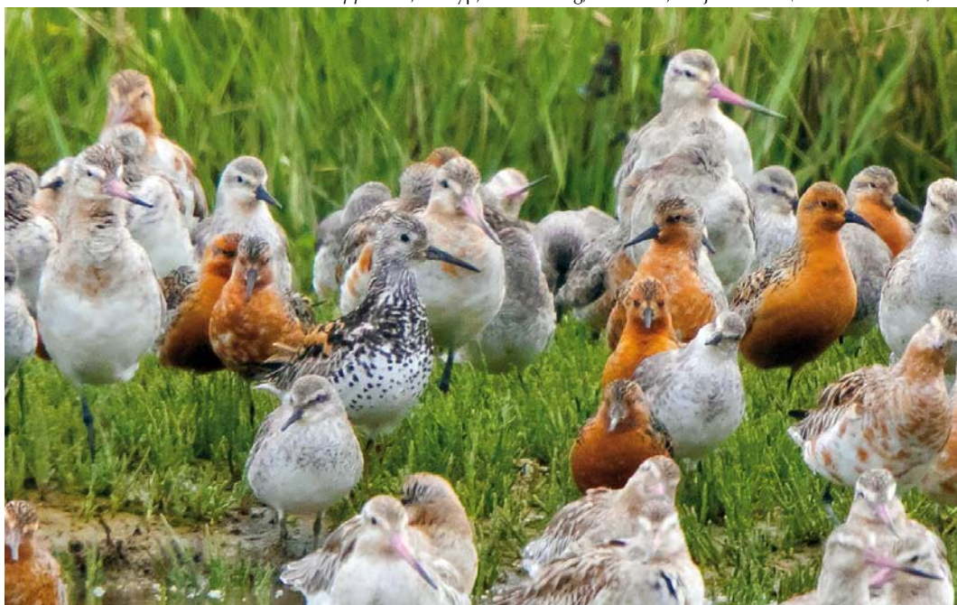
354 Grote Kanoet / Great Knot Calidris tenuirostris , zomerkleed, met Kanoeten / Red Knots C. canutus en Rosse Grutto's / Bar-tailed Godwits Limosa lapponica , Seeryp, Terschelling, Friesland, 16 juni 2018