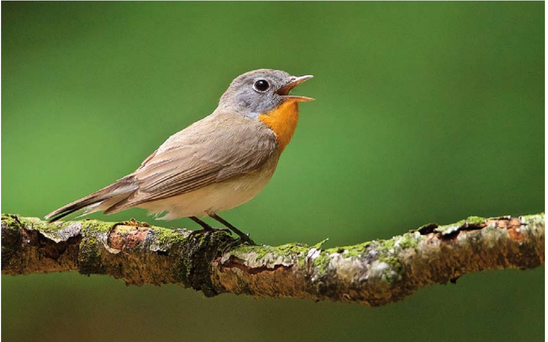
368 Kleine Vliegenvanger / Red-breasted Flycatcher Ficedula parva , adult mannetje, Hoge Veluwe, Gelderland, 3 juni 2018