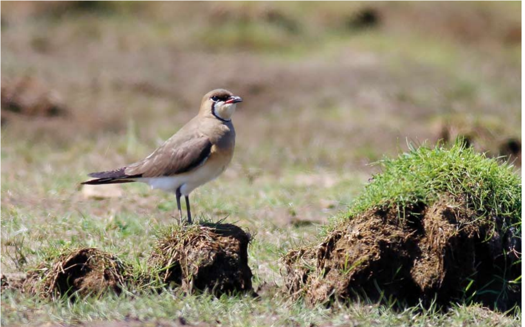
330 Oriental Pratincole / Oosterse Vorkstaartplevier Glareola maldivarum , adult, Nærland, Hå, Rogaland, Norway, 20 May 2018 (Ove Ferling)