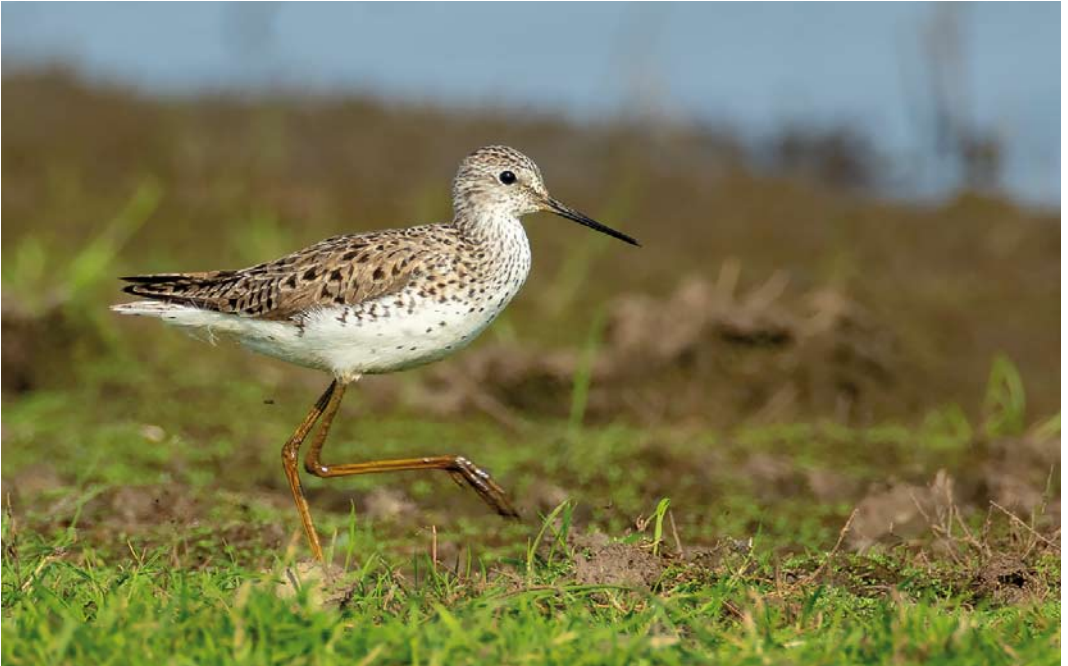
355 Poelruiter / Marsh Sandpiper Tringa stagnatilis , Middelburg, Zeeland, 26 mei 2018