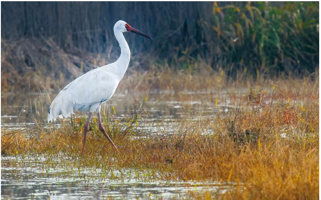
323 Siberian Crane / Siberische Witte Kraanvogel Grus leucogeranus , adult male ('Omid'), Fereydunkenar, Mazandaran, Iran, 15 January 2015