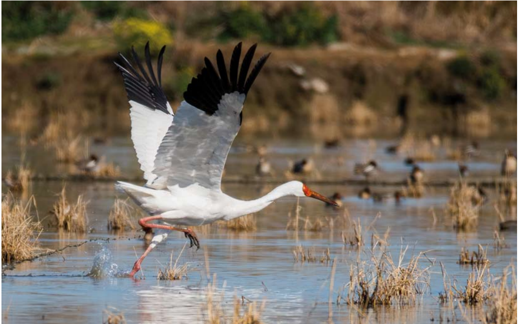
322 Siberian Crane / Siberische Witte Kraanvogel Grus leucogeranus , adult male ('Omid'), Fereydunkenar, Mazandaran, Iran, 30 January 2017