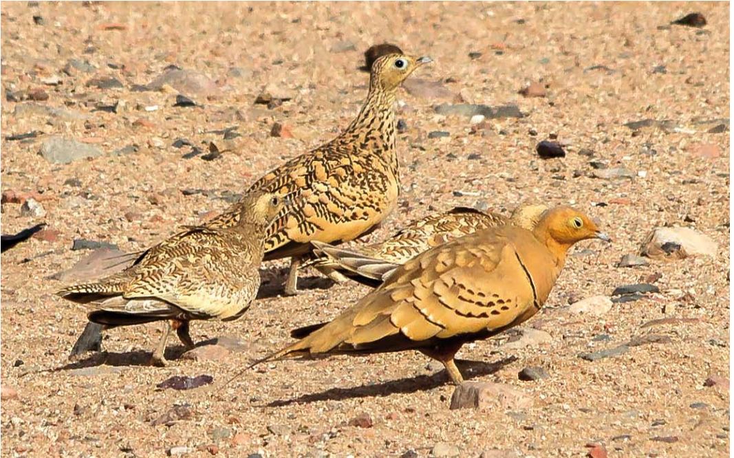
328 Chestnut-bellied Sandgrouse / Roodbuikzandhoenders Pterocles exustus floweri , male and female with juveniles, Gebel Elba, Hala'ib Triangle, Egypt, 24 July 2018 (Ali Dora)