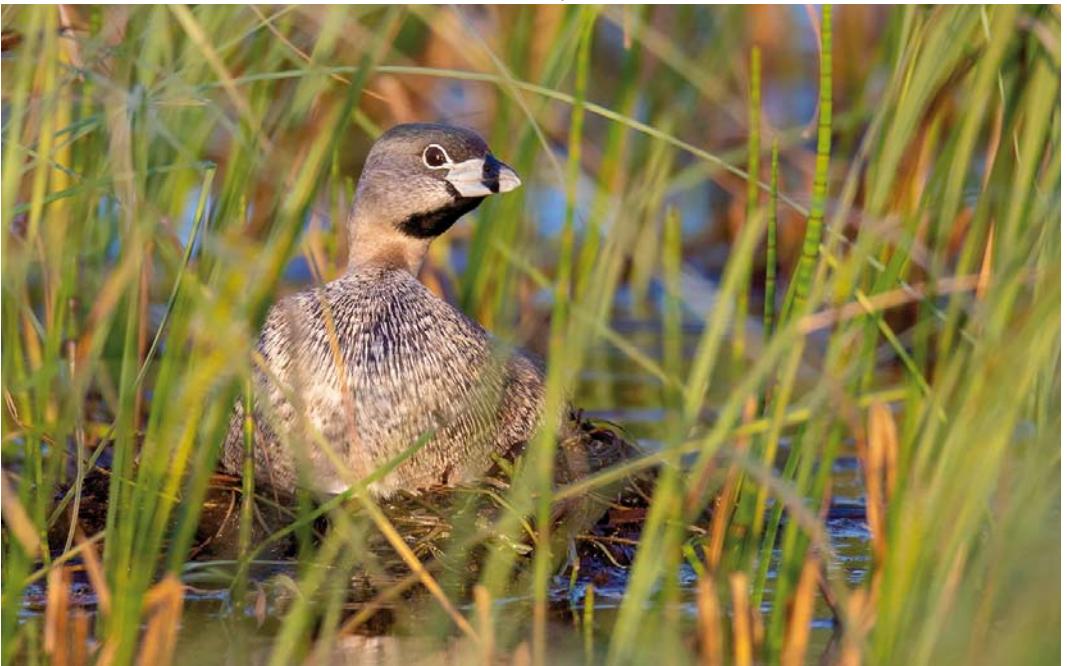
329 Pied-billed Grebe / Dikbekfuut Podilymbus podiceps , adult male, Loch Feorlin, Argyll, Scotland, 27 May 2018