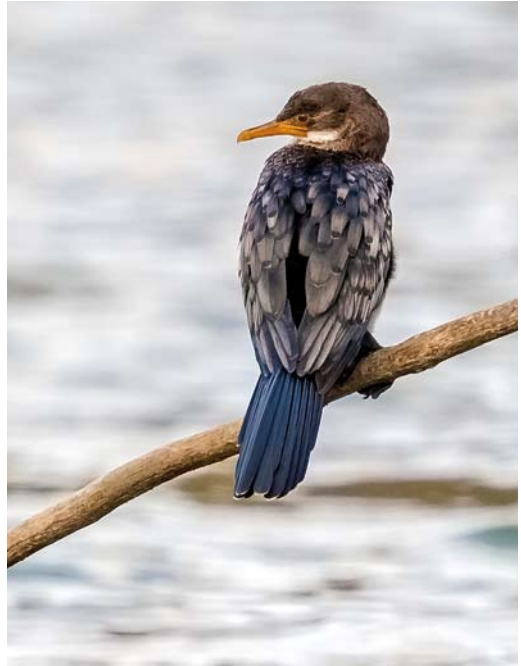
325 Red-footed Booby / Roodpootgent Sula sula , subadult, Punta de la Vaca, Gozón, Asturias, Spain, 6 June 2018 326 Reed Cormorant / Afrikaanse Dwergaalscholver Phalacrocorax africanus , Pedra Badejo, Santiago, Cape Verde Islands, 30 April 2018 cf Dutch Birding 40: 183, 2018 327 Mauritanian Heron / Mauritaanse Reiger Ardea monicae , La Sagra, Dakhla, Western Sahara, Morocco, 23 February 2018 cf Dutch Birding 40: 118, 2018