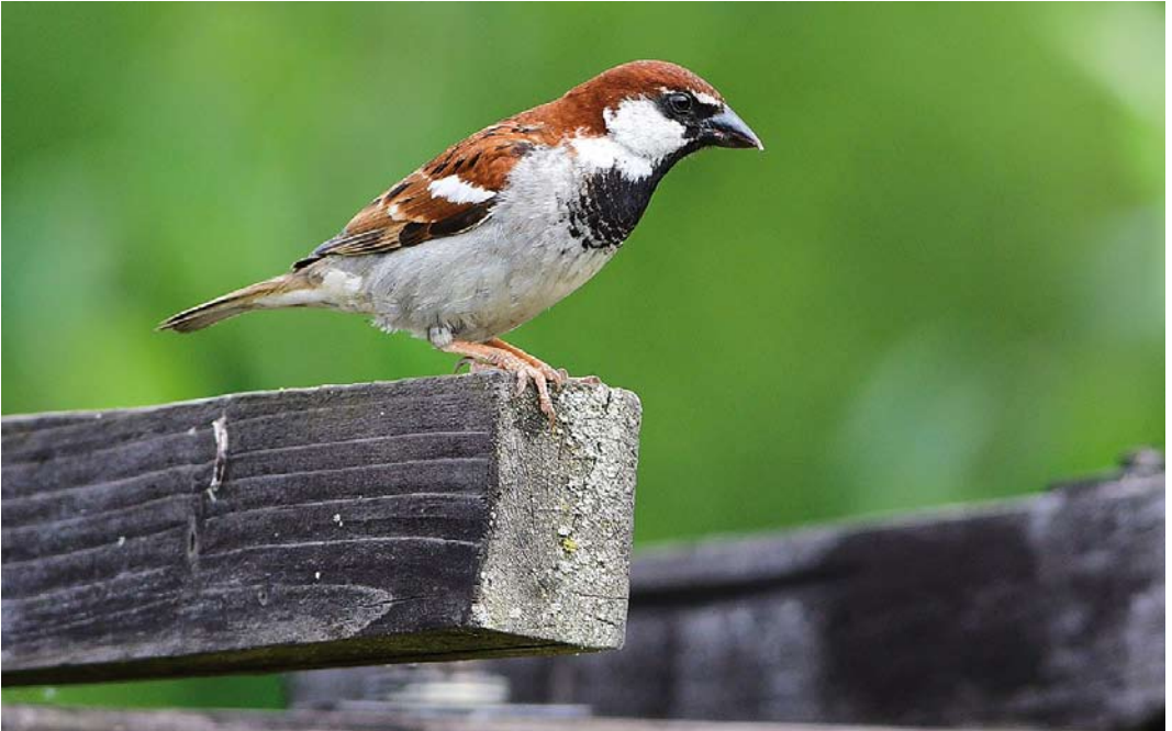
349 Presumed Italian Sparrow / vermoedelijke Italiaanse Mus Passer italiae , adult male, Güstrow, Mecklenburg-Vorpommern, Germany, 14 June 2018 ( Martin Gottschling )