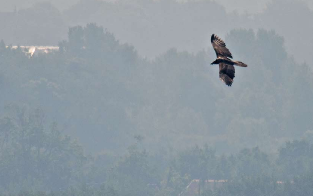
337 Bearded Vulture / Lammergeier Gypaetus barbatus , third calendar-year, Dishoek, Zeeland, Netherlands, 28 May 2018