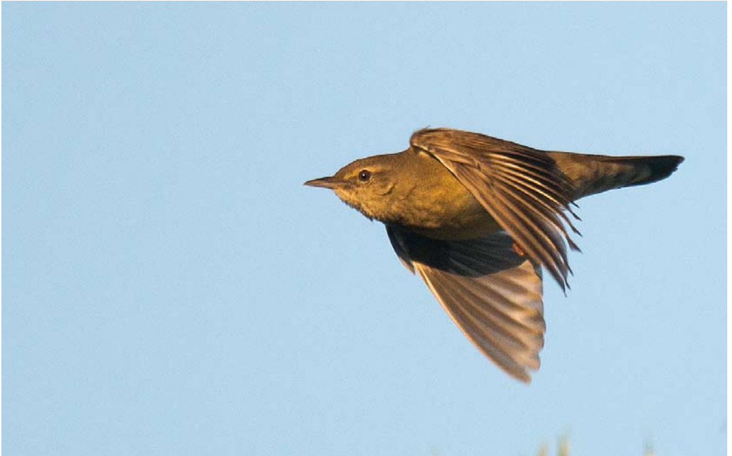
376 Krekelzanger / River Warbler Locustella fluviatilis , Boetelerbroek, Raalte, Overijssel, 21 mei 2018 (Arnoud B van den Berg)