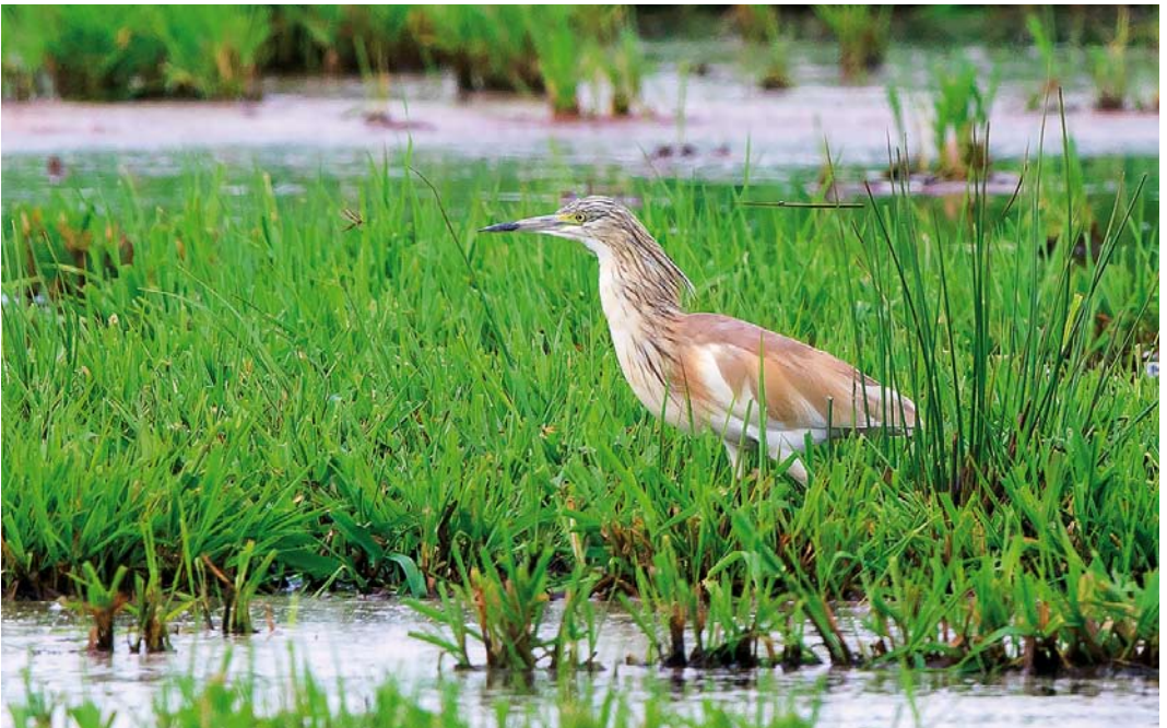
356 Ralreiger / Squacco Heron Ardeola ralloides , Oostpolder, Zuidlaardermeer, Groningen, 12 mei 2018