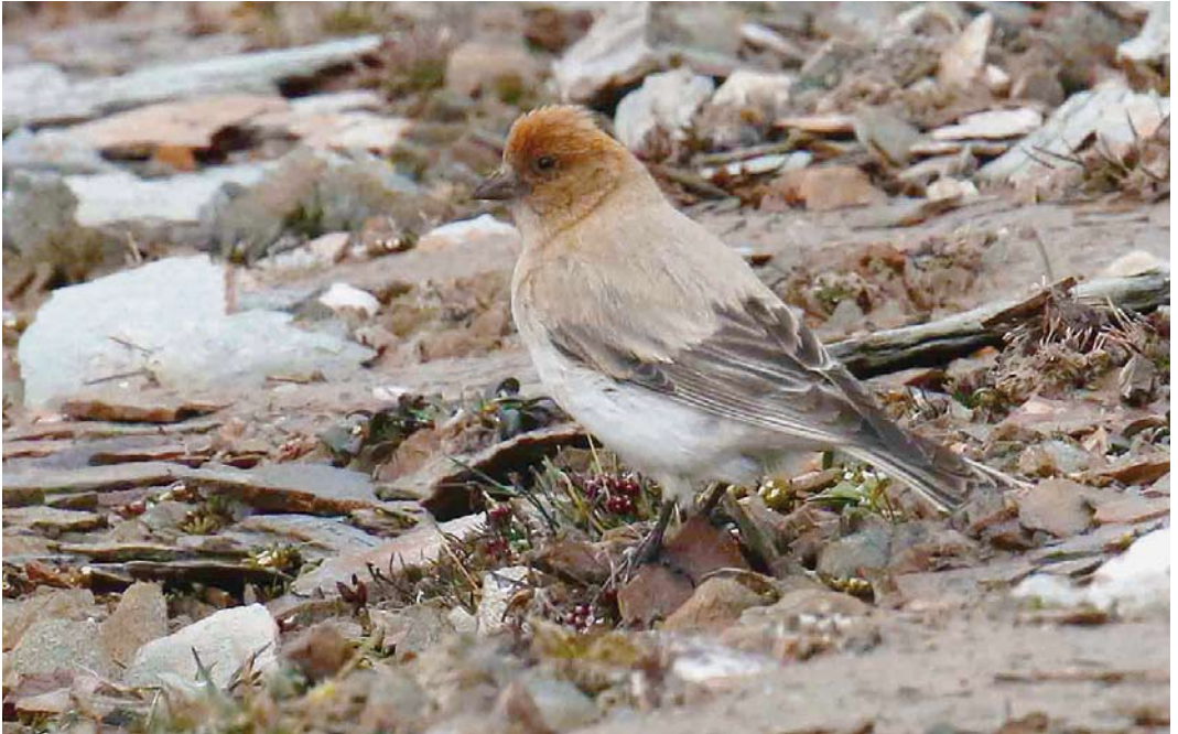
351 Sillem's Mountain Finch / Sillems Bergvink Leucosticte sillemi , male, Qinghai, China, 25 June 2018 (Werner Müller)