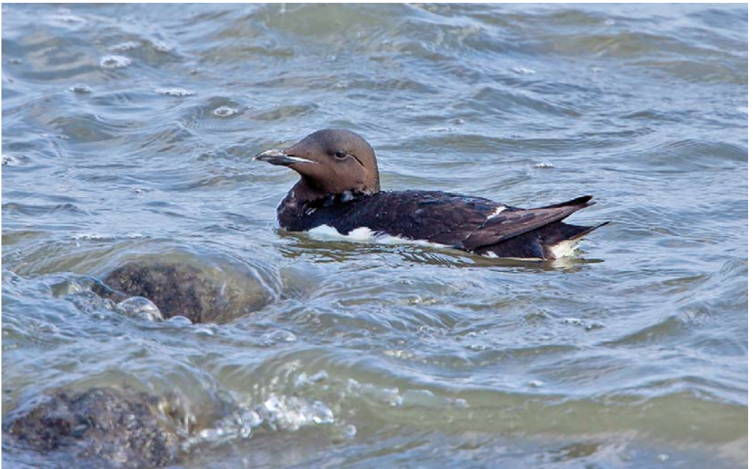
306 Kortbekzeekoet / Thick-billed Murre Uria lomvia , adult, Lauwersoog, Groningen, 29 juli 2012