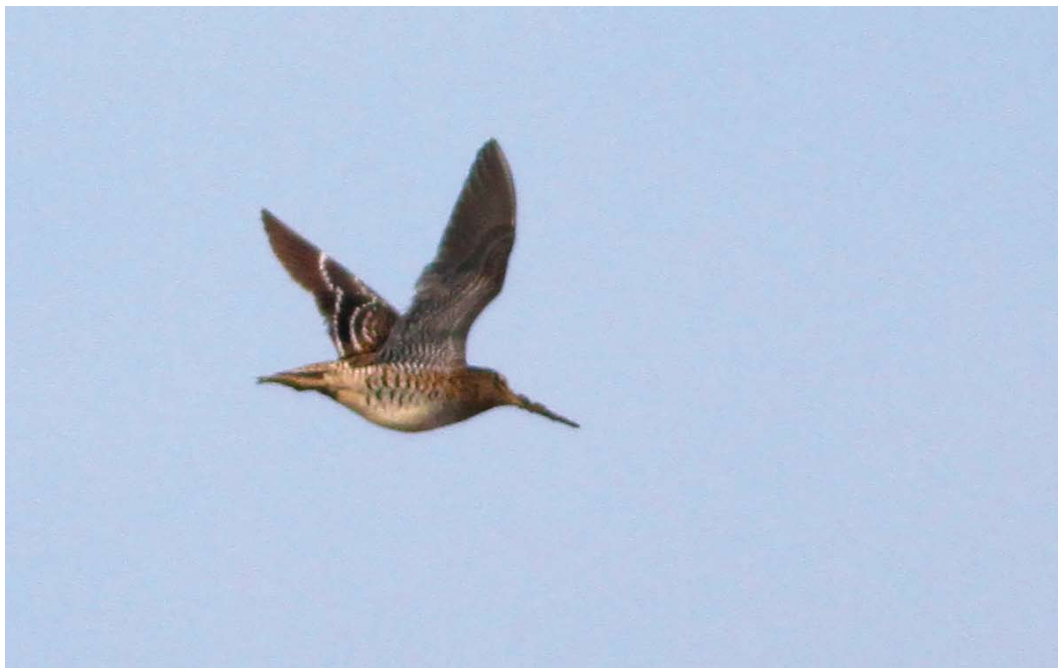
357 Poelsnip / Great Snipe Gallinago media , Babberich, Gelderland, 26 mei 2018 (Guus Jenniskens)