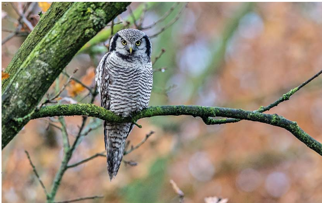
313 Sperweruil / Northern Hawk-Owl Surnia ulula , Zwolle, Overijssel, 28 november 2013