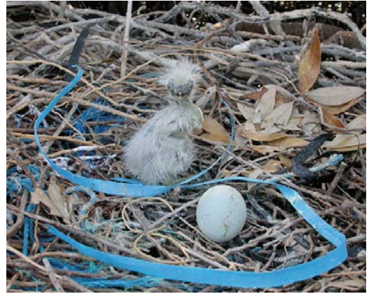
317-318 Goliath Heron / Reuzenreiger Ardea goliath , nest with one egg and one young chick, Wadi Lahami, Egypt, 28 April 2006

a recently hatched chick. The nest was a near-circular platform more than 1 m wide with a central depression, built of dead sticks and c 0.5-0.8 m above the water surface in low branches of a mangrove tree (plate 317-318). The size of the nest and egg and appearance of the chick, together with the fact that an adult was flushed from the vicinity of the nest, left no doubt that this nest was from a Goliath. As soon as the nest was photographed, PAC left the area and the three of us moved away to allow the adult to return to the nest. We did not visit the spot again to minimize disturbance and left the area the next day so we have no information on the fate of the nest.