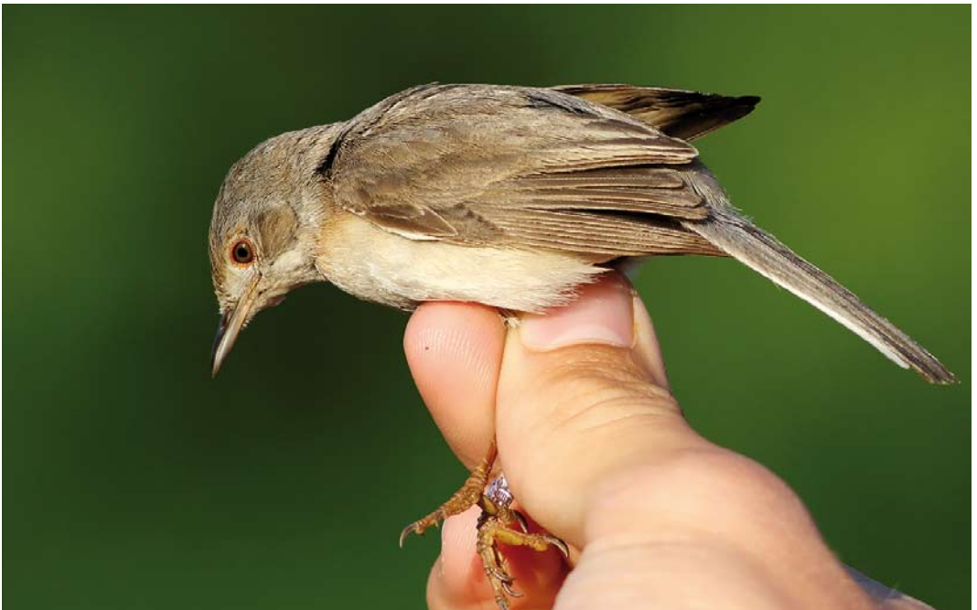
342 Nominate Eastern Subalpine Warbler / nominaat Balkanbeardgrasmus Sylvia cantillans cantillans , female, Christiansø, Denmark, 2 June 2018