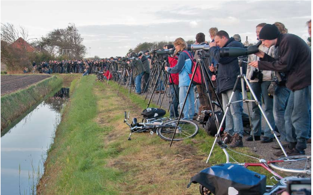
285 Vogelaars bij Kaspische Plevier / birders at Caspian Plover Anarhynchus asiaticus , Texel, Noord-Holland, 18 oktober 2009 (Arnaud B van den Berg)