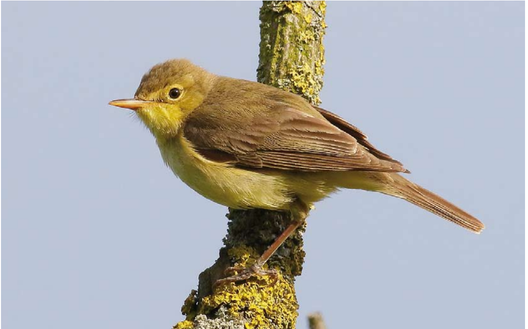
372 Orpheusspotvogel / Melodious Warbler Hippolais polyglotta , Castricum, Noord-Holland, 17 mei 2018