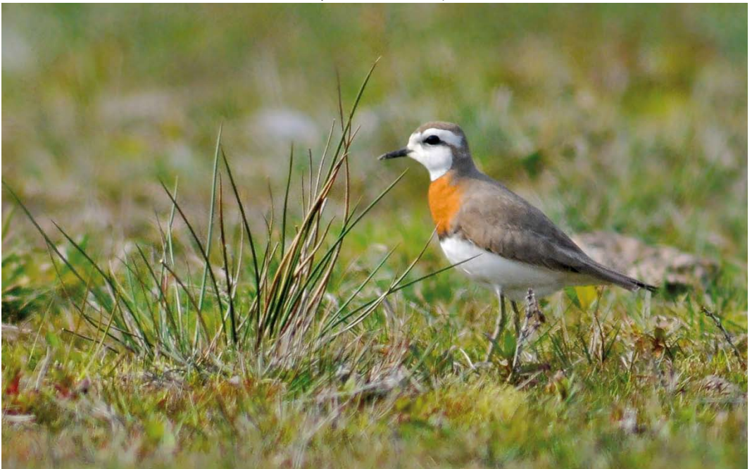
301 Kaspische Plevier / Caspian Plover Anarhynchus asiaticus , adult zomer mannetje, Texel, Noord-Holland, 27 april 2011 (René Pop)