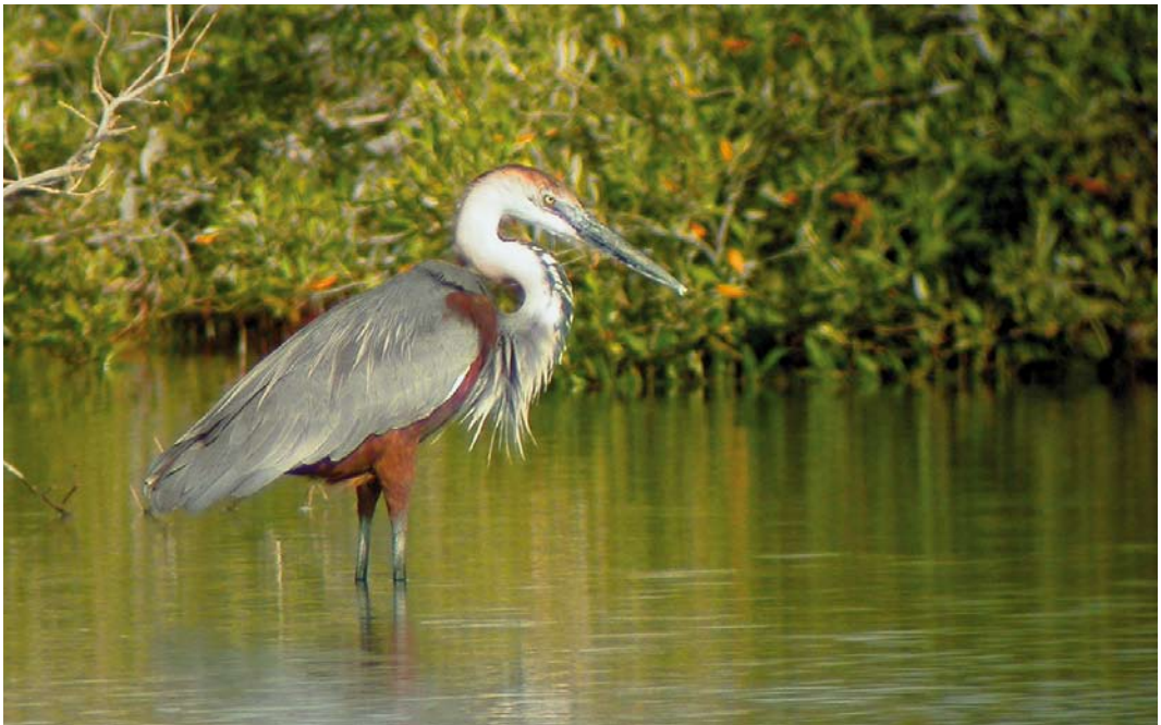
316 Goliath Heron / Reuzenreiger Ardea goliath , adult, Wadi Lahami, Egypt, 28 April 2006. This bird was flushed from spot where nest (plate 317-318) was found.

We visited the southern Red Sea coast of Egypt during a three-week trip in April 2006 to look for several specialities that can be seen in this area. Of course, Goliath Heron was one of them. In the morning of 28 April, we visited the mangrove areas of Wadi Lahami. As we started walking along the edge of the mangroves, we heard repeated low-pitched bird calls that we could not identify. One of us (PAC) started to wade into the shallow water to investigate the sounds and quickly found out that they were made by several adult Indian Reef Herons Egretta gularis schistacea whose behaviour was suggestive of breeding. As PAC passed around the corner of a clump of an Avicennia marina mangrove tree, he flushed a huge bird that he quickly recognized as a Goliath, the very species we were looking for. The heron flew only a short distance and landed in a small lagoon inside the mangroves (plate 316). Checking the area from where the heron had been flushed, PAC immediately noticed a very large nest with an egg and