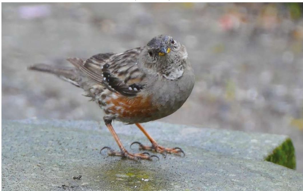
371 Alpenheggenmus / Alpine Accentor Prunella collaris , Oostvoorne, Zuid-Holland, 30 april 2018