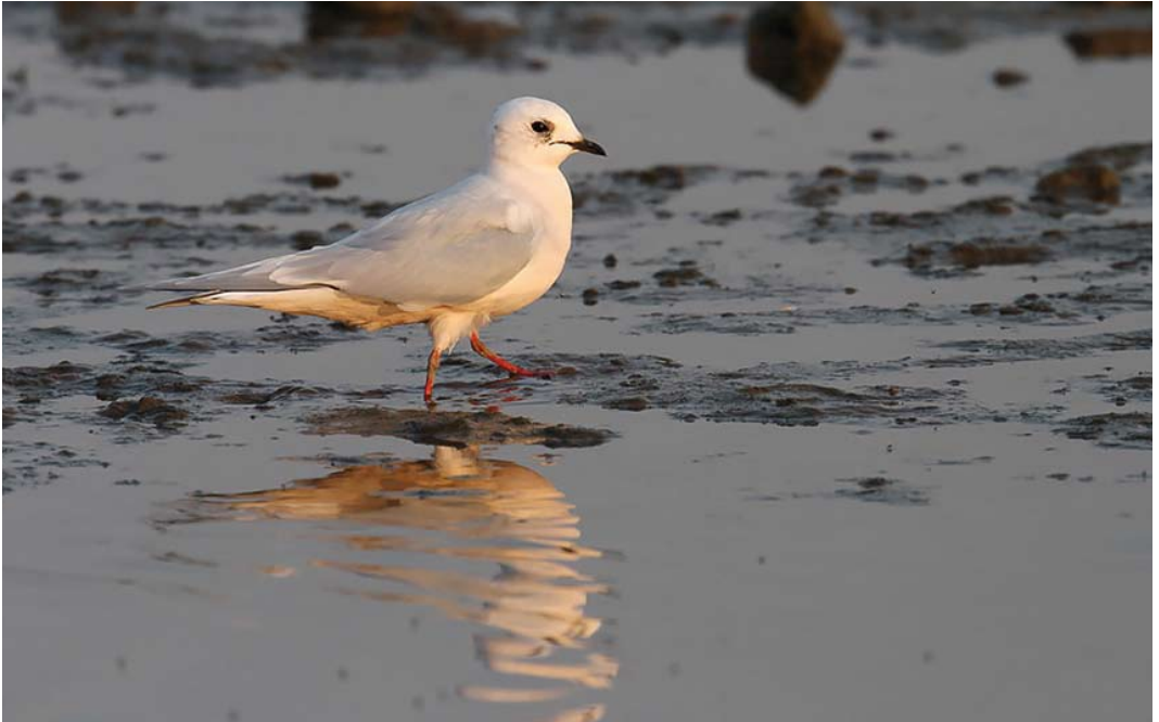
300 Ross' Meeuw / Ross's Gull Rhodostethia rosea , Numansdorp, Zuid-Holland, 23 april 2011