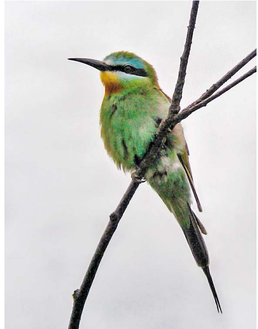
297 Groene Bijeneter / Blue-cheeked Bee-eater Merops persicus , Castricum, Noord-Holland, 16 augustus 2010 (Leo Heemskerck)

leuca werd op 17 oktober door Mark Hoekstein gevonden op zijn geliefde Noord-Beveland, Zeeland. De vogel zou tot 7 mei 2012 – bijna 19 maanden – blijven: dat is nog eens een kans voor de late beslisser! De eerste Daurische Klauwier voor het binnenland zat op 31 oktober bij Bergen, Limburg. Het was ook een najaar met vier Blauwstaarten Tarsiger cyanurus (drie vangsten): ooit een mega maar in de hier behandelde tijdsperiode worden tot jaarsoort. De tweede Meenatortel werd op 16 november door een Duitse visser gefotografeerd op een boot ter hoogte van Texel. Arnold Meijer zorgde bijna 20 jaar na het eerste geval op 22 november voor veel vreugde onder vogelaars met zijn Rotskruiper Tichodroma muraria in de ENCI-groeve bij Maastricht. Niet iedereen was echter even blij: de vogel was vaak erg moeilijk te vinden en er is een auto die er vanuit de Randstad vijf keer heen is gereden. Zonder resultaat voor de inzittenden. De vogel zou in maart 2012 nogmaals – eenmalig – worden gezien. Op 24 en 25 december was Nederland bedekt met sneeuw en ijs. Precies op deze dagen besloot de eerste Grote Trap Otis tarda sinds 1997 zich eerst te laten zien en vervolgens flink te verplaatsen van Gelderland