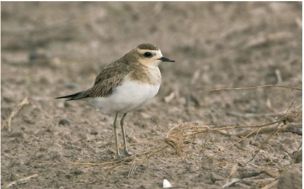
286 Kaspische Plevier / Caspian Plover Anarhynchus asiaticus , eerstejaars, Texel, Noord-Holland, 19 oktober 2009 (Ad Postma)