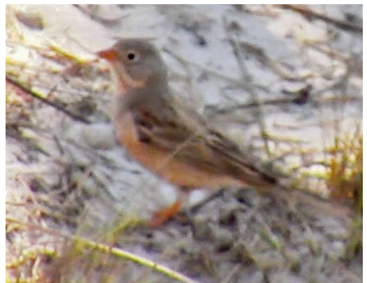
343 Little Bustard / Kleine Trap Tetrax tetrax , adult male, Karsiborska Kępa, Świnoujście, Pomerania, Poland, 12 May 2018 344 Red-tailed Shrike / Turkestaanse Klauwier Lanius phoenicuroides , male, Lezíria da Ponta da Erva, Vila Franca de Xira, Lisboa, Portugal, 14 July 2018 345 Amur Wagtail / Amoerkwikstaart Motacilla leucopsis , male, Kanshengel, Taukum, Kazakhstan, 21 May 2018 346 Black-faced Bunting / Maskergors Emberiza spodocephala , first-year male, Norwick, Unst, Scotland, 14 May 2018 347 Bimaculated Lark / Bergkalanderleeuwerik Melanocorypha bimaculata , Hillesland, Karmøy, Rogaland, Norway, 1 June 2018 348 Grey-necked Bunting / Steenortolaan Emberiza buchanani , male, Gotska Sandön, Gotland, Sweden, 2 June 2018