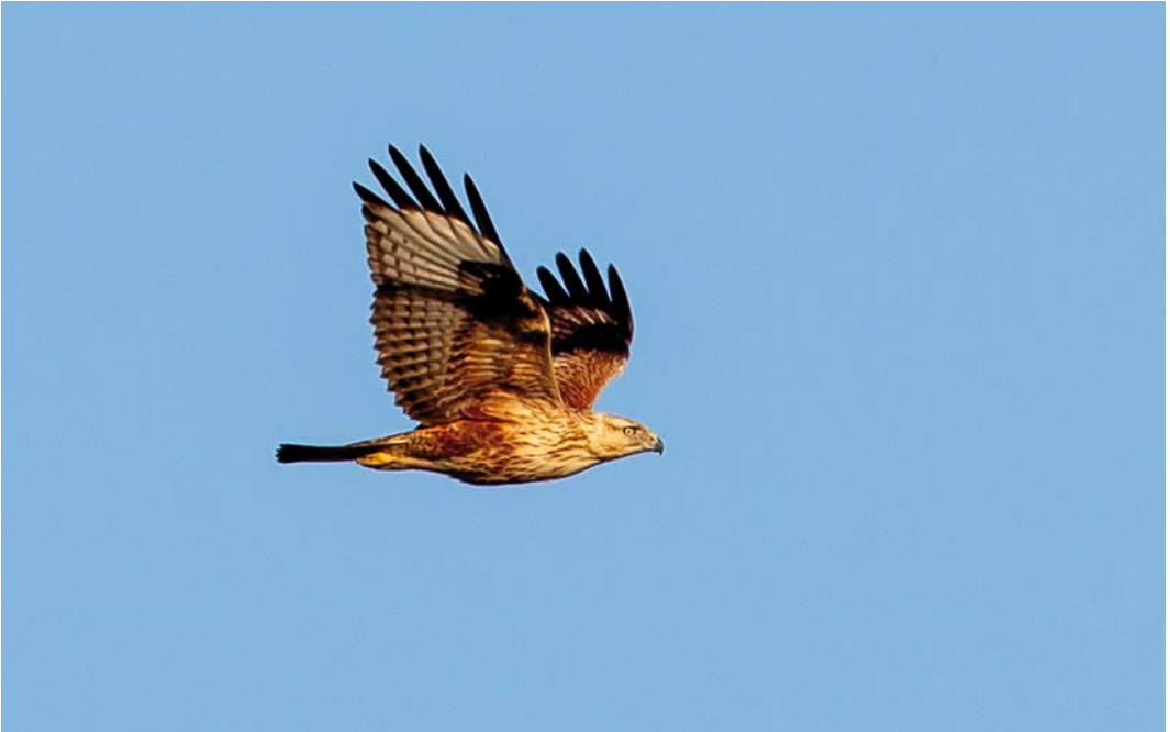
310 Arendbuiser / Long-legged Buzzard Buteo rufinus , juveniel, Tweede Maasvlakte, Zuid-Holland, 11 december 2013.

hoop of verwachting dat er een splitje inzat. Beter waren deze speculanten tussen 8 en 23 oktober echter overgestoken naar Texel, waar de door Diederik Kok gevonden roodborsttapuit later op een wel heel bijzondere wijze de eerste Stejnegers Roodborsttapuit bleek (zie boven). Dit taxon werd 'tot overmaat van ramp' kort daarna – in tegenstelling tot de Kaspische – wél gesplit. De eerstejaars Steppeklapekster Lahtora pallidirostris die Siebold van Breukelen op 27 oktober op Texel vond en die zich tot 9 november prachtig liet bekijken, was pas het tweede geval. De vorige stamde uit 1994, ook van Texel en daarmee was dit de derde welkome inhaler van het jaar. De Oosterse Zwarte Roodstaarten van 8-12 november bij Rolde, Drenthe (door Andre-Wilem Faber), en van 9-12 november bij Paessens, Friesland (door Rudie Huiting en Bert Duker), werden door velen bezocht.