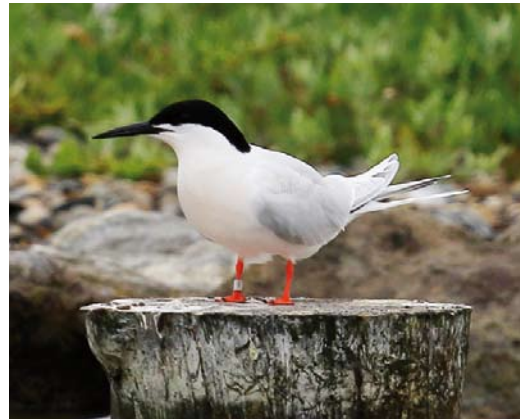
362 Bastaardarend / Greater Spotted Eagle Aquila clanga , vierde-kalenderjaar, Texel, Noord-Holland, 27 mei 2018 (Eric Menkveld) 363 Terekruijer / Terek Sandpiper Xenus cinereus , met Bontbekplevier / Common Ringed Plover Charadrius hiaticula , Den Oever, Noord-Holland, 21 mei 2018 (Fred Visscher) 364 Ralreiger / Squacco Heron Ardeola ralloides , Noordervroon, Westkapelle, Zeeland, 26 mei 2018 (Corstiaan Beeke) 365 Dougalls Stern / Roseate Tern Sterna dougallii , adult zomerkleed, De Putten, Camperduin, Noord-Holland, 25 juni 2018 (Eric Menkveld)

op 6 mei gefotografeerd bij Mirns, Friesland. Diezelfde dag was er ook een melding vanuit een rijdende auto vanaf de A2 bij Velddriel, Gelderland. Een onvolwassen Lammergier Gypaetus barbatus zonder 'merktekens' werd op 27 mei ontdekt op Walcheren, Zeeland, waar hij de nacht doorbracht bij Klein Valkenisse. Nadat hij de volgende ochtend hoog was opgestegen, ontbrak elk spoor tot hij op 29 mei kortstondig werd waargenomen bij Krabbendijke, Zeeland. Weer een dag later bleek hij zich te hebben verplaatst naar Noord-Holland, waar hij zich op 31 mei en 1 juni uitvoerig liet bekijken in de Schoorlse Duinen. De laatste waarnemingen werden gedaan op 2 juni, toen hij ver oostwaarts ten noorden van Deventer, Overijssel, vloog. Slangenarenden Circaetus gallicus werden op c negen verschillende plaatsen gemeld, maar alleen op de beste locaties voor deze soort, het Fochteloërveen, Drenthe/Friesland, en het Deelensche Veld op de Hoge Veluwe, Gelderland, bleven ze