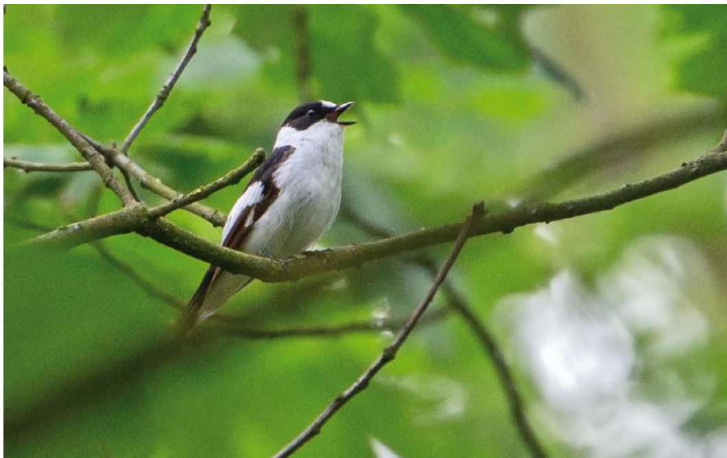
374 Withalsvliegenvanger / Collard Flycatcher Ficedula albicollis , Vierhouten, Gelderland, 13 mei 2018 (Alex Bos)