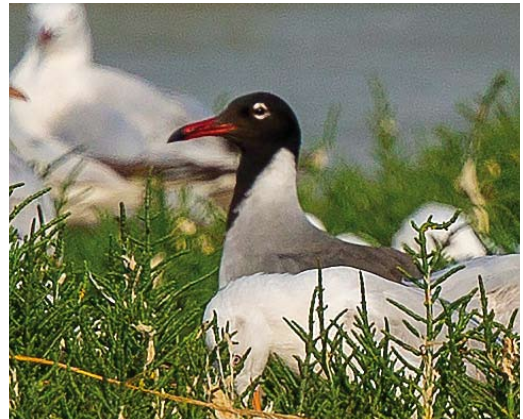
333 Northern Harrier / Amerikaanse Blauwe Kiekendief Circus hudsonius , male, Røstlandet, Nordland, Norway, 8 June 2018 334 Western Reef Heron / Westelijke Riffreiger Egretta gularis gularis , Dakhla, Western Sahara, Morocco, 17 March 2018 cf Dutch Birding 40: 118, 2018 335 American Royal Tern / Amerikaanse Koningsstern Sterna maxima , second-summer, Church Norton, West Sussex, England, 19 June 2018 336 White-eyed Gull / Witoogmeeuw Larus leucophthalmus , adult, Jahra pools reserve, Kuwait, 22 May 2018 cf Dutch Birding 40: 183, 2018

a female Black-browed on Bird Island, South Georgia, southern Atlantic, in 2007-10 were indeed genuine hybrids; previously, there were only five known or suspected mixed-species pairs, and three different hybrids in albatrosses, mostly between closely related species ( https://tinyurl.com/y739gwzu ). If accepted, a Leach's Storm Petrel Hydrobates leucorhous photographed off Khor Kalba on 25 May will be the first alive for the United Arab Emirates (UAE); the previous one was found dead on the road at the old Sharjah airfield on 8 June 1969. In the context of Jouanin's Petrel Bulweria fallax photographs in Sandgrouse 40: 86-89, 2018, it is worthwhile to add locality details for captions of two pictures of this species published in Dutch Birding 9: 72-73, 1987; the upper picture was taken in Arabian Sea at 11.47°N, 60.54°E (1 July 1985; east of Socotra) and the lower one in Gulf of Aden at 12.42°N, 50.56°E (4 July