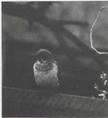
35-36. Black-throated Thrush/Zwartkeellijster Turdus ruficollis atrogularis , Groningen (Groningen), March-April 1981