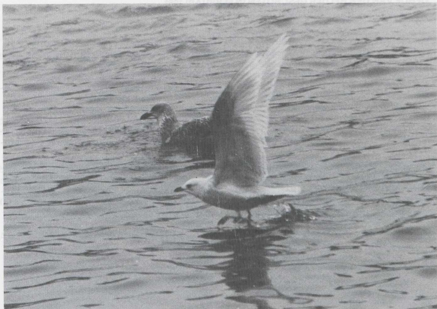
23. Iceland Gull/Kleine Burgemeester Larus glaucooides , first-winter, IJmuiden (Noord-Holland), February 1981 (Jan Mulder)