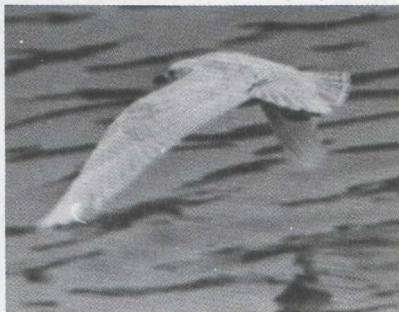
21-22. Iceland Gull/Kleine Burgemeester Larus glaucooides , first-winter, IJmuiden (Noord-Holland), February 1981 (Jan Mulder)