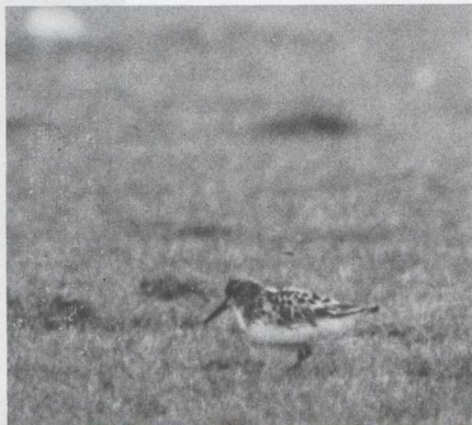
30-31. Red Kite/Rode Wouw Milvus Milvus , Castricum (Noord-Holland), May 1981 (Pieter Bison); Broad-billed Sandpiper/Breedbekstrandloper Limicola falcinellus , De Maasvlakte (Zuid-Holland), May 1981 (René Pop)