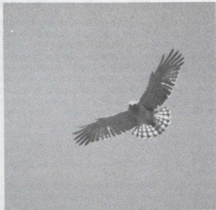
15-16. Slangenarend/Short-toed Eagle Circaetus gallicus , Frankrijk, mei 1980

arend pleiten de rijen donkere vlekken op de ondervleugels en het ontbreken van polsvlekken. Opgemerkt dient te worden dat sommige Wespendienven precies hetzelfde vertonen (cf. Svensson). Svensson noemt de staart juist smal, met zeer rechte zijanten en, hoewel enigszins rond aan het eind, met scherpe hoeken aan de zijden. Andere roofvogels zoals met name de Wespendif en minder frequent de Bui-zerd, draaien ook wel met de staart.