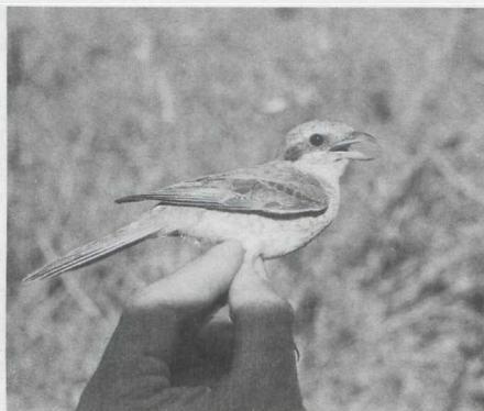
57-58. Isabelline Shrikes/Isabelklawieren Lanius isabellinus phoenicuroides , first-autumn, November 1981 (David Pearson); 59-60. Red-backed Shrike/Grauwe Klawier Lanius collurio , first-autumn, Sudan, September 1981 (David Pearson)