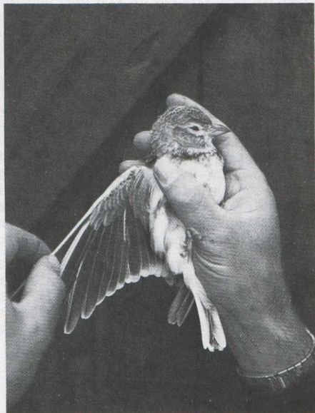
54-55. Kalanderleeuwerik/Calandra Lark Melanocorypha calandra , Castricum (NH), oktober 1980