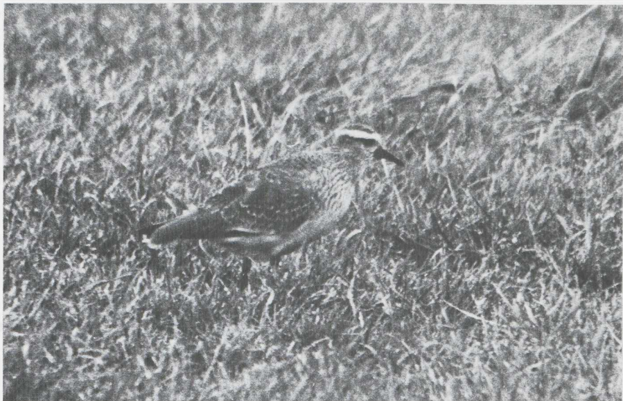
72-73. Steppiekievit/Sociable Plover Chettusia gregaria , eerste kalenderjaar, Me-naldum (F), november 1981 ( Frans Hoogland ); Grote Franjepoot/Wilson's Phalarope Phalaropus tricolor , Hondsbosse Zeewering (NH), september 1931 ( Rob Cuypers )