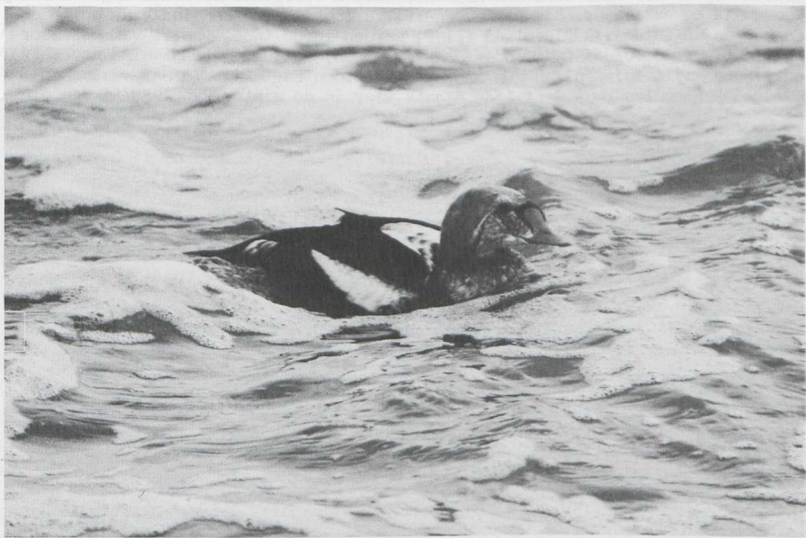
71. Koningseider/King Eider Somateria spectabilis , Texel (NH), december 1981