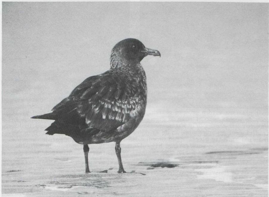
74-75. Grote Jager/Great Skua Stercorarius skua , eerste kalenderjaar, De Westplaat (ZH), december 1981 (René Pop); Papegaaiduiker/Puffin Fratercula arctica , De Maasvlakte (ZH), december 1981 (René Pop)