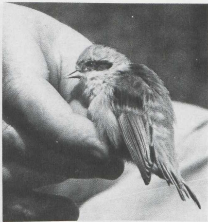
69-70. Kuhls Pijlstormvogel/Cory's Shearwater Calonectris diomedea , Noordwijk (ZH), november 1981; Buidelmees/Penduline Tit Remiz pendulinus , Makkum (F), september 1981