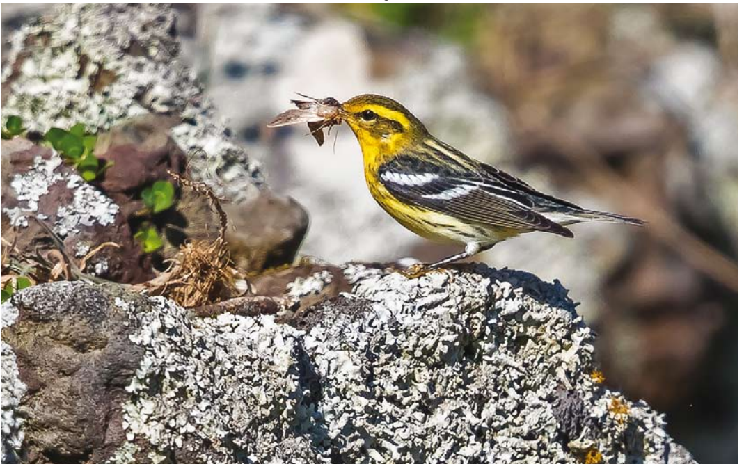
592 Blackburnian Warbler / Sparrenzanger Setophaga fusca , first-year male, Corvo, Azores, 15 October 2017