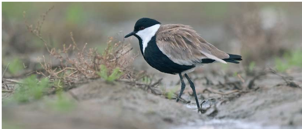
563 Spur-winged Lapwing / Sporenkievit Vanellus spinosus , adult, Strzelno, Kujawsko-Pomorskie, Poland, 25 September 2017

A adalberti were seen at Point Cires, Tangier, crossing the Strait of Gibraltar to Morocco. C 1500 Steppe Eagles A nipalensis at Raysut waste disposal site on 24 January was the highest-ever number for Oman. The second Eastern Imperial Eagle A heliaca for the Netherlands was a fourth calendar-year photographed at Brobbelbies, Schaijk, Noord-Brabant, on 27 September, and then turning up in north-western Overijssel and into Flevoland on 3-4 and 8-10 October (the first was in April 2005). It had been ringed as a chick on the nest at Dévaványa, Békés, Hungary, on 18 June 2014. Surprisingly, based on feather details, it was identified as the same individual as the one in January at Lago di Massaciuccoli, Toscana, where it was erroneously considered to be the first Spanish Imperial Eagle for Italy, partly the result of its ring not read (cf Dutch Birding 39: 45, plate 54, 2017). In Scotland, an adult male Northern Harrier C hudsonius was reported at Rendall, Mainland, Orkney, on 13 October. The second Northern Goshawk Accipiter gentilis for the Faeroes stayed on Kunoy from 30 September to 3 October. A kite flying over Slikken van de Heen, Zeeland, Netherlands, on 10 October was identified as an 'intergrade' between Black Kite M migrans and Black-eared Kite M lineatus .