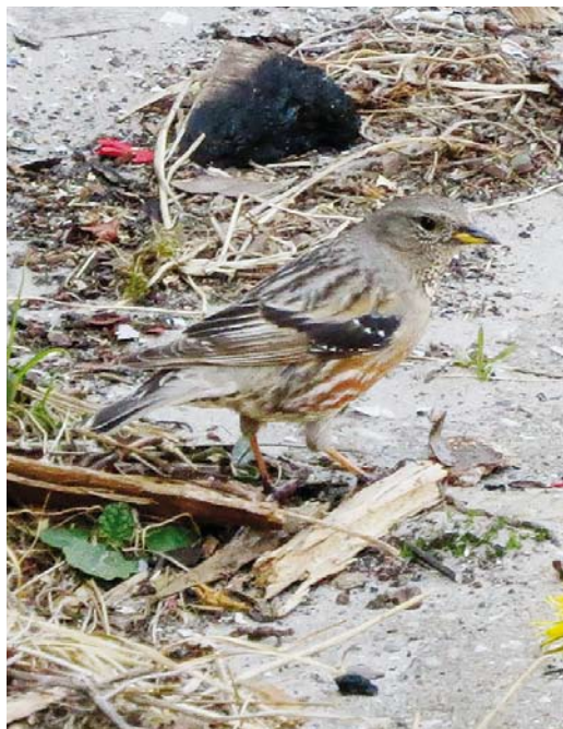
532 Alpine Accentor / Alpenheggenmus Prunella collaris , Vuurboetsduin, Vlieland, Friesland, 5 May 2016 (Carl Zuhorn)