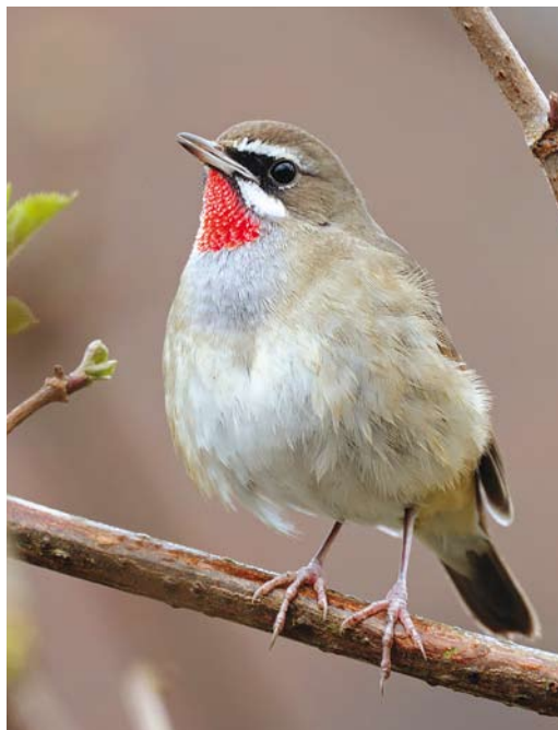
533 Siberian Rubythroat / Roodkeelnachtegaal Calliope calliope , first-winter male, Hoogwoud, Noord-Holland, 12 February 2016 (John van der Graaf)

24, plate 32-33, 26, plate 34-35, 27, figure 1, 28, plate 36-37, 2017).