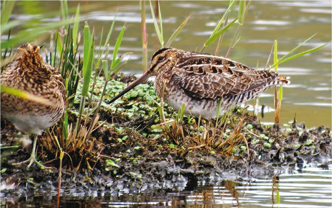
554 Wilson's Snipe / Amerikaanse Watersnip Gallinago delicata (right), St Mary's, Scilly, England, 11 October 2017 (Michael Schmitz)