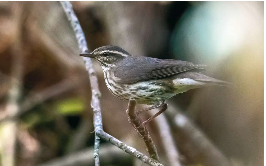
572 Northern Waterthrush / Noordse Waterlijster Parkesia noveboracensis , Corvo, Azores, 6 October 2017