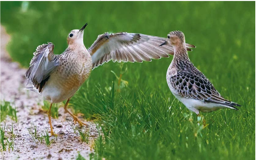
555 Buff-breasted Sandpipers / Blonde Ruiters Calidris subruficollis , juveniles, Ebro delta, Tarragona, Spain, 25 September 2017