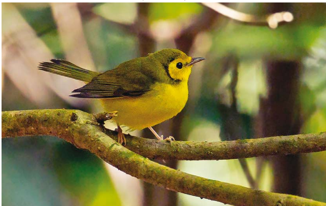
587 Hooded Warbler / Monnikszanger Setophaga citrina , first-year female, Corvo, Azores, 20 October 2017