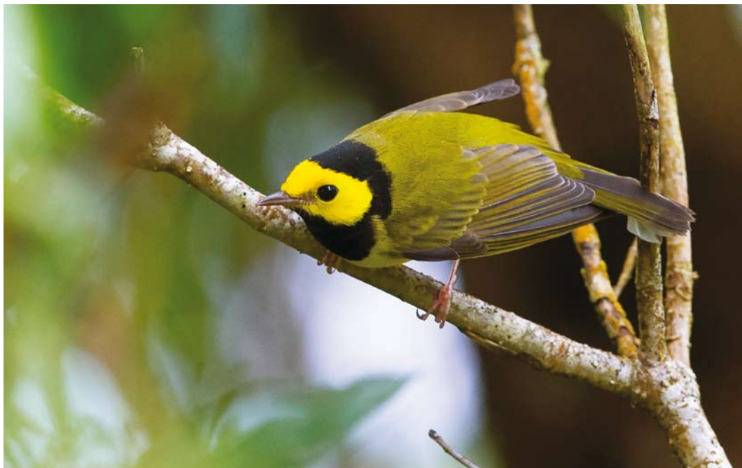
586 Hooded Warbler / Monnikszanger Setophaga citrina , first-year male, Corvo, Azores, 23 October 2017