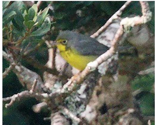
581 Black-throated Blue Warbler / Blauwe Zwartkeelzanger Setophaga caeruleascens , first-year male, Corvo, Azores, 1 October 2017 (Peter Stronach) 582 Black-throated Green Warbler / Gele Zwartkeelzanger Setophaga virens , first-year male, Corvo, Azores, 20 October 2017 (Kris De Rouck) 583 Yellow-throated Vireo / Geelborstvireo Vireo flavifrons , Corvo, Azores, 15 October 2017 (Radosław Gwóźdź) 584 Canada Warbler / Canadese Zanger Cardellina canadensis , first-year male, Corvo, Azores, 28 September 2017 (Peter Stronach)

one reported on Corvo on 23 October will be the third for the Azores. Six Bohemian Waxwings B garrulus photographed at Rualing, Lahaul, Himachal Pradesh, on 26 January concerned the second record for India; the previous one was on 8 March 1907 (Indian Birds 13: 133-135, 2017). If accepted, a Eurasian Nuthatch Sitta europaea at Belvoir Forest, Down, on 1 November will be the first for Northern Ireland (there are no records for Ireland). An adult Rosy Starling Pastor roseus near Pretoriuskop on 19 October was the second for South Africa and third for southern Africa. The first Nile Valley Sunbird Hedydipna metallica for Chad was seen at Ennedi on 15 October 2016.