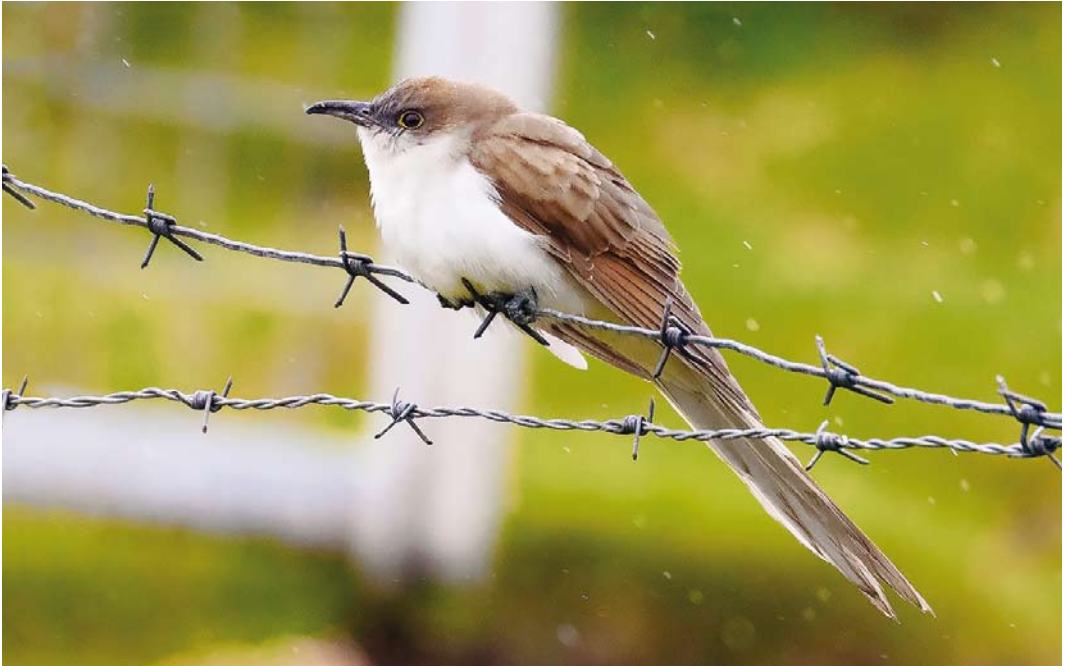
552 Black-billed Cuckoo / Zwartsnavelkoekoek Coccyzus erythrophthalmus , juvenile, Dale of Walls, Mainland, Shetland, Scotland, 18 September 2017 (Rory Tallack) cf Dutch Birding 39: 337, 2017