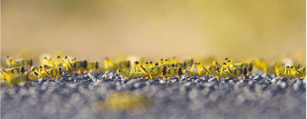
548 Desert Locusts / Woestijnsprinkhanen Schistocerca gregaria , bands, gregarious late instars, Aousserd road, Oued Al-Debeh, Western Sahara, Morocco, 20 April 2016