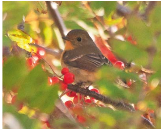
573 White-crowned Sparrow / Witkruingors Zonotrichia leucophrys , first-year, Foula, Shetland, Scotland, 8 October 2017 574 Yellow-breasted Bunting / Wilgengors Emberiza aureola , first-year, Out Skerries, Shetland, Scotland, 21 September 2017 cf Dutch Birding 39: 350, 2017 575 Brown Shrike / Bruine Klauwier Lanius cristatus , first-year, il-Maghluq, Marsaxlokk, Malta, 3 November 2017 576 Mugimaki Flycatcher / Mugimakivliegenvanger Ficedula mugimaki , first-winter female, Værøy, Nordland, Norway, 13 October 2017

CROWS TO SWALLOWS In the Canary Islands, two Pied Crows Corvus albus were still present at Las Palmas de Gran Canaria harbour on 25 October; the Spanish rarities committee treats all records in the Canary Islands, Ceuta and mainland Spain as probably ship-assisted (listing the species in so-called 'category D') despite the species' frequent occurrence in Morocco. The first or second Common Firecrest Regulus ignicapilla for the Faeroes was photographed at Sydrugøta, Eysturoy, on 24 October (cf Dutch Birding 38: 462, 2016). The fifth Greater Hoopoe-Lark Alaemon alaudipes for the Canary Islands was found on Gran Canaria on 29 October. In Israel, an amazing c 20 000 Greater Short-toed Larks Calandrella brachydactyla were estimated to gather for a roost at Judean plains on 23 September. A first-winter American Cliff Swallow Petrochelidon pyrrhonota on Tresco, Scilly, on 2-6 October was probably the same individual as the