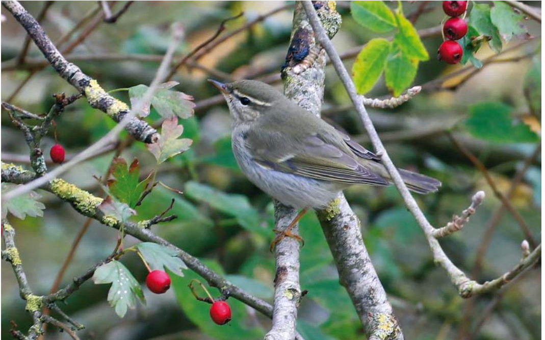
604 Noordse Boszanger / Arctic Warbler Phylloscopus borealis , camping Seedune, Schiermonnikoog, Friesland, 9 oktober 2017 (Bas van den Boogaard)