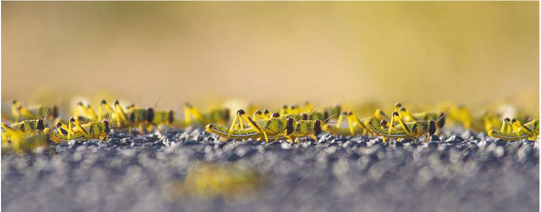
548 Desert Locusts / Woestijnsprinkhanen Schistocerca gregaria , bands, gregarious late instars, Aousserd road, Oued Al-Debeh, Western Sahara, Morocco, 20 April 2016