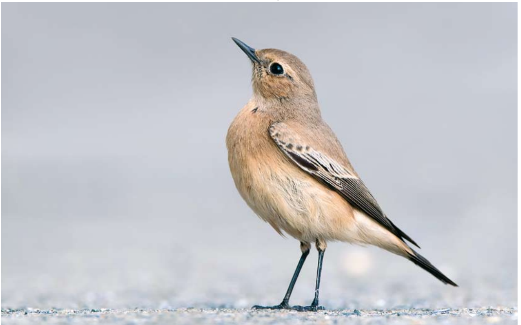
567 Desert Wheatear / Woestijntapuit Oenanthe deserti , first-year female, Zeebrugge, West-Vlaanderen, Belgium, 9 October 2017 (Filip De Ruwe)