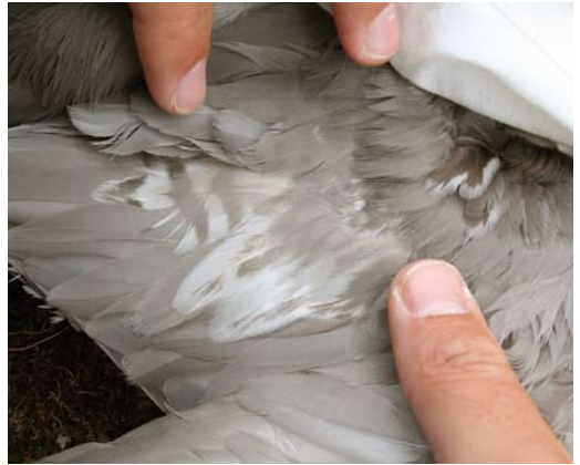
137 Long-tailed Jaeger / Kleinste Jäger Stercorarius longicaudus, adult, Björkfället, Ammarnäs, Västerbotten, Sweden, 20 June 2011. Same bird as plate 136 and 138-139. 138 Long-tailed Jaeger / Kleinste Jäger Stercorarius longicaudus, adult, Björkfället, Ammarnäs, Västerbotten, Sweden, 12 June 2010. Detail of right underwing. Same bird as plate 136-137 and 139. 139 Long-tailed Jaeger / Kleinste Jäger Stercorarius longicaudus, adult, Björkfället, Ammarnäs, Västerbotten, Sweden, 12 June 2010. Detail of left underwing. Same bird as plate 136-138.

Long-tailed and Parasitic. Hence, jaegers showing these features cannot be aged with any certainty.