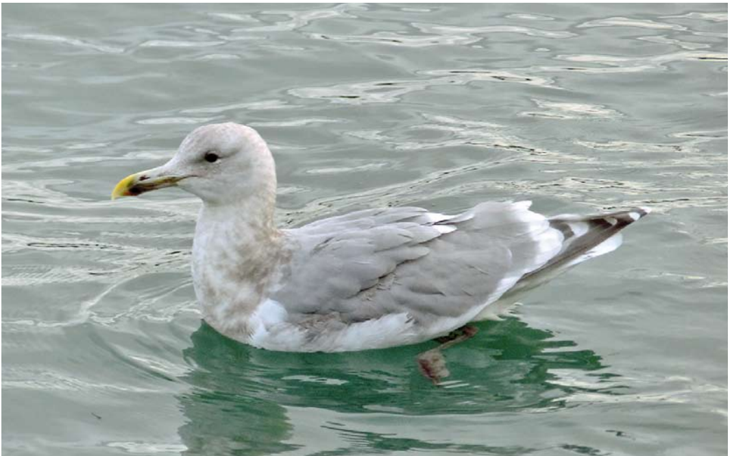
185 Glaucous-winged Gull / Beringmeeuw Larus glaucescens , subadult, Reykavík, Iceland, 19 February 2015