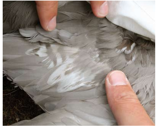
137 Long-tailed Jaeger / Kleinste Jäger Stercorarius longicaudus, adult, Björkfället, Ammarnäs, Västerbotten, Sweden, 20 June 2011. Same bird as plate 136 and 138-139. 138 Long-tailed Jaeger / Kleinste Jäger Stercorarius longicaudus, adult, Björkfället, Ammarnäs, Västerbotten, Sweden, 12 June 2010. Detail of right underwing. Same bird as plate 136-137 and 139. 139 Long-tailed Jaeger / Kleinste Jäger Stercorarius longicaudus, adult, Björkfället, Ammarnäs, Västerbotten, Sweden, 12 June 2010. Detail of left underwing. Same bird as plate 136-138.

Long-tailed and Parasitic. Hence, jaegers showing these features cannot be aged with any certainty.