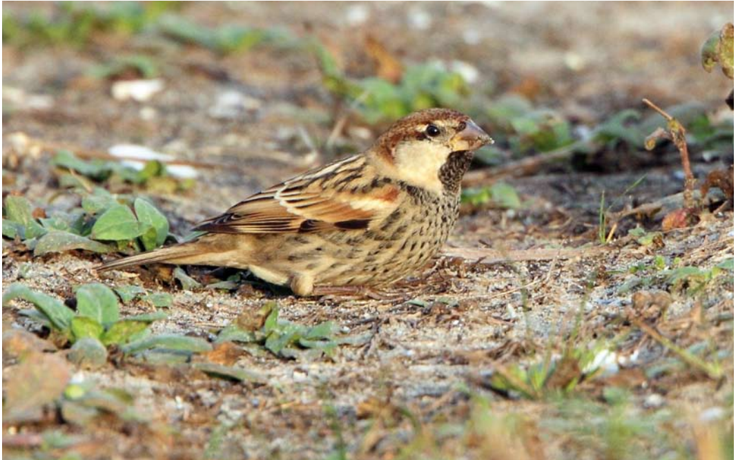
116-117 Spaanse Mus / Spanish Sparrow Passer hispaniolensis , mannetje, Maasvlakte, Zuid-Holland, 26 oktober 2014