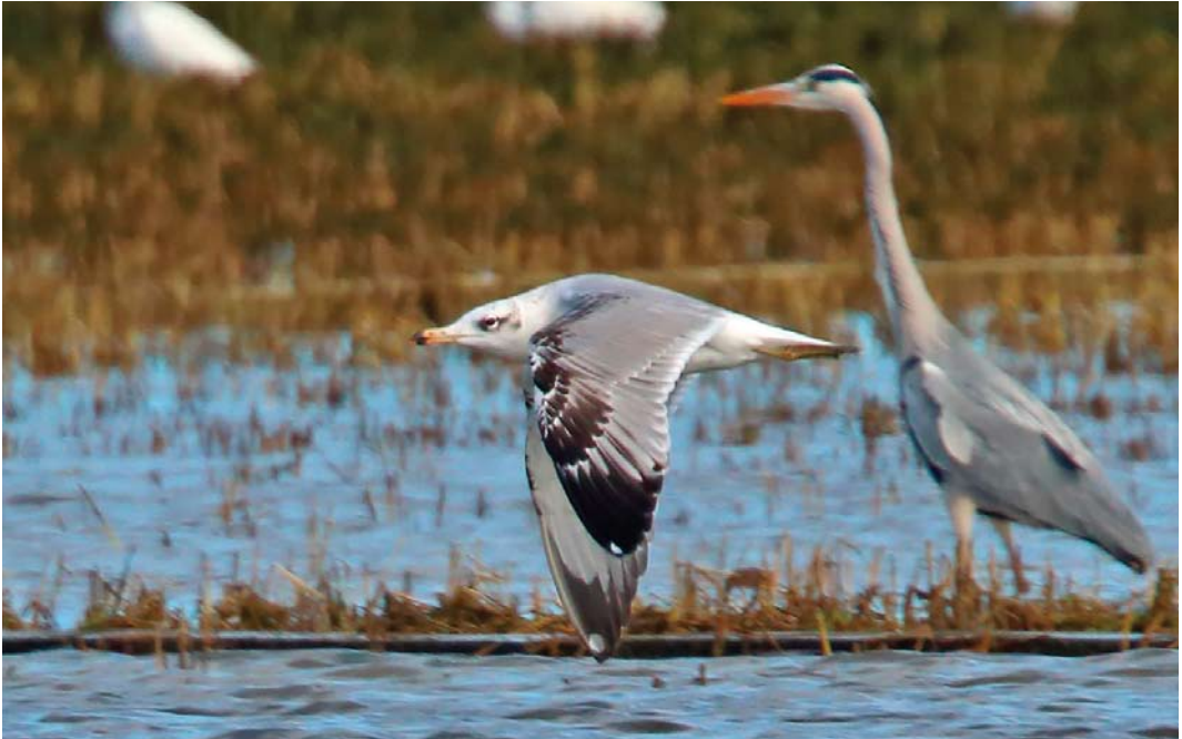
184 Pallas's Gull / Reuzenzwartkopmeeuw Larus ichthyaetus , third calendar-year, with Grey Heron / Blauwe Reiger Ardea cinerea , Parc natural de l'Albufera, València, Spain, 9 February 2015