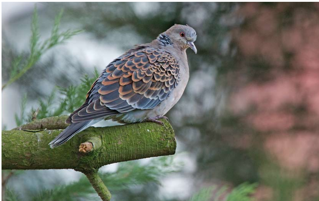
212 Oosterse Tortel / Oriental Turtle Dove Streptopelia orientalis , Vlaardingeng, Zuid-Holland, 31 januari 2015