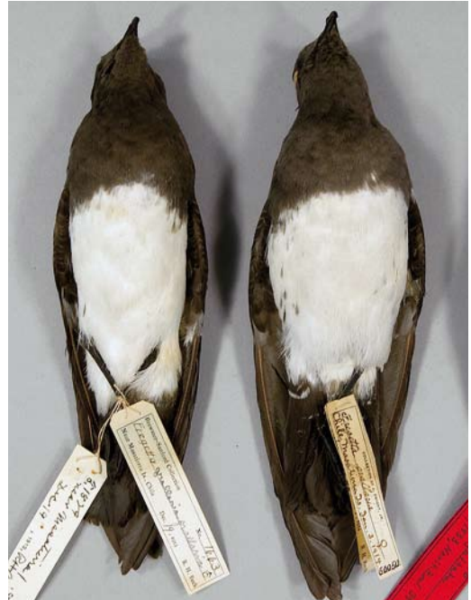
130 White-bellied Storm Petrels / Witbuikstormvogeltjes Fregatta grallaria segethi (collected off or on Robinson Crusoe, Chile, 3 January 1914 (right) and 19 December 1913), American Museum of Natural History, New York, USA, 25 October 2014. Note variation in flank streaking, corresponding to birds photographed at sea (cf plate 131-133).

A dark morph prominently occurs in the nominate subspecies F g gallaria (hereafter gallaria ) that breeds on Lord Howe Island, Australia (pers obs; Murphy & Snyder 1952, Serventy et al 1971, Van Tets & Fullagar 1984, Spear & Ainley 2007; plate 135). This morph was even described as a separate species by Mathews (1914) but soon after