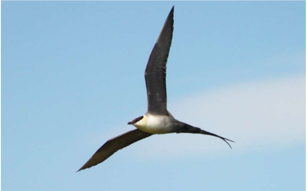
140 Long-tailed Jaeger / Kleinste Jager Stercorarius longicaudus , adult, Björkfället, Ammarnäs, Västerbotten, Sweden, 14 July 2014 ( Tim van der Meer ). Note presence of barred feathers on underwings.

the Western Palearctic 3. Oxford. Furness, R W 1987. The skuas. Calton. Howell, S N G 2007. A review of moult and ageing in jaegers (smaller skuas). Alula 13: 98-113. de Korte, J 1985. Ecology of the Long-tailed Skua ( Stercorarius longicaudus Vieillot, 1819) at Scoresby