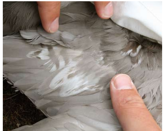
137 Long-tailed Jaeger / Kleinste Jäger Stercorarius longicaudus, adult, Björkfället, Ammarnäs, Västerbotten, Sweden, 20 June 2011. Same bird as plate 136 and 138-139. 138 Long-tailed Jaeger / Kleinste Jäger Stercorarius longicaudus, adult, Björkfället, Ammarnäs, Västerbotten, Sweden, 12 June 2010. Detail of right underwing. Same bird as plate 136-137 and 139. 139 Long-tailed Jaeger / Kleinste Jäger Stercorarius longicaudus, adult, Björkfället, Ammarnäs, Västerbotten, Sweden, 12 June 2010. Detail of left underwing. Same bird as plate 136-138.

Long-tailed and Parasitic. Hence, jaegers showing these features cannot be aged with any certainty.