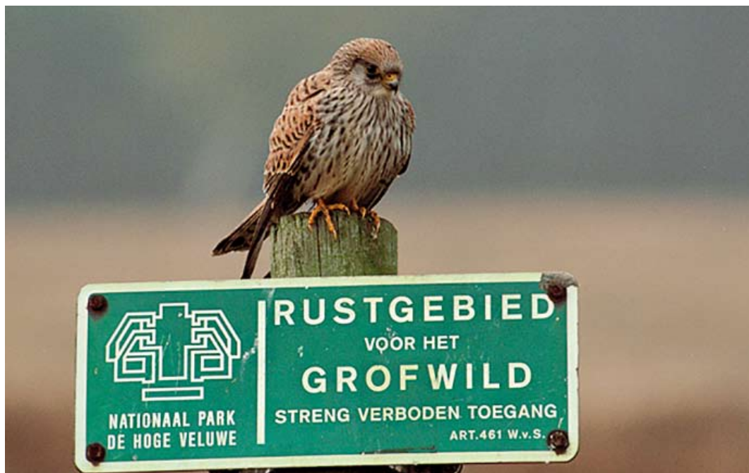
158 Kleine Torenvalk / Lesser Kestrel Falco naumanni , vrouwtje, De Hoge Veluwe, Gelderland, 23 maart 2002

kening op mantel, schouder, rug, stuit en kleine en middelste vleugeldekveren (alleen bruikbaar in vergelijking met nominaat Torenvalk F tinnunculus ), vorm van de streping van de borst (alleen bruikbaar als zekere juveniele exemplaren van beide soorten vergeleken worden), en (in zit) afstand tussen staartpunt en vleugelpunt. Deze verschillen tonen echter enige overlap tussen beide soorten. De afronding van de staart, bij volwassen mannetjes vaak een kenmerkend verschil (verschil tussen t1 en t6 relatief groot bij Kleine Torenvalk), geldt niet als determinatiekenmerk voor vrouwtjes omdat de overlap met Torenvalk aanzienlijk is (cf Clark 1996, Forsman 1999, Corso 2001, Ferguson-Lees & Christie 2001, van Duivendijk 2011; Nils van Duivendijk in litt). De lichte nagels zijn echter een uniek kenmerk voor Kleine in alle kleden en sluiten andere kleine valken uit en op basis hiervan is de vogel van De Hoge Veluwe als Kleine te determineren.