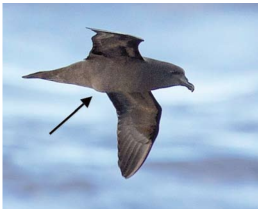
178 Mascarene Petrel / Réunionstormvogel Pseudobulweria aterrima , adult female, off Réunion, Indian Ocean, 22 December 2012. Note bulge from egg in uterus.

the weight of the adult female and it is known that Pterodroma species can have an egg 50% the length of the body. Once in the uterus, the egg of a petrel can be visible and its outline obvious when in the hand.