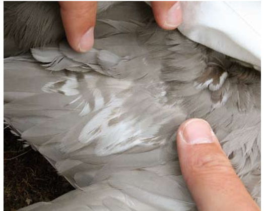
137 Long-tailed Jaeger / Kleinste Jäger Stercorarius longicaudus, adult, Björkfjället, Ammarnäs, Västerbotten, Sweden, 20 June 2011. Same bird as plate 136 and 138-139. 138 Long-tailed Jaeger / Kleinste Jäger Stercorarius longicaudus, adult, Björkfjället, Ammarnäs, Västerbotten, Sweden, 12 June 2010. Detail of right underwing. Same bird as plate 136-137 and 139. 139 Long-tailed Jaeger / Kleinste Jäger Stercorarius longicaudus, adult, Björkfjället, Ammarnäs, Västerbotten, Sweden, 12 June 2010. Detail of left underwing. Same bird as plate 136-138.

Long-tailed and Parasitic. Hence, jaegers showing these features cannot be aged with any certainty.