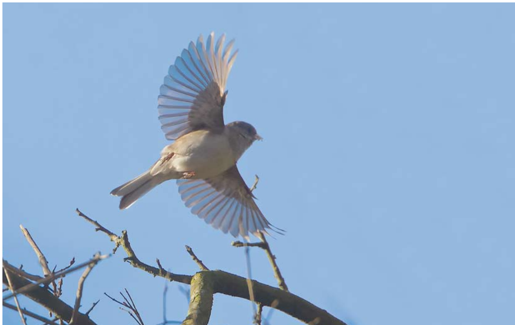
218 Grijs Junco / Dark-eyed Junco Junco hyemalis , eerste-winter, Beijum, Groningen, Groningen, 3 februari 2015 (Martin van der Schalk)

van deze soort zijn hoogst uitzonderlijk en voor zover bekend is dit het eerste januari-geval.