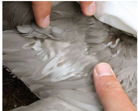
137 Long-tailed Jaeger / Kleinste Jäger Stercorarius longicaudus, adult, Björkfjället, Ammarnäs, Västerbotten, Sweden, 20 June 2011. Same bird as plate 136 and 138-139. 138 Long-tailed Jaeger / Kleinste Jäger Stercorarius longicaudus, adult, Björkfjället, Ammarnäs, Västerbotten, Sweden, 12 June 2010. Detail of right underwing. Same bird as plate 136-137 and 139. 139 Long-tailed Jaeger / Kleinste Jäger Stercorarius longicaudus, adult, Björkfjället, Ammarnäs, Västerbotten, Sweden, 12 June 2010. Detail of left underwing. Same bird as plate 136-138.

Long-tailed and Parasitic. Hence, jaegers showing these features cannot be aged with any certainty.