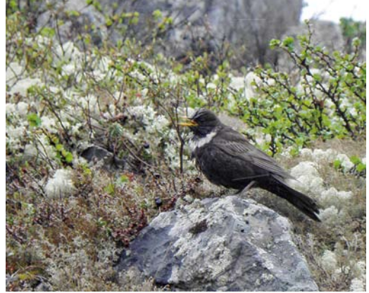
161 Ring Ouzel / Beflijster Turdus torquatus , adult female, Northern Timan mountains, Arkhangelsk region, Russia, 27 June 2014

There are no published avifaunistic studies of the area between the rivers Volonga and Indiga. Earlier researchers worked only further east, along the Indiga (Mineev & Mineev 2009), or west, on the lower western parts of Kanin Peninsula.