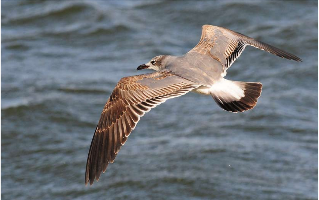
188 Laughing Gull / Lachmeeuw Larus atricilla , first-winter, New Brighton, Cheshire, England, 1 March 2015