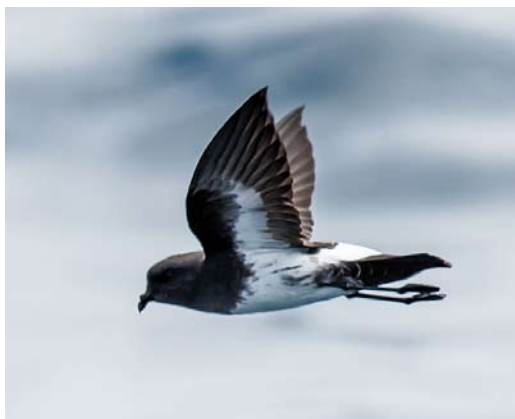
131-133 White-bellied Storm Petrel / Witbuikstormvogeltje Fregetta grallaria , off Robinson Crusoe, Chile, 21 February 2015. F. g. segethi of Juan Fernández archipelago also varies in dark streaking on flanks, a feature found in c 80% of birds, but with moderate to extensive streaking (plate 132-133) occurring in only c 15% of birds. All birds showed here are estimated to be of small type.

may have been a vagrant of the dark morph of grallaria from Lord Howe, considering its strong resemblance in plumage to the latter (cf plate 134-135) and which is the only subspecies for which a dark plumage has been documented. If so, the Masafuera bird originated from at least 10 500 km away (in a straight line from Lord Howe to Masafuera). More chumming sessions as well as night trapping on Masafuera are required to elucidate the status of this dark storm petrel.