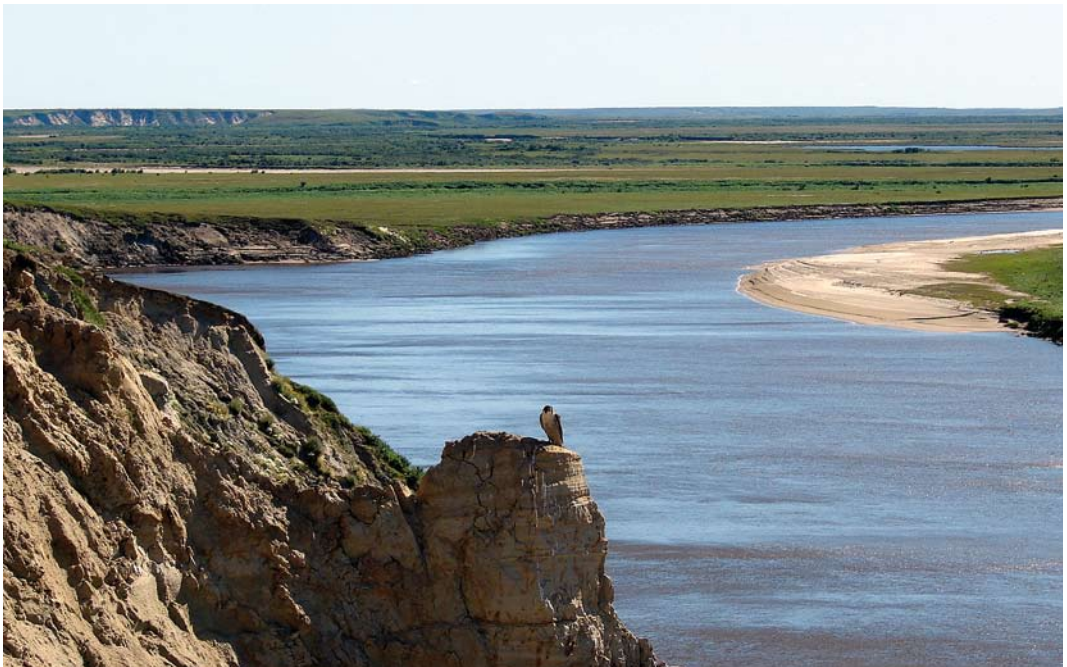
122 Tundra Peregrine Falcon / Toendraslechtvalk Falco peregrinus calidus , adult, Yamal peninsula, Siberia, Russia, 30 July 2008

Recent zijn Toendraslechtvalken ook met satellietzenders uitgerust en resultaten voor drie exemplaren uit verschillende delen van Siberië zijn weergegeven in figuur 1. Hieronder bevindt zich ook een vrouwtje dat