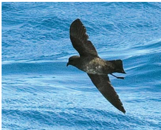
134 Storm petrel / stormvogeltje Fregetta , off Masafuera, Chile, 12 March 2013. Possible dark morph White-bellied Storm Petrel F. grallaria . This bird was not only dark plumaged, it was also clearly tiny in size and showing advanced moult, making it highly striking altogether.