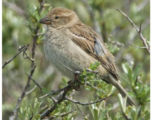
115 Spaanse Mus / Spanish Sparrow Passer hispaniolensis , vrouwtje, Zuidpier, IJmuiden, Noord-Holland, 6 mei 2010 (Jacob Garvelink)

Op zondagmiddag 26 oktober 2014 ontdekte Garry Bakker samen met Daniel Benders en Wil van den Hoven een mannetje Spaanse Mus in vers kleed ('winterkleed') langs de Missouriweg op de Maasvlakte. De vogel foerageerde in de wegberm met een aantal Vinken Fringilla coelebs . Tijdens de ontdekking zat de vogel in een hek met de borst naar de waarnemers toe en vielen de bruine kruin (zonder grijs) en zwarte tekening op borst en flanken op, wat GB direct de uitroep 'Spaanse Mus!' ontlokte. De vogel verdween snel uit beeld en