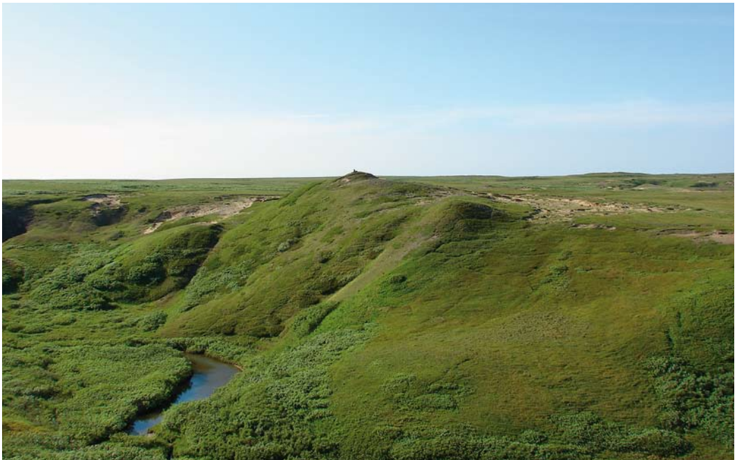
121 Breeding habitat of Tundra Peregrine Falcon Falco peregrinus calidus , Nenetsky Nature reserve, Nenets, Siberia, Russia, 7 July 2007

In Italy, calidus was considered a rare vagrant with no more than 10 records (Fasce & Fasce 1992) but more recently, Corso (2001) pointed out that the presence in Italy is overlooked because of the difficulty of identification. Contrary to historic statement, Corso (2001) considered calidus a regular winterer with an estimated population of 20-50 individuals (mostly juveniles) widespread in the southern part, mostly in Sicily and Puglia. Corso (2001) and Corso et al (2009) consider that calidus is also a regular passage migrant in Italy, occurring mostly along the Adriatic-Ionian migration flyway (coming from the east) with overshooting birds reaching the Tyrrhenian side of Italy. During the springs of 1997-2000, c 30 individuals were recorded in the Straits of Messina in April-May (Corso 2001, 2005), and 28 in 2006-08 during spring and autumn migration surveys at Pelagie Islands in the Sicilian Channel (Corso et al 2009). Besides, in 2009-11, one satellite-tagged female that wintered in Portugal (figure 1) passed through Italy on autumn and spring migration each year (except in spring 2011 when it passed north of Italy). The first