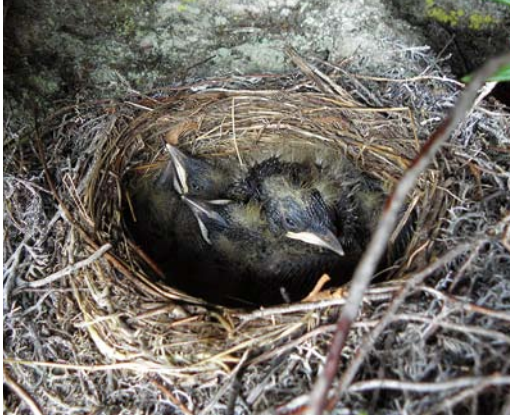
160 Ring Ouzels / Beflijsters Turdus torquatus , Northern Timan mountains, Arkhangelsk region, Russia, 27 June 2014. Nest with pulli.