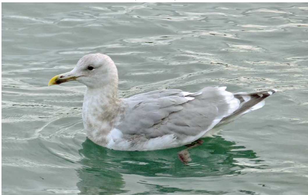
185 Glaucous-winged Gull / Beringmeeuw Larus glaucescens , subadult, Reykavík, Iceland, 19 February 2015