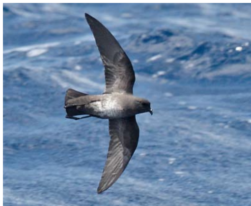
135 White-bellied Storm Petrel / Witbuikstormvogeltje Fregetta grallaria grallaria , dark morph, Lord Howe, Australia, 5 December 2009

Hartert, E 1926. Types of birds in the Tring museum. Novit Zool 33: 344-357.