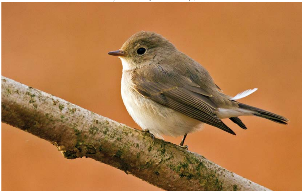
213 Kleine Vliegenvanger / Red-breasted Flycatcher Ficedula parva , Tenkinkbos, Winterswijk, Gelderland, 6 januari 2015 (Jurriën van Deijk)