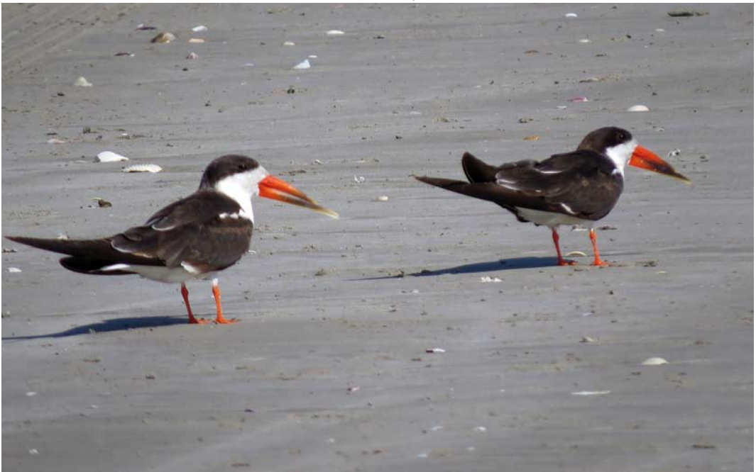
189 African Skimmers / Afrikaanse Schaarbekken Rhynchops flavirostris , Taqah, Salalah, Oman, 27 January 2015 (Robert Tovey)