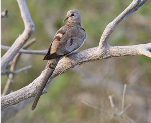
157 Namaqua Dove / Maskerduif Oena capensis , female near nest, Wadi Lahami mangrove forest, Red Sea, Egypt, 12 July 2013 ( Jens Hering )