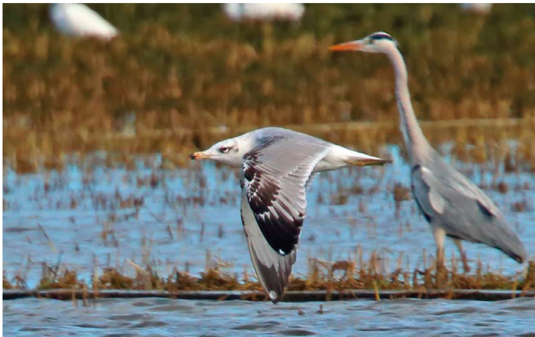
184 Pallas's Gull / Reuzenzwartkopmeeuw Larus ichthyaetus , third calendar-year, with Grey Heron / Blauwe Reiger Ardea cinerea , Parc natural de l'Albufera, València, Spain, 9 February 2015