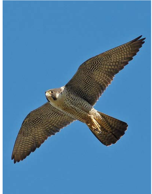
123 Tundra Peregrine Falcon / Toendraslechtvalk Falco peregrinus calidus , adult, Yamal peninsula, Siberia, Russia, 5 August 2008