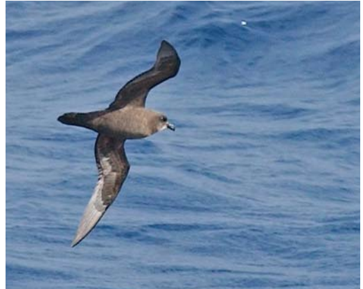
170-171 Mascarene Petrel / Réunionstormvogel Pseudobulweria aterrima , off Réunion, Indian Ocean, 22 December 2012 (Hadoram Shirihai/©Tubenoses Project) 172 Great-winged Petrel / Langvleugelstormvogel Pterodroma macroptera , off Durban, South Africa, 22 November 2013 (Hadoram Shirihai/©Tubenoses Project). On first appearance, practically identical to Mascarene Petrel Pseudobulweria aterrima (cf plate 170) but see main text. 173 Great-winged Petrel / Langvleugelstormvogel Pterodroma macroptera , off Crozet Islands, 25 March 2004 (Hadoram Shirihai/©Tubenoses Project)

at sea (eg, Attié et al 1997), none documented plumage, behaviour and other aspects in detail. There were some putative photographs but we have now shown these to be of birds incorrectly identified. Therefore, the accompanying plates are the first photographs taken of the species at sea.