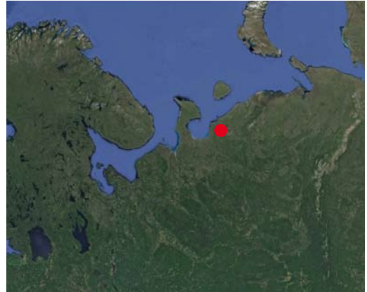
FIGURE 1 Location of survey camp at upper river Bolshaya Svetlaya, Russia (67.2058°N, 49.1055°E)

The survey camp was located at the upper river Bolshaya Svetlaya (67.2058°N, 49.1055°E; figure 1). From this location, several radial and two large circular routes were made. These routes covered upstreams of the rivers Bolshaya Svetlaya, Belyi Kechvozh, Volonga and Belaya. Also two rivers with the same name 'Kumushka' were investigated. One of them flows into the river Volonga, the second into the river Belaya. The survey area concerns southern tundra with the border between tundra and forest tundra being nearby, along the Volonga.