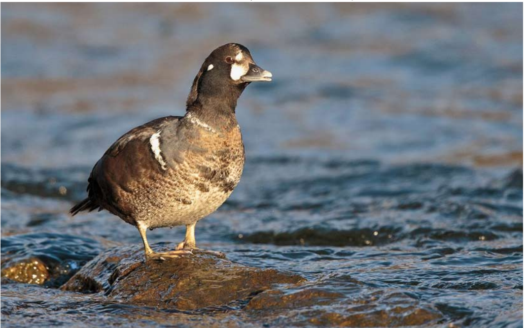
187 Harlequin Duck / Harlekijneend Histrionicus histrionicus , first-winter male, Donmouth, Aberdeenshire, Scotland, 5 February 2015