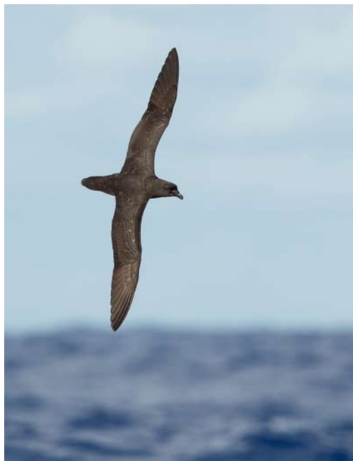
167-168 Mascarene Petrel / Réunionstormvogel Pseudobulweria aterrima , off Réunion, Indian Ocean, 22 December 2012 ( Hadoram Shirihai/©Tubenoses Project ) 169 Mascarene Petrel / Réunionstormvogel Pseudobulweria aterrima , off Réunion, Indian Ocean, 22 December 2012 ( Hadoram Shirihai/©Tubenoses Project ). Note visible bulge from egg in uterus (cf plate 178).