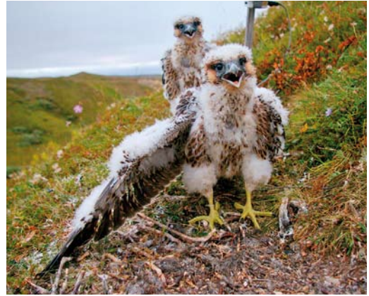
120 Tundra Peregrine Falcons / Toendraslechtvalken Falco peregrinus calidus , Nenetsky Nature reserve, Nenets, Siberia, Russia, 3 August 2011. Two fledglings before being ringed; one of these birds was found injured near Nuoro, Sardinia, Italy, on c 20 November 2011.

southern Asia and Africa (Cramp & Simmons 1980). The presence of calidus in western Europe may be overlooked (Millington 2011). Some calidus cross the Mediterranean and reach Africa to winter in East Africa from Ethiopia and Sudan to South Africa; it seems likely that also birds wintering in Angola, Cameroon, Guinea, Nigeria and Senegal from November to mid-March belong to calidus (Glutz von Blotzheim et al 1971, Cramp & Simmons 1980). Departures from winter territories start at the end of March or in early April and the breeding sites are reoccupied in May (Glutz von Blotzheim et al 1971, Cramp & Simmons 1980).