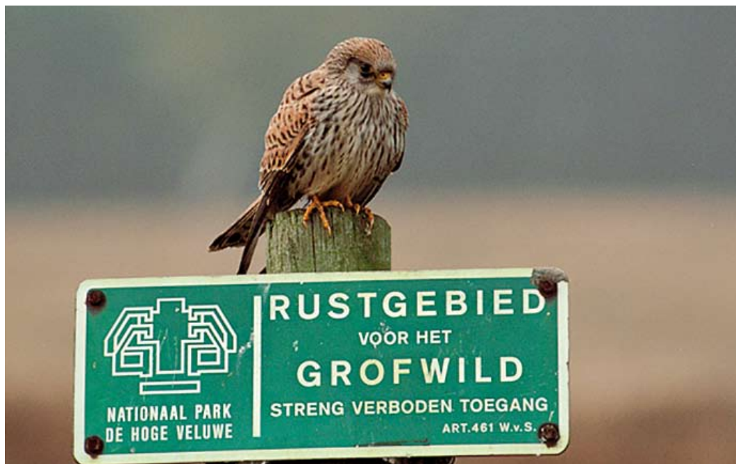
158 Kleine Torenvalk / Lesser Kestrel Falco naumanni , vrouwtje, De Hoge Veluwe, Gelderland, 23 maart 2002 (Wim Wilders)

kening op mantel, schouder, rug, stuit en kleine en middelste vleugeldekveren (alleen bruikbaar in vergelijking met nominaat Torenvalk F tinnunculus ), vorm van de streping van de borst (alleen bruikbaar als zekere juveniele exemplaren van beide soorten vergeleken worden), en (in zit) afstand tussen staartpunt en vleugelpunt. Deze verschillen tonen echter enige overlap tussen beide soorten. De afronding van de staart, bij volwassen mannetjes vaak een kenmerkend verschil (verschil tussen t1 en t6 relatief groot bij Kleine Torenvalk), geldt niet als determinatiekenmerk voor vrouwtjes omdat de overlap met Torenvalk aanzienlijk is (cf Clark 1996, Forsman 1999, Corso 2001, Ferguson-Lees & Christie 2001, van Duivendijk 2011; Nils van Duivendijk in litt). De lichte nagels zijn echter een uniek kenmerk voor Kleine in alle kleden en sluiten andere kleine valken uit en op basis hiervan is de vogel van De Hoge Veluwe als Kleine te determineren.