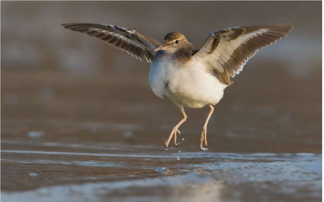
202 Amerikaanse Oeverloper / Spotted Sandpiper Actitis macularius , eerste-winter, Medemblik, Noord-Holland, 15 februari 2015 ( Jaap Denee )