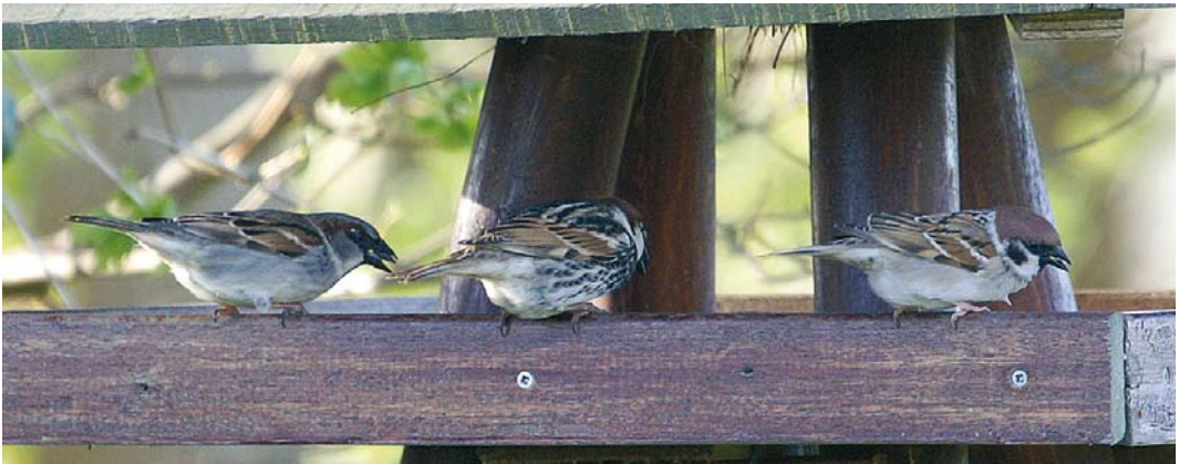
110-111 Spaanse Mus / Spanish Sparrow Passer hispaniolensis , adult mannetje, Den Hoorn, Texel, Noord-Holland, 18 april 2009 (Adriaan Dijkse) 112 Spaanse Mus / Spanish Sparrow Passer hispaniolensis , adult mannetje, met mannetje Huisemus P. domesticus (links) en Ringmus P. montanus (rechts), Den Hoorn, Texel, Noord-Holland, 18 april 2009 (Adriaan Dijkse)