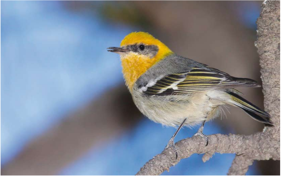
179-180 Olive Warbler / Oranjekopzanger Peucedramus taeniatus , male, Cochise County, Arizona, USA, 23 April 2009