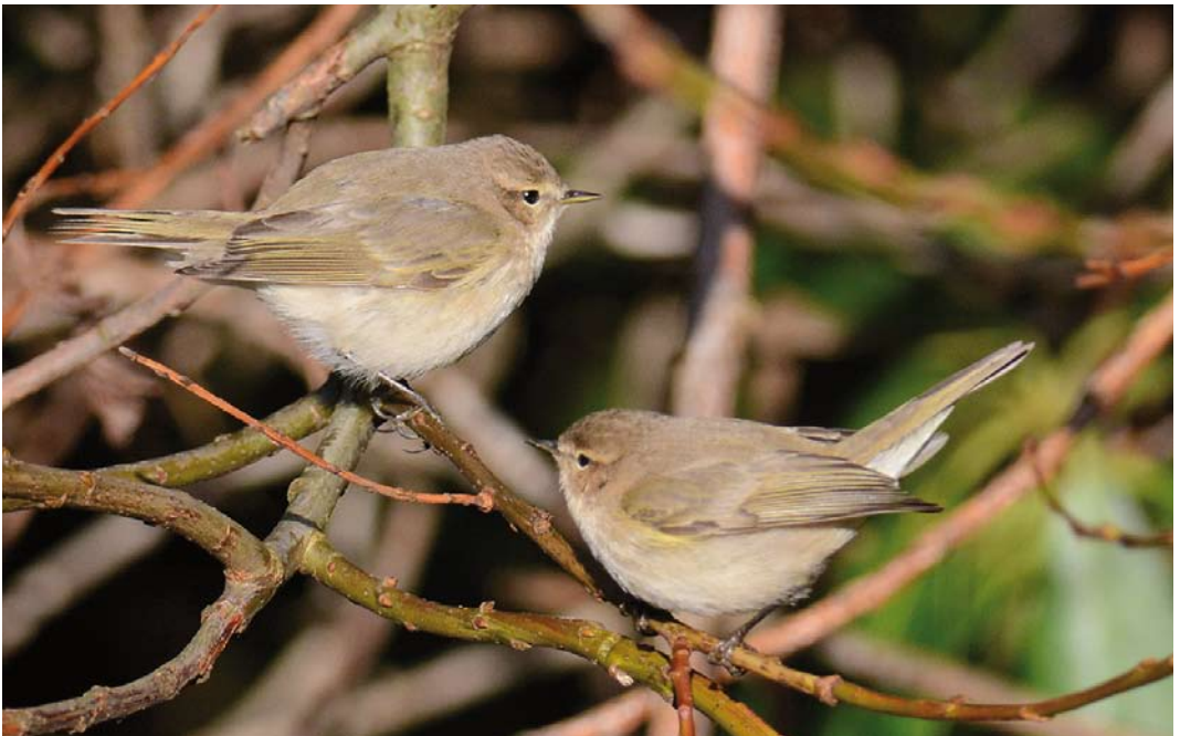
217 Siberische Tjiftjaffen / Siberian Chiffchaffs Phylloscopus tristis , Weesp, Noord-Holland, 16 januari 2015