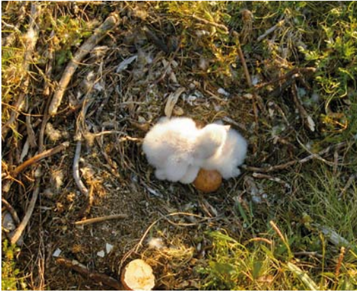
119 Nest of Tundra Peregrine Falcon Falco peregrinus calidus , Nenetsky Nature reserve, Nenets, Siberia, Russia, 9 July 2011. Nest with one pullet hatching; one young from this nest was found injured near Nuoro, Sardinia, Italy, on c 20 November 2011.