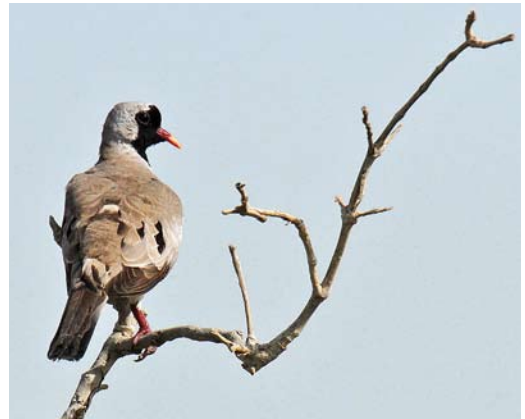
153-154 Nest with brood (arrow) of Namaqua Dove Oena capensis , southern edge of Wadi Lahami mangrove forest, Red Sea, Egypt, 12 July 2013 (Jens Hering) 155 Namaqua Dove / Maskerduif Oena capensis , breeding female, Wadi Lahami mangrove forest, Red Sea, Egypt, 12 July 2013 (Jens Hering) 156 Namaqua Dove / Maskerduif Oena capensis , male near nest, Wadi Lahami mangrove forest, Red Sea, Egypt, 8 July 2013 (Jens Hering)

other pair was searching on the dry ground for sowing seed. When we controlled the nest on 15 July, it was empty. An eggshell, probably eaten by a mouse, was lying on the ground.