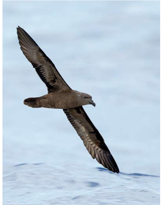
163-166 Mascarene Petrel / Réunionstormvogel Pseudobulweria aterrima , off Réunion, Indian Ocean, 18 December 2012