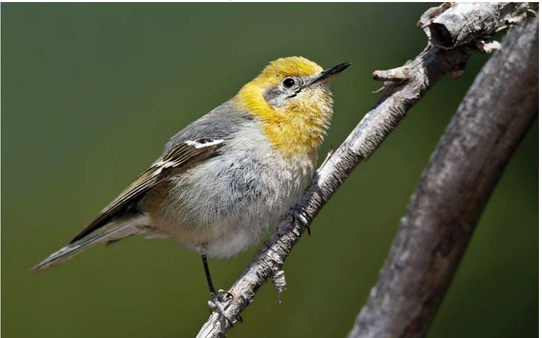
182 Olive Warbler / Oranjekopzanger Peucedramus taeniatus , first-summer male, Cochise County, Arizona, USA, 2 May 2011