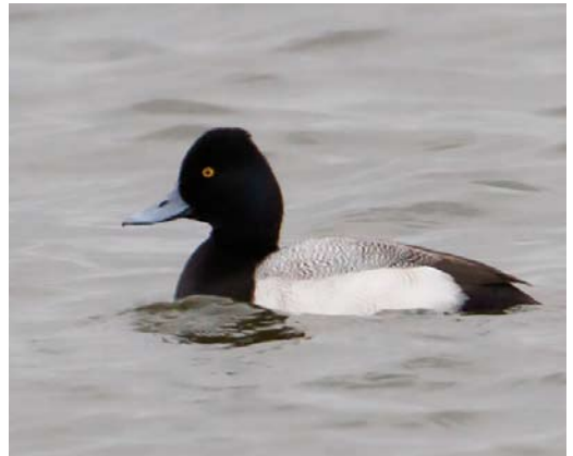
204-205 Kleine Trap / Little Bustard Tetrax tetrax , eerste-winter, Polder Arkemheen, Nijkerk, Gelderland, 27 januari 2015 (Jaap Denee) 206 Kleine Burgemeester / Iceland Gull Larus glaucoides , eerste-winter, Amsterdam, Noord-Holland, 6 januari 2015 (Rob Halff) 207 Kleine Topper / Lesser Scaup Aythya affinis , mannetje, Lorentzhaven, Harderwijk, Gelderland, 28 januari 2015 (Jaap Denee)

Limburg. Er werden c 12 Witoogeenden Aythya nyroca doorgegeven. Een vogel op 23 januari bij Ouderkerk aan de Amstel, Noord-Holland, droeg een gele kleuring en was vermoedelijk afkomstig uit een introductieproject in Niedersachsen, Duitsland. Een mannetje Ringsnaveleend A collaris bevond zich van 31 januari tot in maart in de Vlietlanden bij Vlaardingen, Zuid-Holland; mogelijk betrof het dezelfde vogel als in maart 2014. Op 8 februari maakte hij een uitstapje naar de Nieuwe Maas bij Vlaardingen. Mannetjes Kleine Topper A affinis werden gemeld tot 27 februari op het Veluwemeer bij Biddinghuizen, Flevoland; van 3 tot 26 januari onregelmatig een tweede op diezelfde locatie; van 27 tot 30 januari op het Veluwemeer bij Harderwijk (Lorentzhaven), Gelderland; op 31 januari en 1 februari op de Dijkwielen in de Wieringermeer, Noord-Holland; en van 20 tot 22 februari bij Medemblik, Noord-Holland; de laatste vogel liet zich matig documenteren en was daarom niet geheel zeker. Een mannetje Zomertaling Anas querquedula vanaf