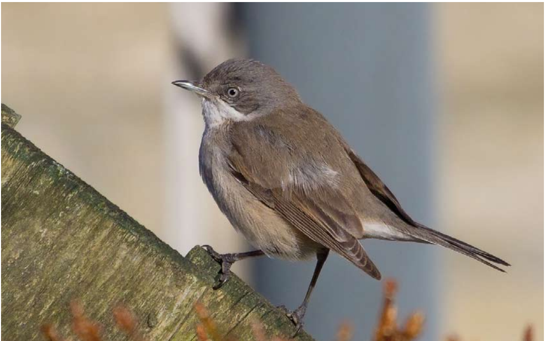
215 Humes Braamsluiper / Hume's Lesser Whitethroat Sylvia althaea blythi/halimodendri , Callantsoog, Noord-Holland, 17 februari 2015