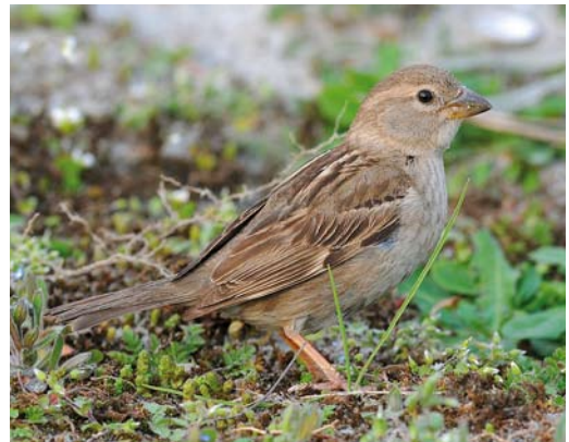
107 Spaanse Mussen / Spanish Sparrows Passer hispaniolensis , mannetje (rechts) en vrouwtje, Eemshaven, Groningen, 12 april 2009 (Roef Mulder) 108-109 Spaanse Mus / Spanish Sparrow Passer hispaniolensis , vrouwtje, Eemshaven, Groningen, 12 april 2009 (Roef Mulder). Verschillende exemplaren.

De vogels verdwenen snel uit beeld. Na 10 min waren ze er weer en toen ze vlak bij zijn auto waren kon hij redelijke foto's maken van twee mannetjes; GJV dacht eerst dat het Italiaanse Mussen P italiae waren maar later op de avond concludeerde hij aan de hand van de ANWB-vogelgids (Svensson et al 2002) dat het Spaanse Mussen betrof. Hij telde in totaal 14 mussen, waarvan vier mannetjes Spaanse, maar kon niet beoordelen of de vrouwtjes Huiswassen waren of Spaanse. GJV ging naar zijn vogelvriend Erik Pomp om de foto's te checken en ze meldden de waarneming op www.waarneming.nl . Na aanvankelijk ongeloof bij veel vogelaars vanwege het hoge aantal bleken de foto's overtuigend en de volgende ochtend vond Rommert Cazemier de mussen al vroeg terug. Ze trokken veel bekijks tot 12 april; in de loop van die dag nam het aantal geleidelijk af en op 13 april waren ze allemaal verdwenen. Er werden