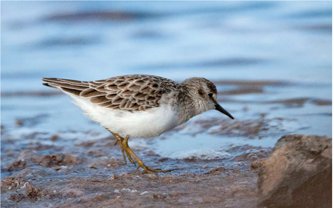
186 Least Sandpiper / Kleinste Strandloper Calidris minutilla , Santa Maria, Sal, Cape Verde Islands, 21 January 2015