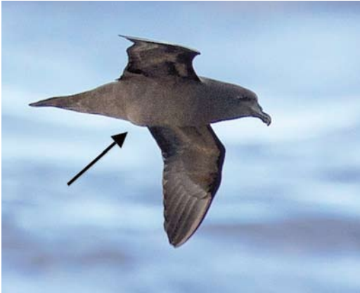
178 Mascarene Petrel / Réunionstormvogel Pseudobulweria aterrima , adult female, off Réunion, Indian Ocean, 22 December 2012. Note bulge from egg in uterus.

the weight of the adult female and it is known that Pterodroma species can have an egg 50% the length of the body. Once in the uterus, the egg of a petrel can be visible and its outline obvious when in the hand.