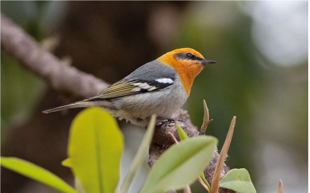
181 Olive Warbler / Oranjekopzanger Peucedramus taeniatus , male, Upper Durango Highway, Sinaloa, Mexico, 14 March 2010 ( Ron Knight )