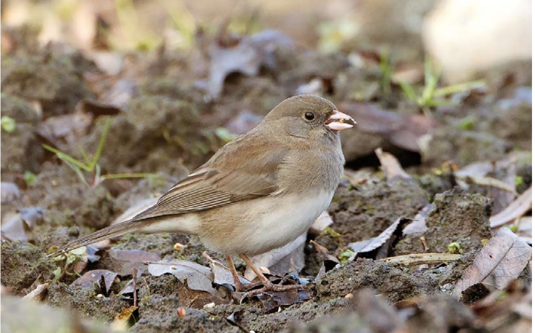
220 Grijs Junco / Dark-eyed Junco Junco hyemalis , eerste-winter, Beijum, Groningen, Groningen, 16 februari 2015 (Co van der Wardt)

laars snel groeide begon langzaam de impact van deze vondst tot me door te dringen: ruim 10 jaar na de twee Haakbekken Pinicola enucleator (november 2004) vond ik opnieuw een extreme dwaalgast vlak bij huis! Tot iets na 16:00 liet de junco zich zien, vaak kort en op afstand in de volkstuintjes maar voor iedereen goed herkenbaar. De volgende dag werd hij al vroeg teruggevonden en vanaf die dag vrijwel dagelijks gezien door aanvankelijk 100en en later 10-tallen of enkele vogelaars per dag. Ook vanuit andere Europese landen, waaronder Finland, Polen en Tsjechië, werd de vogel getwicht. Zoals meestal met dwaalgasten in woonwijken was er ruime aandacht in de pers, zowel op televisie als op diverse websites en in de dagbladen. Op 14 februari hoorde ik de vogel voor het eerst wat zangachtige geluiden maken en ook daarna werden regelmatig zachte trillers en gekwetter gehoord. Tot ten minste 29 maart bleef hij aanwezig. Op basis van kleeckenmerken betrof het een eerste-winter, en zeer waarschijnlijk een vrouwtje (van vrouwtjes is bekend dat ze een zachte en gevarieerde zang kunnen laten horen).