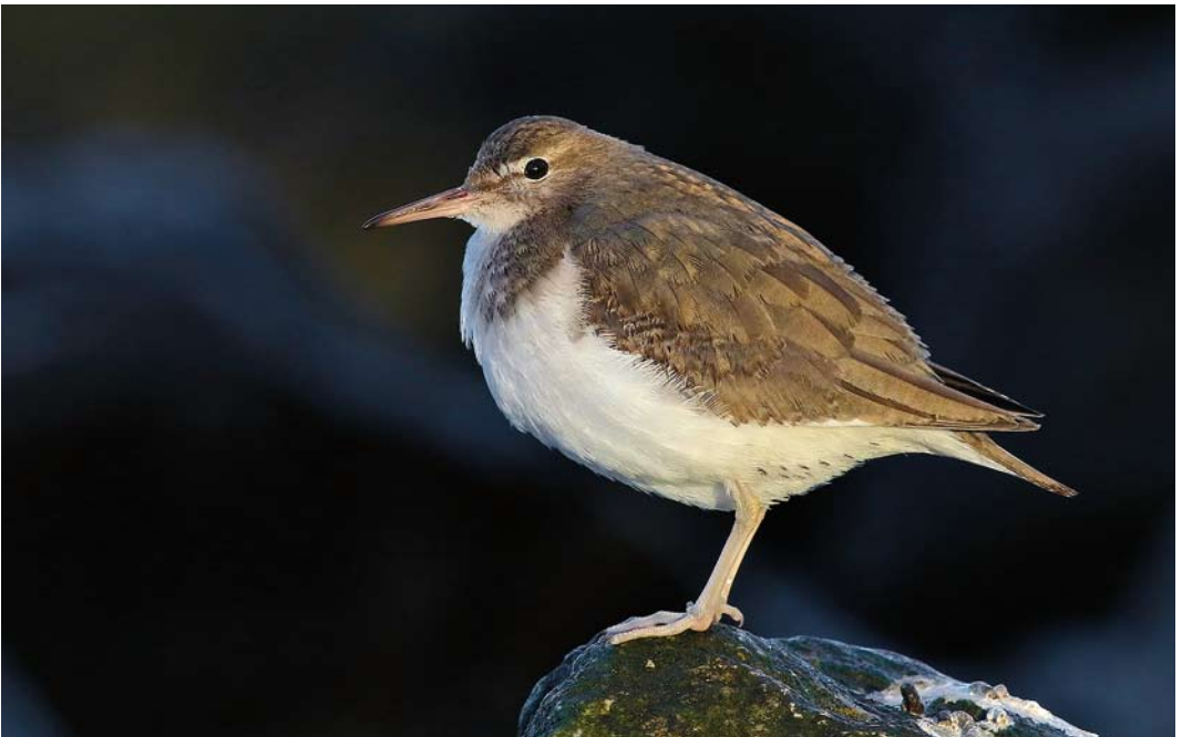
203 Amerikaanse Oeverloper / Spotted Sandpiper Actitis macularius , eerste-winter, Medemblik, Noord-Holland, 8 februari 2015