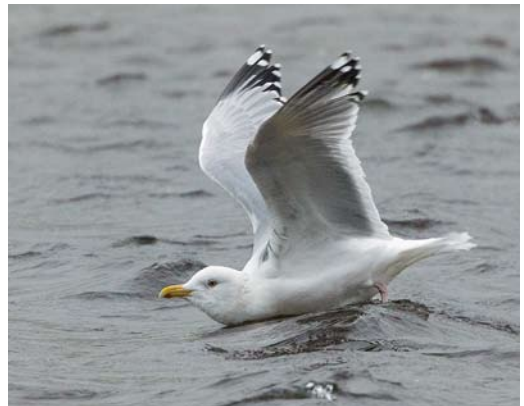
190 Smithsonian Gull / Amerikaanse Zilvermeeuw Larus smithsonianus , adult, Lires, A Coruña, Spain, 5 February 2015 ( Martin Gottschling ) 191 Kumlien's Gull / Kumliens Meeuw Larus glaucooides kumlieni , first-winter, Aveiro, Portugal, 7 March 2015 ( David Monticelli ) 192 Bonaparte's Gull / Kleine Kokmeeuw Chroicocephalus philadelphia , adult winter, Cariño, A Coruña, Spain, 3 February 2015 ( Martin Gottschling ) 193 Smithsonian Gull / Amerikaanse Zilvermeeuw Larus smithsonianus , adult, Lires, A Coruña, Spain, 1 March 2015 ( David Monticelli )

WADERS In the Azores, up to seven (on 1 February) Semipalmated Plovers Charadrius semipalmatus were present at Cabo da Praia, Terceira, from late January to at least 16 February. In the Cape Verde Islands, single Least Sandpipers Calidris minutilla were photographed on Sal on 21 January and on Boa Vista on 11 February. The Spotted Sandpiper Actitis macularius at Hamrarna, Fårabäck, Skåne, from 25 November 2014 to at least 9 February was the eighth for Sweden. The fourth for the Netherlands was present at Medemblik, Noord-Holland, from 19 January into March. In the Azores, one was seen on Pico on 22 February. Also in the Azores, up to two Hudsonian Whimbrels Numenius hudsonicus and a first-winter Short-billed Dowitcher Limnodromus griseus stayed at Cabo da Praia until at least 17 March and three Wilson's Snipes Gallinago delicata were seen at Lagoa do Ginjal, Santa Maria, on 11 February.