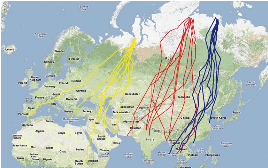
FIGURE 1 Autumn migration pathways of Tundra Peregrine Falcons Falco peregrinus calidus breeding in Russian tundra and fitted with satellite transmitter (PTT). Yellow: birds from Yamal peninsula; red: birds from eastern Taimyr; blue: birds from Lena delta (after Dixon et al 2012).

location data we had for this bird in Italy was on 21 October 2009 when the bird spent the night in Veneto; during this autumn migration its last location in Italy was in Liguria on 25 October 2009 and it was located on the coast of southern France the following day (Andrew Dixon pers comm).