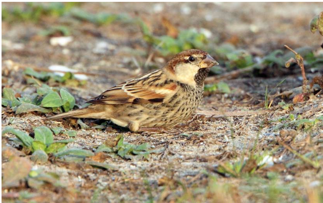
116-117 Spaanse Mus / Spanish Sparrow Passer hispaniolensis , mannetje, Maasvlakte, Zuid-Holland, 26 oktober 2014 (Michel Veldt)