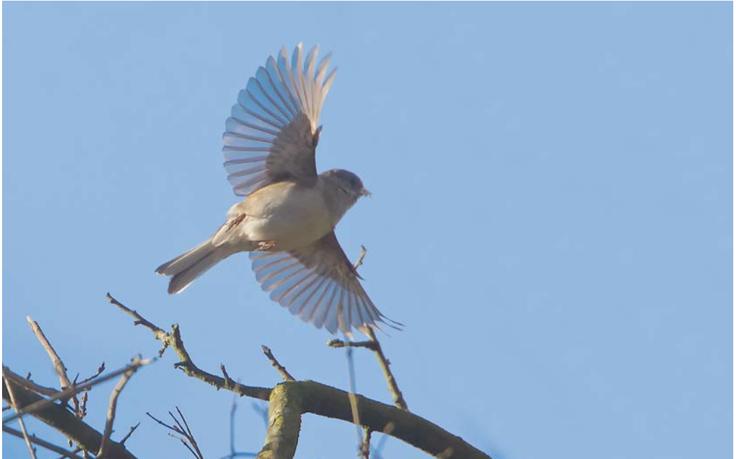
218 Grijs Junco / Dark-eyed Junco Junco hyemalis , eerste-winter, Beijum, Groningen, Groningen, 3 februari 2015

van deze soort zijn hoogst uitzonderlijk en voor zover bekend is dit het eerste januari-geval.