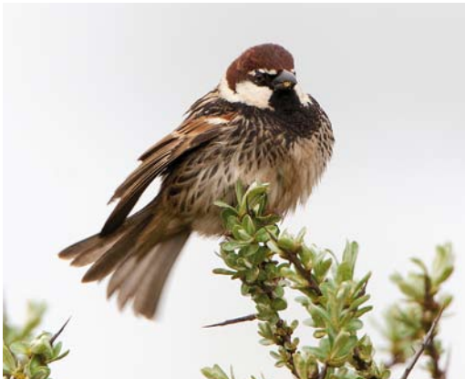
113-114 Spaanse Mus / Spanish Sparrow Passer hispaniolensis , adult mannetje, Maasvlakte, Zuid-Holland, 21 april 2009 (Michel Veldt)

KOP Voorhoofd, kruin, achterhoofd, nek en achterrand van wang donker kastanjebruin, meest donker op voorhoofd. Teugel zwart en klein masker vormend, onder