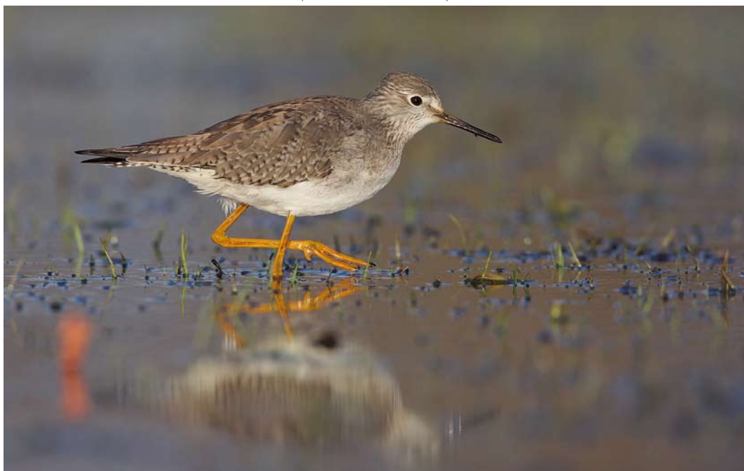
201 Kleine Geelpootruiter / Lesser Yellowlegs Tringa flavipes , adult-winter, Schokland, Flevoland, 27 februari 2015