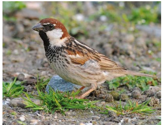
103 Spaanse Mussen / Spanish Sparrows Passer hispaniolensis , drie mannetjes en zes vrouwtjes, Eemshaven, Groningen, 9 april 2009 (Gert-Jan Versteeg) 104 Spaanse Mussen / Spanish Sparrows Passer hispaniolensis , twee mannetjes en drie vrouwtjes, Eemshaven, Groningen, 10 april 2009 (Guido Meeuwissen). Vrouwtje rechts met opvallende donkere borsttekening. 105 Spaanse Mussen / Spanish Sparrows Passer hispaniolensis , drie mannetjes en vijf vrouwtjes, Eemshaven, Groningen, 10 april 2009 (Guido Meeuwissen). Vrouwtje links met opvallende donkere borsttekening. 106 Spaanse Mus / Spanish Sparrow Passer hispaniolensis , mannetje, waarschijnlijk tweede-kalenderjaar, Eemshaven, Groningen, 12 april 2009 (Roef Mulder). Mannetje met beperkte donkere tekening op borst, buik en flank.