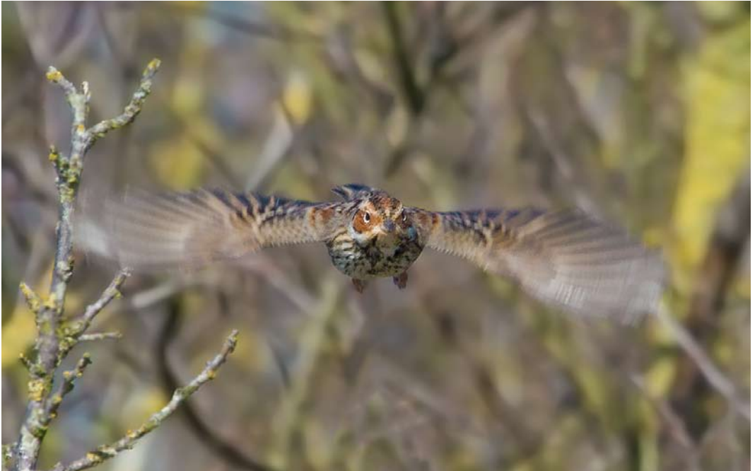
216 Dwerggors / Little Bunting Emberiza pusilla , Zwanenwater, Callantsoog, Noord-Holland, 12 maart 2015 (Mattias Hofstede)