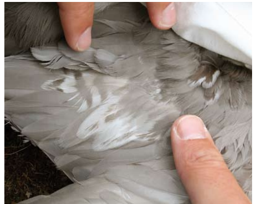
137 Long-tailed Jaeger / Kleinste Jäger Stercorarius longicaudus, adult, Björkfjället, Ammarnäs, Västerbotten, Sweden, 20 June 2011. Same bird as plate 136 and 138-139. 138 Long-tailed Jaeger / Kleinste Jäger Stercorarius longicaudus, adult, Björkfjället, Ammarnäs, Västerbotten, Sweden, 12 June 2010. Detail of right underwing. Same bird as plate 136-137 and 139. 139 Long-tailed Jaeger / Kleinste Jäger Stercorarius longicaudus, adult, Björkfjället, Ammarnäs, Västerbotten, Sweden, 12 June 2010. Detail of left underwing. Same bird as plate 136-138.

Long-tailed and Parasitic. Hence, jaegers showing these features cannot be aged with any certainty.