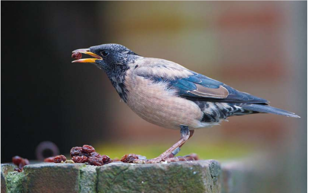
214 Roze Spreeuw / Rosy Starling Pastor roseus , eerste-winter, Vlaardingen, Zuid-Holland, 23 januari 2015 (Martin van der Schalk)