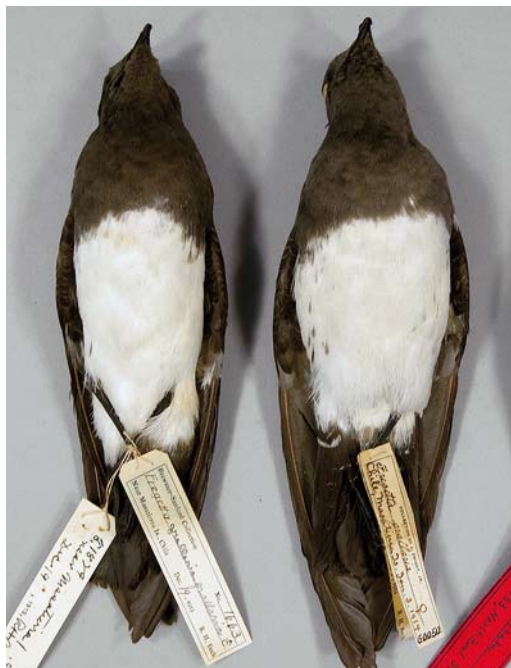
130 White-bellied Storm Petrels / Witbuikstormvogeltjes Fregatta grallaria segethi (collected off or on Robinson Crusoe, Chile, 3 January 1914 (right) and 19 December 1913), American Museum of Natural History, New York, USA, 25 October 2014. Note variation in flank streaking, corresponding to birds photographed at sea (cf plate 131-133).

A dark morph prominently occurs in the nominate subspecies F g gallaria (hereafter gallaria ) that breeds on Lord Howe Island, Australia (pers obs; Murphy & Snyder 1952, Serventy et al 1971, Van Tets & Fullagar 1984, Spear & Ainley 2007; plate 135). This morph was even described as a separate species by Mathews (1914) but soon after