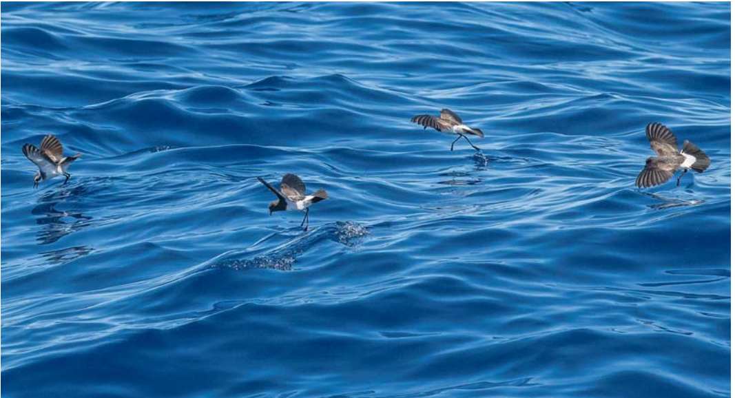
128 White-bellied Storm Petrels / Witbuikstormvogeltjes Fregetta grallaria , off Robinson Crusoe, Chile, 6 March 2013 ( Hadoram Shirihai /© Tubenoses Project ). Small (left) and large type (right) side by side. Latter constantly appearing distinctly larger overall, at sea estimated to be at least 15-20% larger than small type. 129 White-bellied Storm Petrels / Witbuikstormvogeltjes Fregetta grallaria , off Robinson Crusoe, Chile, 6 March 2013 ( Hadoram Shirihai /© Tubenoses Project ). Small type (two birds at centre) appearing about same size as White-faced Storm Petrels Pelagodroma marina , both being clearly smaller by at least 15-20% than large type (rightmost bird). At sea, large type constantly appearing heavier/deeper-bodied and notably larger headed, and also clearly longer and broader winged. As stated in main text, however, only when these storm petrels could be handled for biometrics it will be possible to determine whether these size differences are indeed representing different populations or taxa, rather than extreme individual variation. Note also large bird on right showing stronger-patterned upperparts, with heavy white-and-black scales.