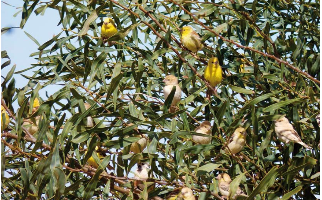
198 Sudan Golden Sparrows / Bruinruggoudmussen Passer luteus , with Desert Sparrow / Woestijnmus P simplex , male, Bir Anzarane, Western Sahara, Morocco, 6 February 2015