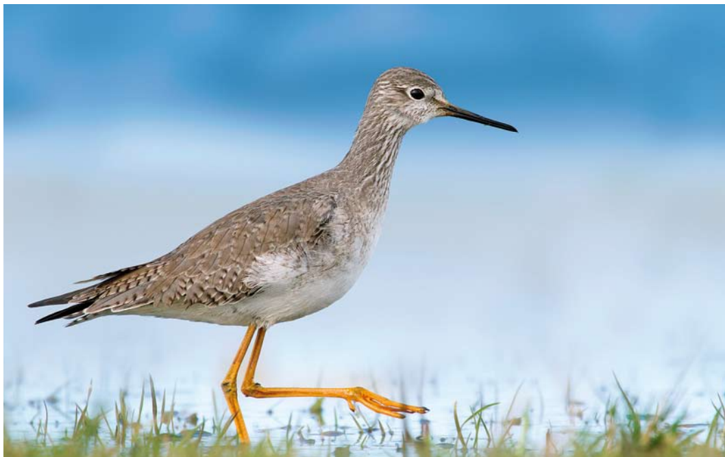
200 Kleine Geelpootruiter / Lesser Yellowlegs Tringa flavipes , adult-winter, Schokland, Flevoland, 27 februari 2015 (Lubbert Spaansen)