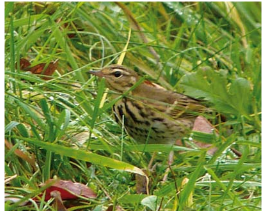
208 Roze Spreeuw / Rosy Starling Pastor roseus , eerste-winter, Vlaardingen, Zuid-Holland, 27 februari 2015 ( Eric Menkveld ) 209 Roze Spreeuw / Rosy Starling Pastor roseus , eerste-winter, Kollum, Friesland, 8 februari 2015 ( Alex Bos ) 210 Dwerggors / Little Bunting Emberiza pusilla , Zwanenwater, Callantsoog, Noord-Holland, 3 februari 2015 ( Eric Menkveld ) 211 Siberische Boompieper / Olive-backed Pipit Anthus hodgsoni , Muiderberg, Noord-Holland, 1 januari 2015 ( Conny Leijdekker-Winthorst )

dingen verbleef werd tot 25 februari waargenomen. Een tweede-kalenderjaar Kwartelkoning Crex crex werd op 11 januari dood gevonden bij Holwerd, Friesland. Winterwaarnemingen zijn extreem zeldzaam, met in januari waarschijnlijk slechts één eerder gedocumenteerd geval: op 1 januari 2002 gefilmd in Honselersdijk, Zuid-Holland ( www.youtube.com/watch?v=JtGtwGbjwb0 ). Een Kleine Trap Tetrax tetrax verbleef van 23 tot 29 januari in Polder Arnhemheen bij Nijkerk, Gelderland. Drie Ijsduikers Gavia immer op ten minste 10 en 11 februari op het Volkerak, Zuid-Holland, zijn het vermelden waard. De overwinterende Zwarte Ooievaar Ciconia nigra verbleef in ieder geval tot in maart in de (wijde) omgeving van Schiphol, Noord-Holland. Daarnaast waren er waarnemingen op 15 februari over Rijnsaterwoude en later Moerkapelle in Zuid-Holland. De ongeringde Roze Pelikaan Pelecanus onocrotalus in Noord-Holland bleef de gehele periode trouw aan een vijvertje midden in