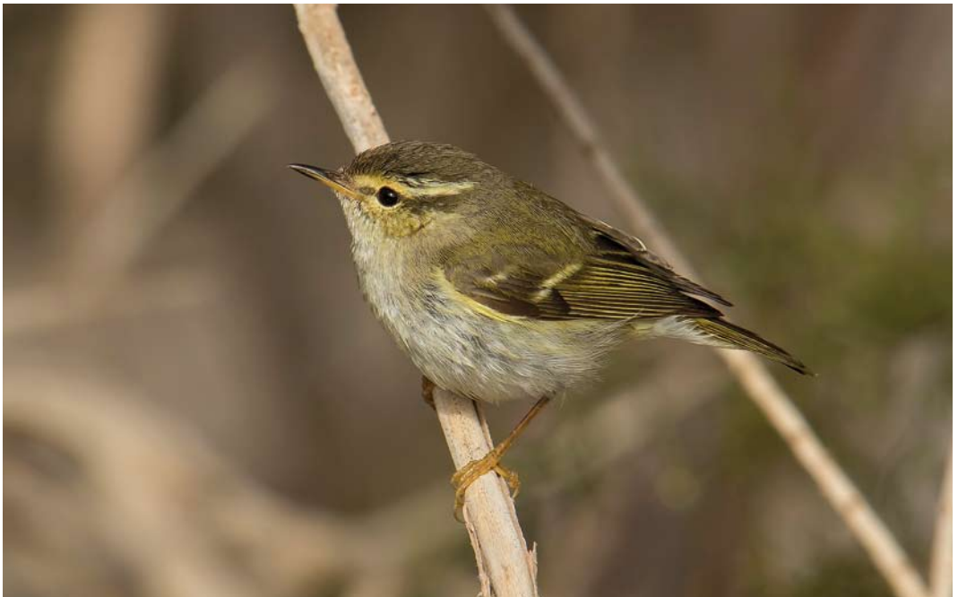
199 Yellow-browed Warbler / Bladkoning Phylloscopus inornatus , Fuerteventura, Canary Islands, 27 January 2015 (Jeroen van der Zwan)