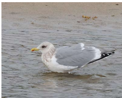
194 Barrow's Goldeneye / IJslandse Brilduiker Bucephala islandica , adult male, Preetz, Schleswig-Holstein, Germany, 22 February 2015 ( Martin Gottschling ) 195 Brown Shrike / Bruine Klauwier Lanius cristatus , adult, Deltebre, Tarragona, Spain, 14 February 2015 ( Juan Sagardía ) 196 Thayer's Gull / Thayers Meeuw Larus thayeri , first-winter, Rufforth Airfield, York, North Yorkshire, England, 2 March 2015 ( Tom Lowe ) 197 Thayer's Gull / Thayers Meeuw Larus thayeri , adult-winter, Lago, Xove, Lugo, Spain, 3 February 2015 ( Martin Gottschling )

ed from Lajes airfield, Terceira, on 16 February. The returning adult Thayer's Gull L thayeri ('Cipriana', born in 2007) at Lago, Xove, Lugo, Spain, remained from 28 December 2014 into late March. On 2 March, a first-winter was found at Rufforth Airfield, York, North Yorkshire, England. The adult Smithsonian Gull L smithsonianus at Lires, A Coruña, stayed from 7 December 2014 into March; it was first seen as an adult on 28 December 2011 (cf Dutch Birding 34: 294-301, 2012). The returning third-winter seen from 2014 remained at Ondarroa, Bizkaia, until at least 1 February and a second-winter stayed at Hondarribia, Bizkaia, from 27 February. The adult Slaty-backed Gull L schistisagus at Killybegs, Donegal, Ireland, on 17-18 January was again seen on 11 February. The subadult Glaucous-winged Gull L glaucescens at Reykjavík from 30 January to at least 12 March was the first or second for Iceland. Two African Skimmers Rynchops flavirostris at Taqah beach from 6 January to late February were the first for Oman.