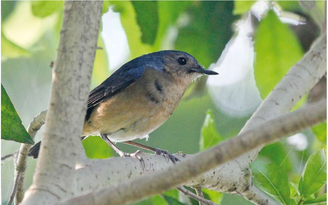
37 Firethroat / Père Davids Nachtegaal Calliope pectardens , first-winter male, North 24 Parganas district, West Bengal, India, 11 March 2012 ( Kshounish S Ray )

2500 m in large, dense expanses of bamboo in open coniferous and mixed coniferous-broad-leaved forest. The species has in the past also been recorded from Jiuzhaigou and Baihe Nature Reserves in Sichuan and Taibai Shan National Nature Reserve in Shaanxi. Forest cover has declined rapidly in Sichuan since the late 1960s, through exploitation of timber and clearance for cultivation and pasture, and substantial areas of temperate forest have been lost; clearing of bamboo forest may have affected Blackthroat in particular and explain, eg, the disappearance from Jiuzhaigou (James Eaton in litt). A number of protected areas established for Giant Panda Ailuropoda melanoleuca contain potentially suitable habitat but the species' distribution in these areas is poorly known (BirdLife International 2013b).