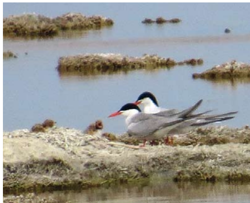
27 Common Terns / Visdieven Sterna hirundo , parents with three chicks of few days old, west of Port Said, Egypt, 24 May 2013

turbance by feral dogs but, so far, it is a muddy substrate difficult to access by humans, so it is naturally protected. In order to safeguard this significant colony for the future, signs could be posted to prevent people entering the area during the breeding season, especially when birds are nesting and raising chicks. The site should also be monitored every year, and any disturbances noted. Disturbance by feral dogs could constitute a problem and, if necessary, should be controlled. Natural predation of eggs or chicks, eg, by foxes or other mammalian or avian predators, could also constitute a threat to the viability of the colony. Such issues can only be determined through regular monitoring. However, monitoring itself can also serve as a disturbance factor for breeding birds so must be executed with great care.