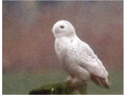
93 Sneeuwuil / Snowy Owl Bubo scandiacus , eerste-winter mannetje, Polder Zeevang, Noord-Holland, 19 januari 2013 (Sjaak Schilperoort)