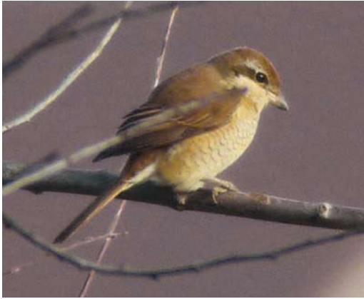
64 Brown Shrike / Bruine Klauwier Lanius cristatus , second calendar-year, Azewijnsche Broek, Gelderland, Netherlands, 19 January 2014