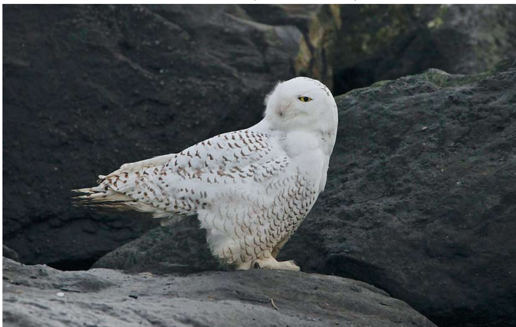
53 Snowy Owl / Sneeuwuil Bubo scandiacus , immature male, Zeebrugge, West-Vlaanderen, Belgium, 23 December 2013