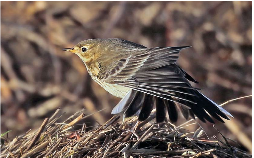
63 American Buff-bellied Pipit / Amerikaanse Waterpieper Anthus rubescens rubescens , Burton Marsh, Cheshire, England, 21 December 2013