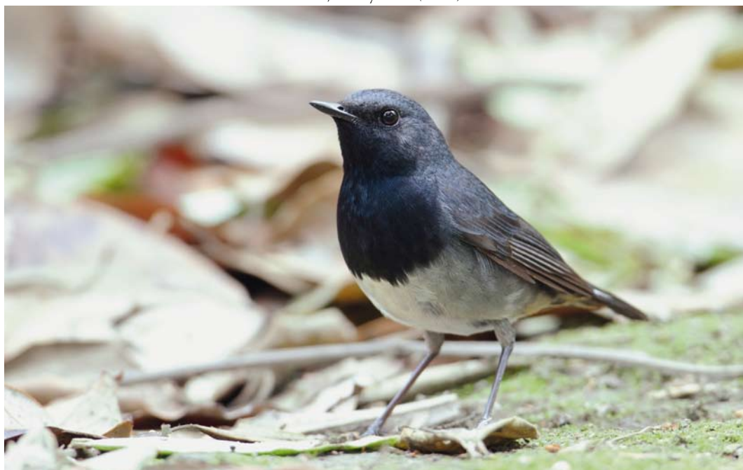
39 Blackthroat / Zwartkeelnachtegal Calliope obscura , first-summer male, Sichuan University, Shengdu, Sichuan, China, 2 May 2011 (He Yi)