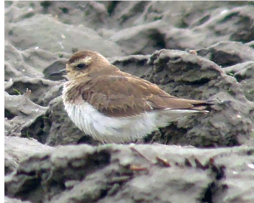
96 Kaspische Plevier / Caspian Plover Charadrius asiaticus , eerste-winter, Wissenkerke, Zeeland, 18 januari 2014

op met een aantal Kieviten en verdween in westelijke richting. Zoekacties leverden in de laatste paar uur daglicht niets meer op; enkele 10-tallen vogelaars waren vergeefs gekomen. De volgende ochtend duurde het een paar uur totdat Hans Moerman en Hugo Moerman hem tussen enkele Watersnippen Gallinago gallinago terugvonden op een geploegde akker nabij Wissenkerke. Hier werd hij tot 12:30 waargenomen en de dagen erna was hij met enige moeite steeds terug te vinden op akkers in de omgeving, vaak solitair en lastig te zien tussen de kleihopen of de lage begroeiing. Op zaterdag en zondag trok hij in totaal enkele 100en belangstellenden en daarna enkele 10-tallen op doordeweekse dagen en weer meer dan 100 in het weekend van 18-19 januari; onder de bezoekers waren veel vogelaars uit België en enkele uit Brittannië, Duitsland en Frankrijk. De vogel werd gezien tot ten minste 26 januari.