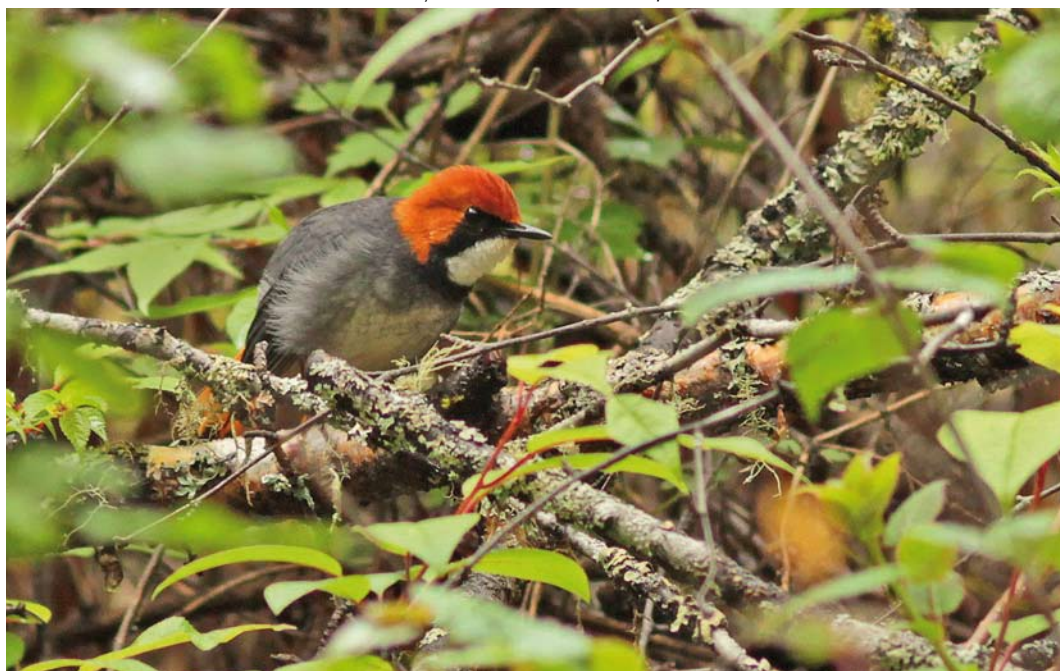
32 Rufous-headed Robin / Roodkopnachttegaal Larvivora ruficeps , male, Jiuzhaigou, Sichuan, China, 17 May 2013

The species measures 12.5 cm and is named after its fiery orange-red throat and upperbreast. The orange-red part is bordered by dense black breast-sides, with an isolated small white patch near the wing bend. The face is black and the upperhead, neck, upperparts and uppertail are dark blue-grey, with some white in the tail-sides. Immature males are much duller but still show a hint of pale orange on the underparts. Females and immatures are olive-brown above with a buff white throat, pale buffish breast, olive-buff flanks,