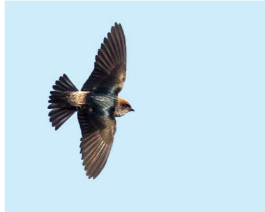
59 Streak-throated Swallow / Indische Klifzwaluw Petrochelidon fluvicola , immature, Jahra Pools Reserve, Kuwait, 7 December 2013