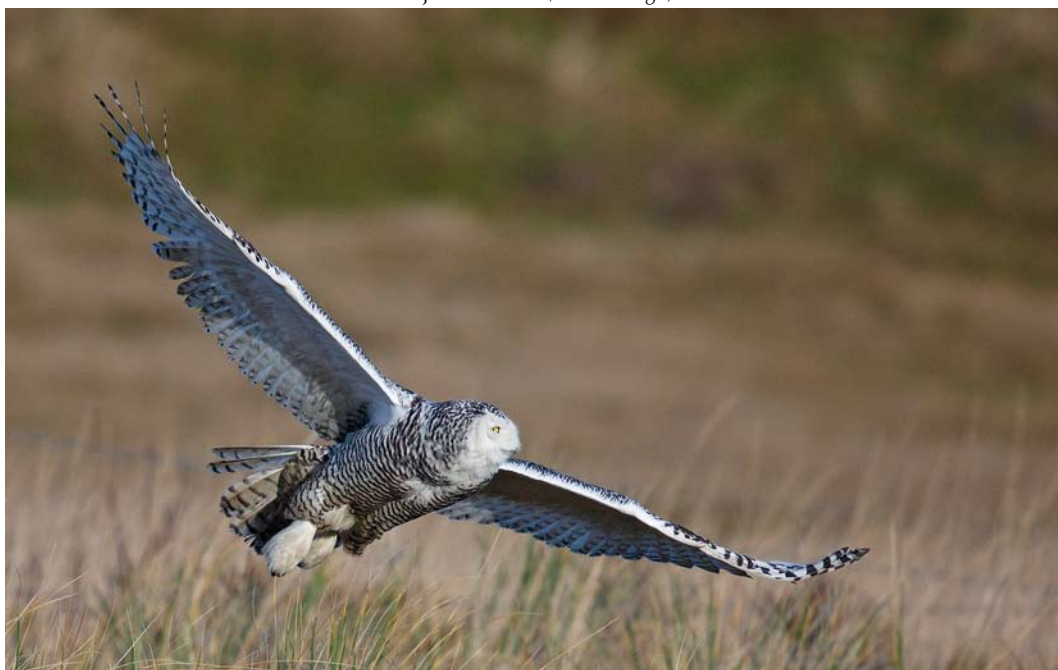
91 Sneeuwuil / Snowy Owl Bubo scandiacus , eerste-winter vrouwtje, Pad van Twintig, Vlieland, Friesland, 17 januari 2014