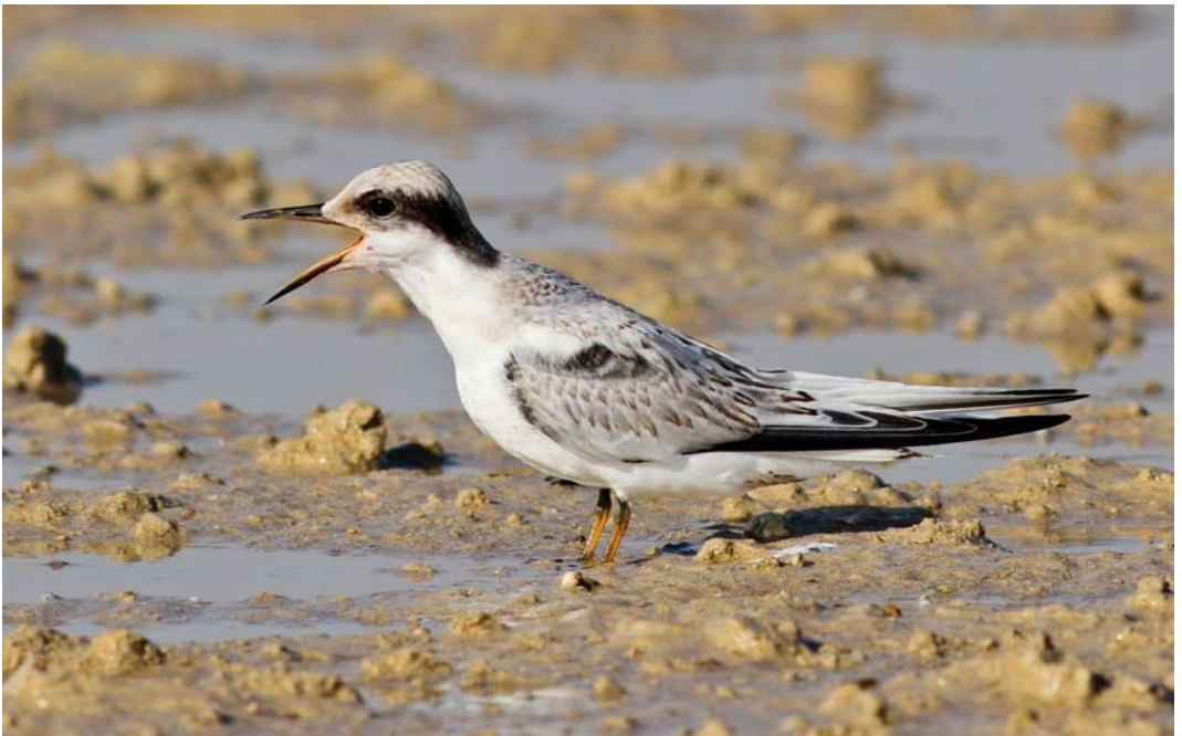
24 Saunders's Tern / Saunders' Dwergstern Sternula saundersi , juvenile, Ras Sudr, Sinai, Egypt, 25 July 2013 (Richard Bonser)