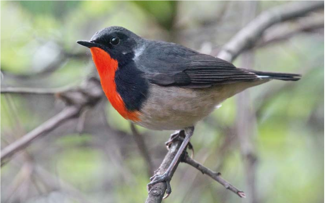
33 Firethroat / Père Davids Nachttegaal Calliope pectardens , male, Wolong Biosphere Reserve, Sichuan, China, 10 May 2012