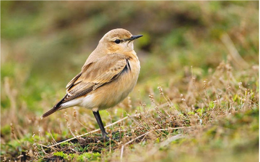
87 Izabeltapuit / Isabelline Wheatear Oenanthe isabellina , eerste-winter vrouwtje, Maasvlakte, Zuid-Holland, 1 november 2013 (Martin van der Schalk)

100 Kleine Barmsijzen A. cabaret . In Noord-Holland werden Witstuitbarmsijzen A. hornemanni geringd op 11 november bij Sint Maartensvlotbrug, Noord-Holland, en op 16 november in het Zwanenwater. Van 1 tot c 8 december werden bovendien één of twee exemplaren gemeld in Assen, Drenthe, al lieten de waarnemingsomstandigheden vaak te wensen over... Witbandkruisbekken Loxia leucoptera werden gemeld vanaf 7 november in het Noordaarderbos, Groningen (jong mannetje); van 17 tot 23 november in de Kale Duinen bij Appelscha, Friesland (mannetje en vrouwtje); op 22 en 23 november bij Baarn, Utrecht (mogelijk twee); van 7 tot 9 december bij Oldenzaal, Overijssel; op 12 december bij Lettele; op 13 december op het Drouwenerveld, Drenthe; op 25 december op de Duurswouderheide, Friesland; en vanaf 31 december bij Doorn, Utrecht (mannetje en vrouwtje). Ook deze periode verbleven er nog grote aantallen Grote Kruisbekken Loxia pytyopsittacus . Een exact aantal laat zich moeilijk bepalen. Veelbezochte groepen verbleven in het Drents-Friese Wold, Drente/Friesland