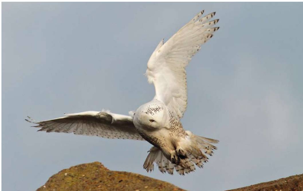
52 Snowy Owl / Sneeuwuil Bubo scandiacus , Zeebrugge, immature male, West-Vlaanderen, Belgium, 22 December 2013 (Marten Miske)