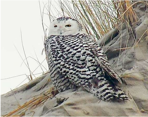
92 Sneeuwuil / Snowy Owl Bubo scandiacus , eerste-winter vrouwtje, Terschelling, Friesland, 18 januari 2013 (Joost van Bruggen)