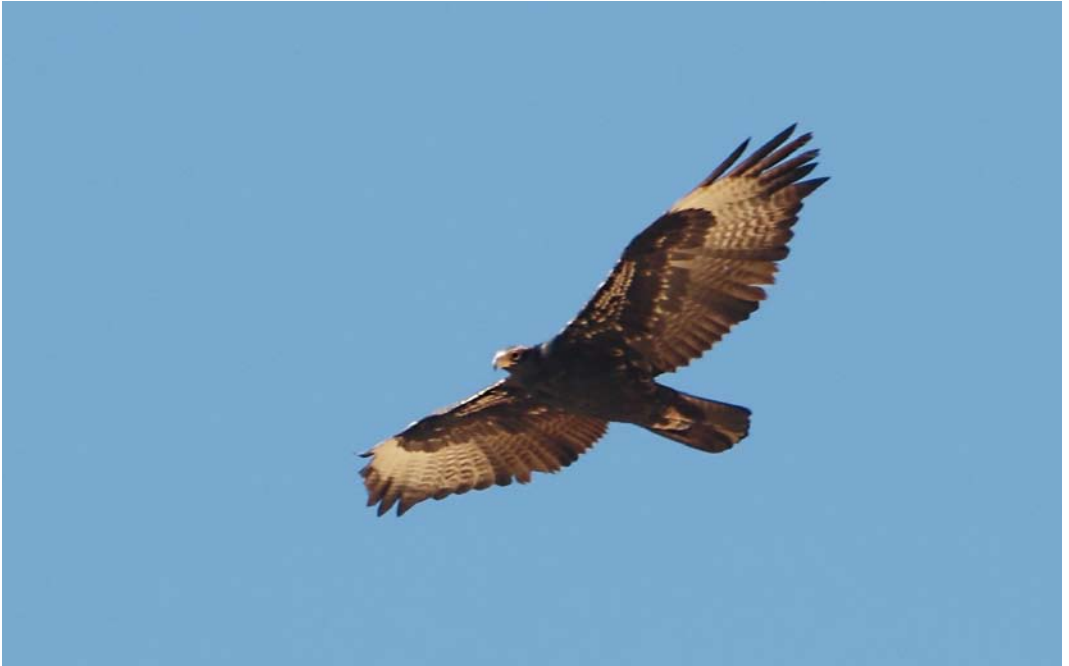
43-44 Verreaux's Eagle / Zwarte Arend Aquila verreauxii , subadult, Eilat mountains, Israel, 22 December 2013 45 Allen's Gallinule / Afrikaanse Purperhoen Porphyrio alleni , adult, Wied Ghollieqa, Malta, 7 January 2014