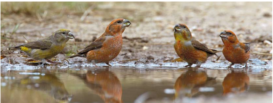
82 Witbandkruisbekken / Two-barred Crossbills Loxia leucoptera , mannetje en vrouwtje, Drents-Friese Wold, Friesland, 20 november 2013 ( Maartje Doorn ) 83 Grote Kruisbek / Parrot Crossbill Loxia pytyopsittacus , mannetje, Drents-Friese Wold, Drenthe, 19 oktober 2013 ( Lazar Brinkhuizen ) 84 Witbandkruisbek / Two-barred Crossbill Loxia leucoptera , mannetje, Drents-Friese Wold, Friesland, 20 november 2013 ( Ipe Weeber ) 85 Witbandkruisbek / Two-barred Crossbill Loxia leucoptera , eerstejaars mannetje, Noordlaarderbos, Groningen, 30 december 2013 ( Gerrit Kiekenbos ) 86 Grote Kruisbekken / Parrot Crossbills Loxia pytyopsittacus (midden), met Kruisbekken / Red Crossbills L. curvirostra (links en rechts), Mulderskop, Limburg, 17 januari 2014 ( Harvey van Diek )