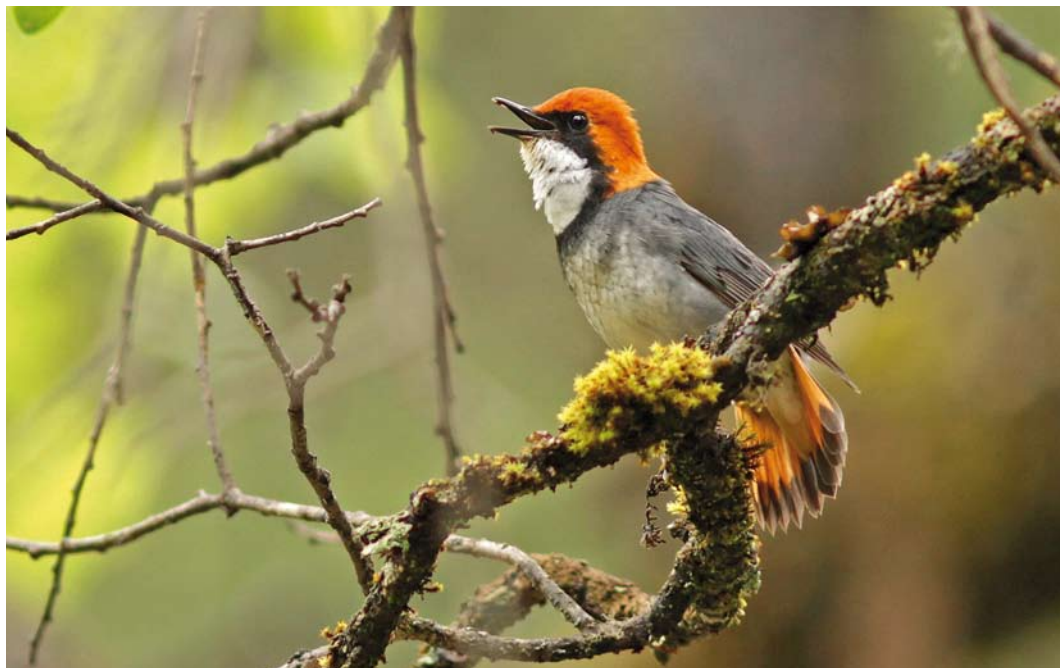
28 Rufous-headed Robin / Roodkopnachttegaal Larvivora ruficeps , male, Jiuzhaigou, Sichuan, China, 17 May 2013

status of both taxa based on analyses of mitochondrial and nuclear DNA, vocalisations and distributions. Phylogenetic analysis confirmed that they are sister species, their genetic divergence (cytochrome b 6.4%) being comparable with several other species pairs of 'chats'. Discriminant function analysis of songs correctly classified 88% of the recordings. Based on these congruent differences in morphology, songs and molecular markers, it was confirmed that they are appropriately treated as separate species.