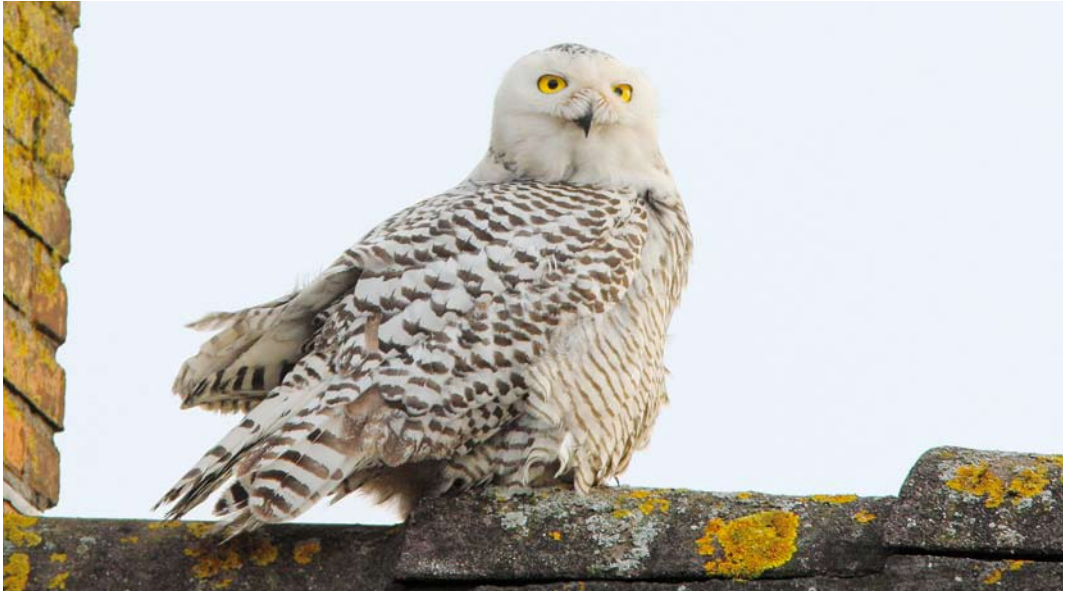
94 Sneeuwuil / Snowy Owl Bubo scandiacus , eerste-winter vrouwtje, De Goorn, Noord-Holland, 22 januari 2014 (Rob Half)