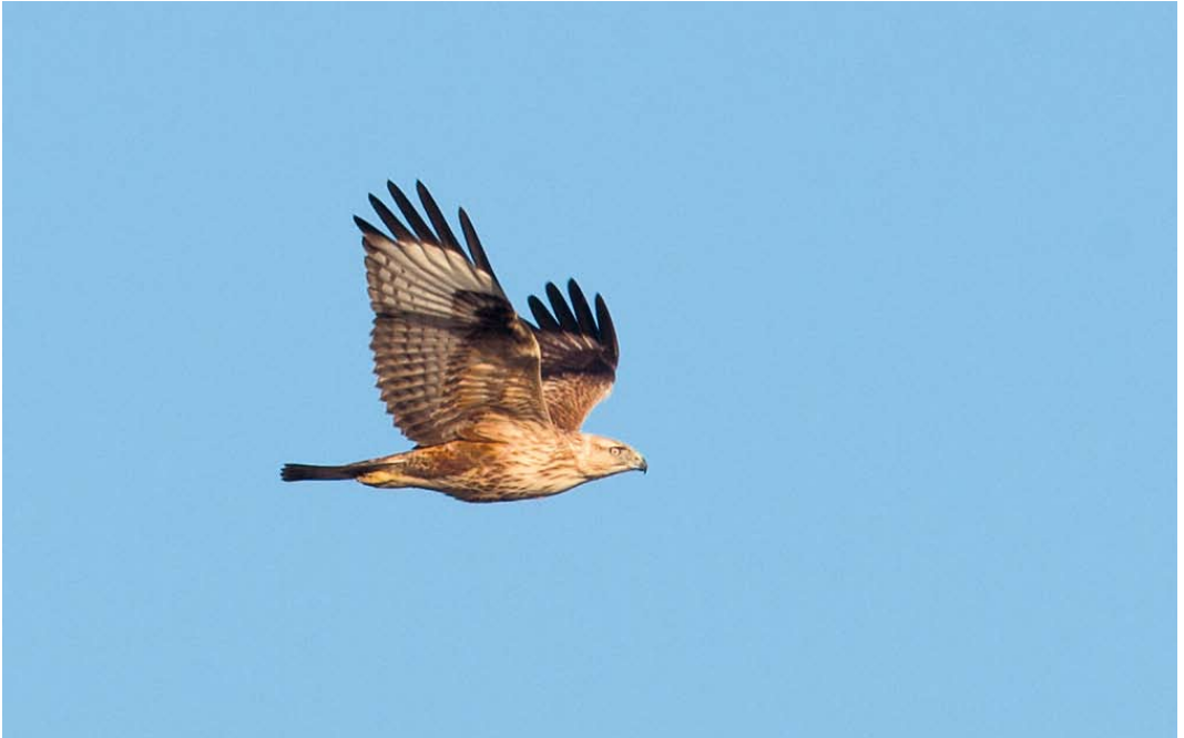
79 Arendbuizerd / Long-legged Buzzard Buteo rufinus , eerstejaars, Tweede Maasvlakte, Zuid-Holland, 11 december 2013 80 Dwerguil / Eurasian Pygmy Owl Glaucidium passerinum , Lettele, Overijssel, 4 januari 2014 81 Blauwstaart / Red-flanked Bluetail Tarsiger cyanurus , eerstejaars, Hollandse Kade, Kockengen, Utrecht, 13 november 2013