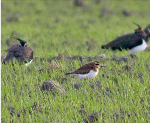
95 Kaspische Plevier / Caspian Plover Charadrius asiaticus , eerste-winter, met Kieviten / Northern Lapwings Vanellus vanellus , Colijnsplaat, Zeeland, 10 januari 2014