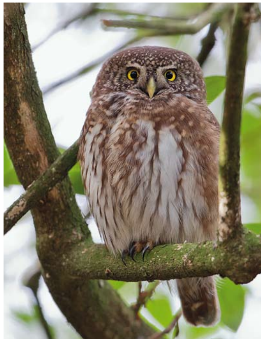
76 Sneeuwuil / Snowy Owl Bubo scandiacus , eerste-winter vrouwtje, De Cocksdoorp, Texel, Noord-Holland, 28 december 2013 77 Dwerguil / Eurasian Pygmy Owl Glaucidium passerinum , Lettele, Overijssel, 4 januari 2014 78 Sneeuwuil / Snowy Owl Bubo scandiacus , eerste-winter vrouwtje, Pad van Twintig, Vlieland, Friesland, 13 januari 2014