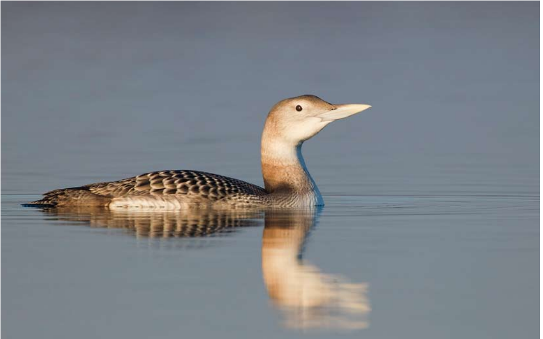
46 Yellow-billed Loon / Geelsnavelduiker Gavia adamsii , first-year, Lac du Der-Chantecoq, Sainte-Marie-du-Lac-Nuisement, Marne, France, 13 December 2013 ( David Monticelli )