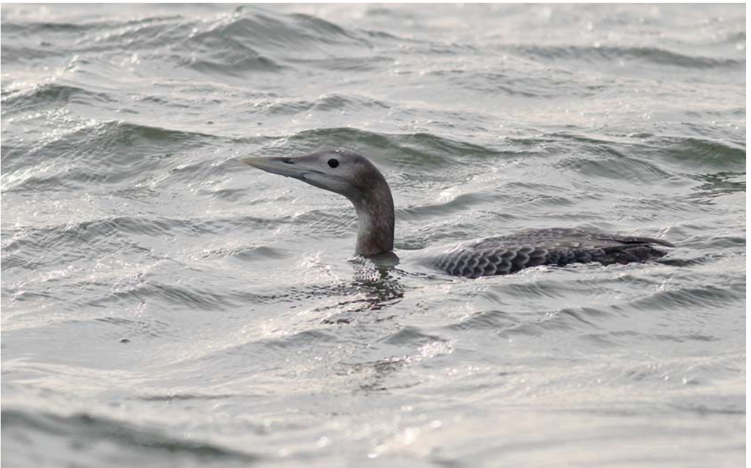
49 Yellow-billed Loon / Geelsnavelduiker Gavia adamsii , first-year, Goczałkowicki reservoir, Slaskie, Poland, 29 December 2013 (Michał Baran)