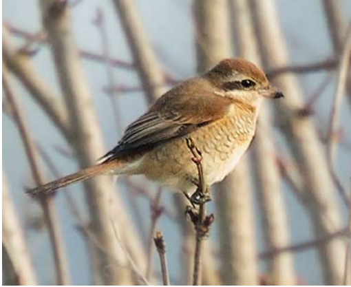
97 Bruine Klauwier / Brown Shrike Lanius cristatus , tweede-kalenderjaar, Azewijnsche Broek, Gelderland, 19 januari 2014 (Arno ten Hoeve)