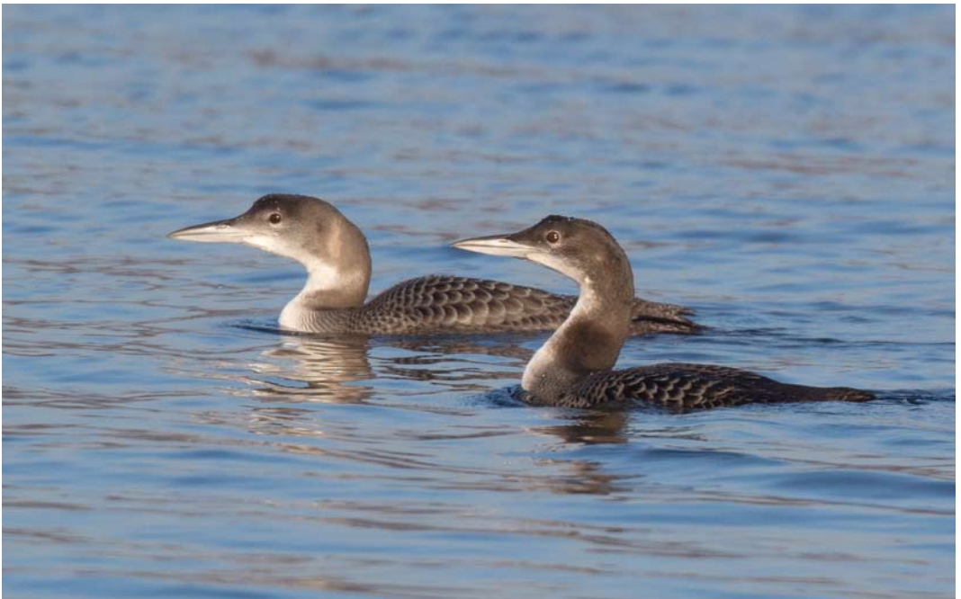
69 Ijsduikers / Great Northern Loons Gavia immer , eerstejaars, Heel, Limburg, 10 december 2013 (Roelof de Beer)