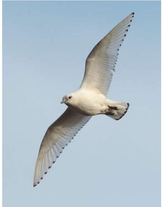
54 Ivory Gull / Ivoormeeuw Pagophila eburnea , first-year, Patrington, East Yorkshire, England, 19 December 2013 55 Ivory Gull / Ivoormeeuw Pagophila eburnea , first-year, Patrington, East Yorkshire, England, 22 December 2013 56 Ivory Gull / Ivoormeeuw Pagophila eburnea , first-year, and Snowy Owl / Sneeuwuil Bubo scandiacus , Hanstholm, Nordjylland, Denmark, 22 December 2013