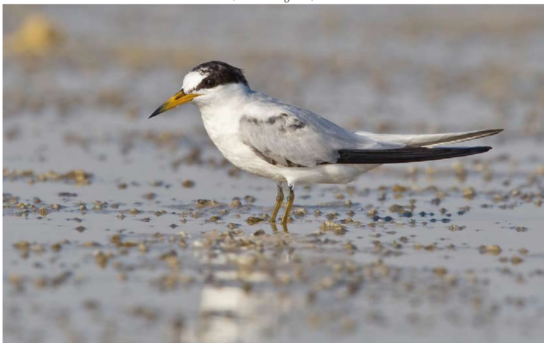
22 Saunders's Tern / Saunders' Dwergstern Sternula saundersi , first-summer, Ras Sudr, Sinai, Egypt, 25 July 2013