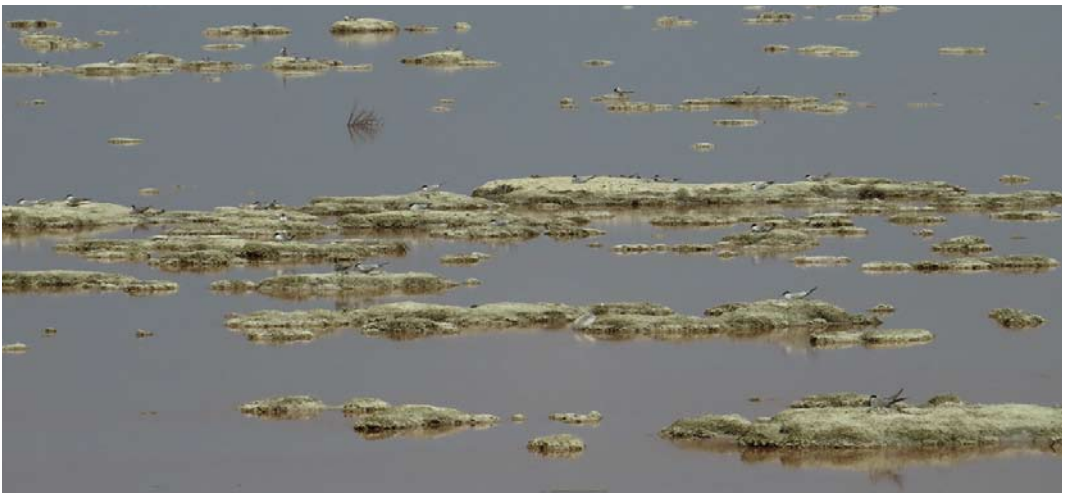
25 Common Terns / Visdieven Sterna hirundo , overview of colony west of Port Said, Egypt, 25 May 2013

Birds in general are under wide threat in Egypt, especially from disturbance, shooting and trapping, and degradation of habitats, especially for breeding. This area in particular is subject to dis-