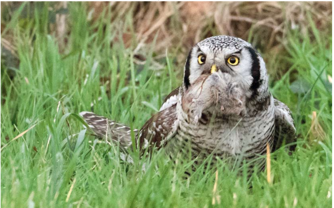
4 Sperweruil / Northern Hawk-Owl Surnia ulula , Zwolle, Overijssel, 25 december 2013