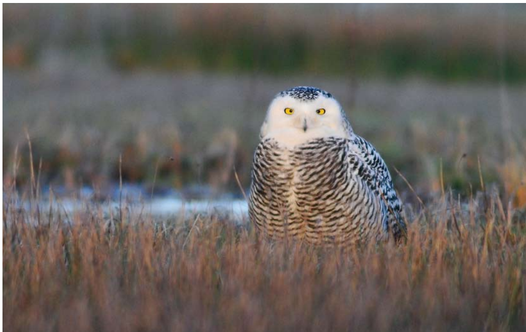
90 Sneeuwuil / Snowy Owl Bubo scandiacus , eerste-winter vrouwtje, De Cocksdorp, Texel, Noord-Holland, 28 december 2013