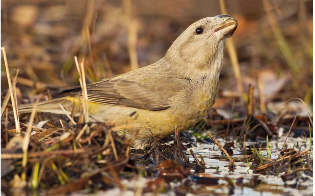
62 Parrot Crossbill / Grote Kruisbek Loxia pytyopsittacus , female, Lanaken, Limburg, Belgium, 2 January 2014 (Filip De Ruwe)