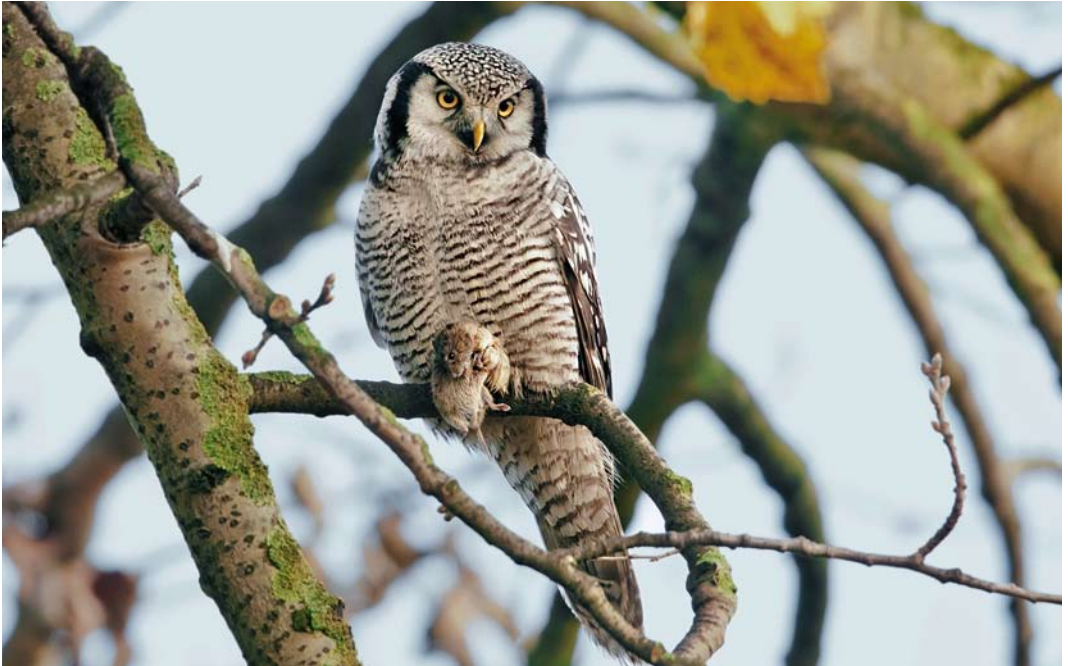
3 Sperweruil / Northern Hawk-Owl Surnia ulula , Zwolle, Overijssel, 28 november 2013 (Hans Gebuis)