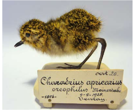
12 Eurasian Golden Plover / Goudplevier Pluvialis apricaria apricaria , hatchling (collected at Nieuwe Weg, Westerbeek, Noord-Brabant, Netherlands, on 9 May 1928), Naturalis Biodiversity Center, Leiden, Netherlands, 11 February 2013

University of Manchester, Manchester, England (MMUM); Natuurmuseum Brabant, Tilburg, the Netherlands (NBNM); Naturalis Biodiversity Center, Leiden, the Netherlands (Naturalis; containing the collections of former Rijksmuseum van Natuurlijke Historie, Leiden, and former Zoologisch Museum Amsterdam, Amsterdam, the Netherlands); Natuurmuseum Fryslân, Leeuwarden, the Netherlands (NMF); Amgueddfa Cymru – National Museum Wales, Cardiff, Wales (NMW); Natural History Museum (former British Museum of Natural History), Tring, England (NHM); and University Museum of Zoology Cambridge, Cambridge, England (UMZC).