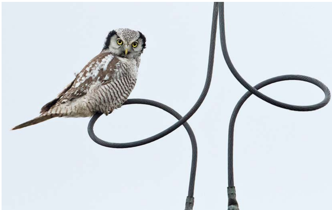
5 Sperweruil / Northern Hawk-Owl Surnia ulula , Zwolle, Overijssel, 2 januari 2014 (Jaap Denee)