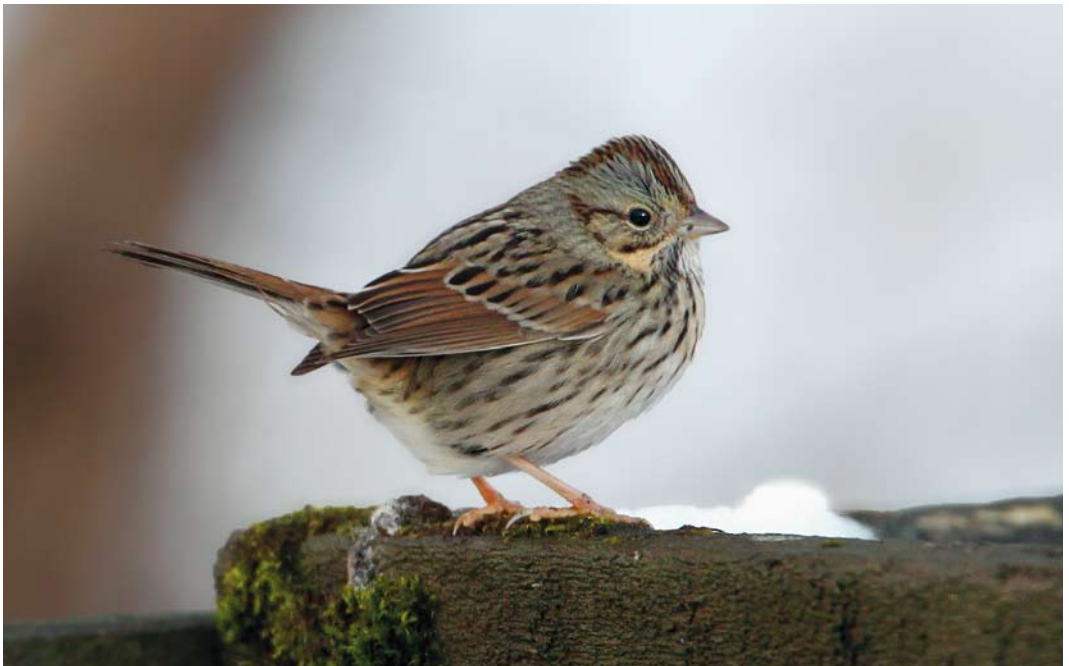
61 Lincoln's Sparrow / Lincolns Gors Melospiza lincolnii , Hafnarfjörður, Iceland, 9 December 2013 (Sindri Skúlason)