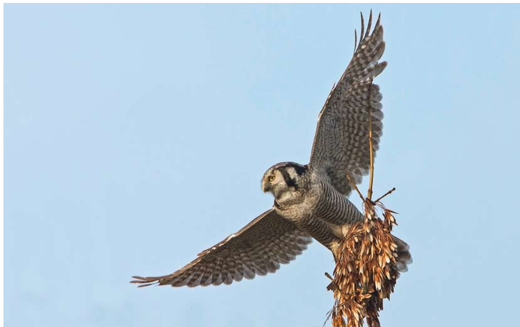
10 Sperweruil / Northern Hawk-Owl Surnia ulula , Zwolle, Overijssel, 18 januari 2014