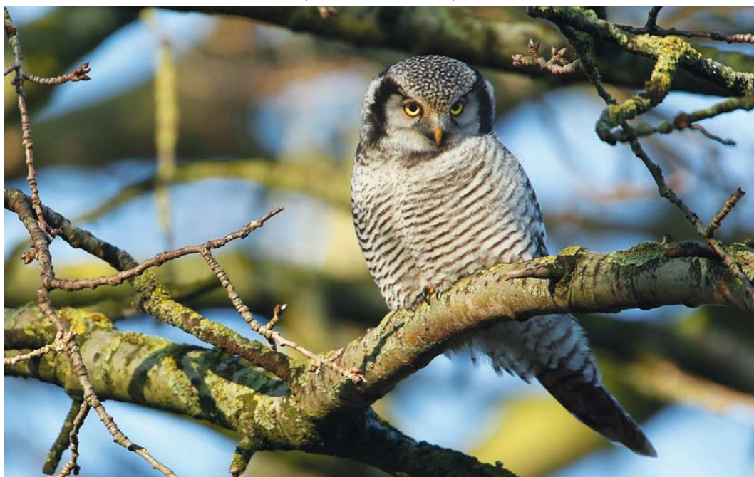
6 Sperweruil / Northern Hawk-Owl Surnia ulula , Zwolle, Overijssel, 20 december 2013 (Martin van der Schalk)