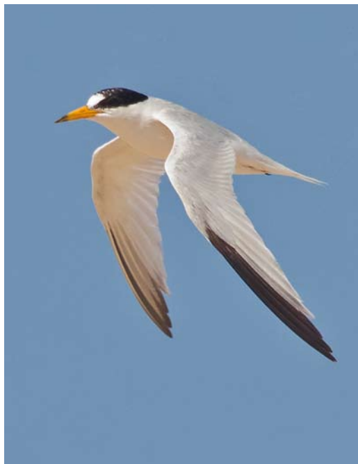
20-21 Saunders's Tern / Saunders' Dwergstern Sternula saundersi , adult, Ras Sudr, Sinai, Egypt, 25 July 2013 (Vincent Legrand)