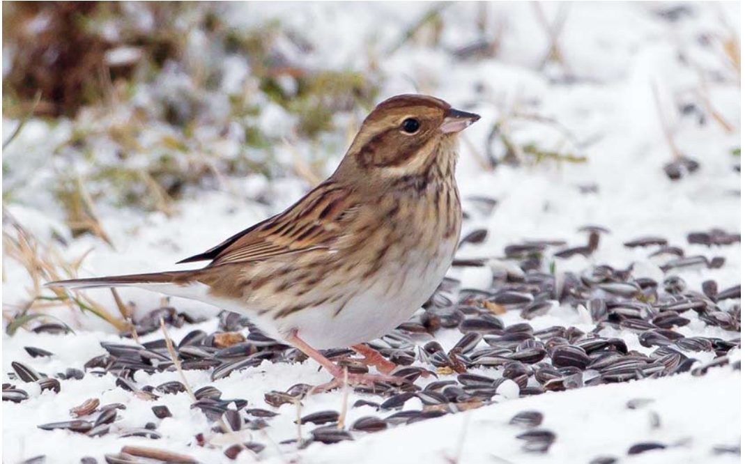
60 Black-faced Bunting / Maskergors Emberiza spodocephala , first-winter female, Ratvika, Møre og Romsdal, Norway, 10 December 2013