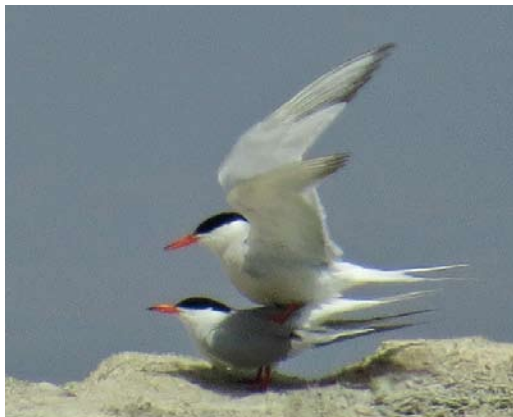
26 Common Terns / Visdieven Sterna hirundo , west of Port Said, Egypt, 25 May 2013