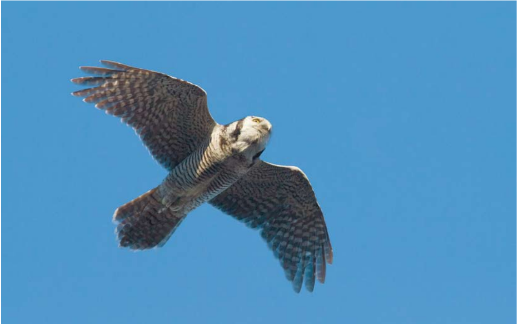
7 Sperweruil / Northern Hawk-Owl Surnia ulula , Zwolle, Overijssel, 12 januari 2014 8 Sperweruil / Northern Hawk-Owl Surnia ulula , Zwolle, Overijssel, 31 december 2013 9 Sperweruil / Northern Hawk-Owl Surnia ulula , Zwolle, Overijssel, 6 januari 2014