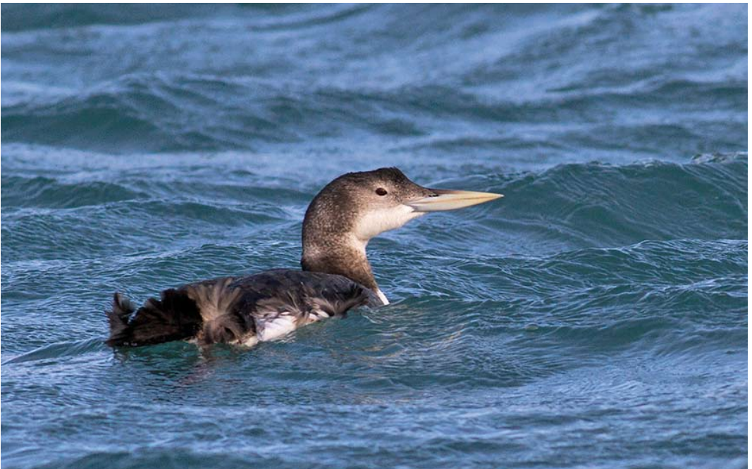
47 Yellow-billed Loon / Geelsnavelduiker Gavia adamsii , adult, Brixham, Devon, England, 3 January 2014