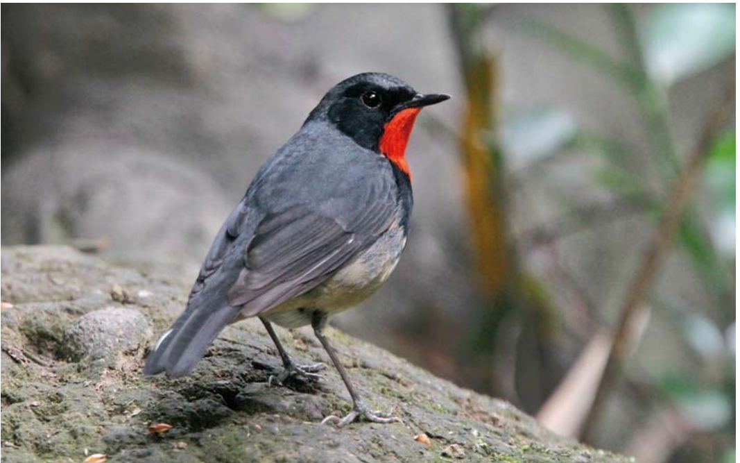
34 Firethroat / Père Davids Nachttegaal Calliope pectardens , male, Chengdu, Sichuan, China, 2 May 2012 (Werner Müller)