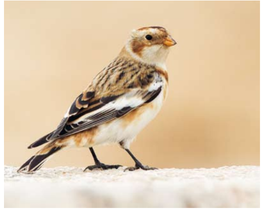
65 Snow Bunting / Sneeuwgors Plectrophenax nivalis , first-year male, Acre, Israel, 26 December 2013 (Yoav Perlman)

was the first for Denmark since 1959 (when the species became extinct as a breeder). A Brown Shrike Lanius cristatus at Azewijnsche Broek, Achterhoek, Gelderland, from 18 January onwards was the first for the Netherlands and the c 27th for Europe (of which 10 were in Scotland and seven in England). The first Streak-throated Swallow Petrochelidon iluvicola for Kuwait and second for the WP sensu BWP was photographed at Jahra Pools Reserve, Al-Jahra, on 6-7 December; the first for the WP was in Egypt on 19 November 2003.