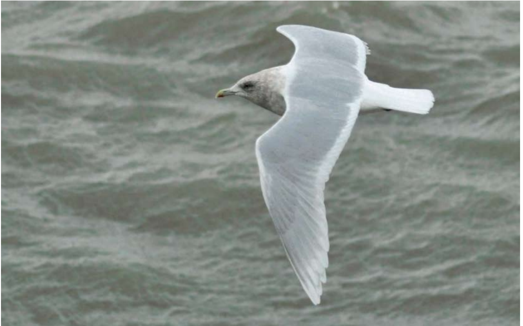
68 Kumliens Meeuw / Kumlien's Gull Larus glaucooides kumlieni , adult, Scheveningen, Zuid-Holland, 24 december 2013 (Vincent van der Spek)