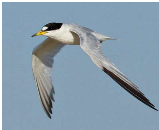
18-19 Saunders's Tern / Saunders' Dwergstern Sternula saundersi , adult, Ras Sudr, Sinai, Egypt, 25 July 2013

Arabian part of the Western Palearctic (WP, sensu BWP), Kuwait in the east (where breeding has been suspected in the past; Jennings 2010) and Egypt in the west would be the obvious choices, especially Egypt with its high densities of seabird colonies (predominantly White-eyed Gulls Larus leucophthalmus , Bridled Terns Onychoprion anaethetus and White-cheeked Terns Sterna repressa ).