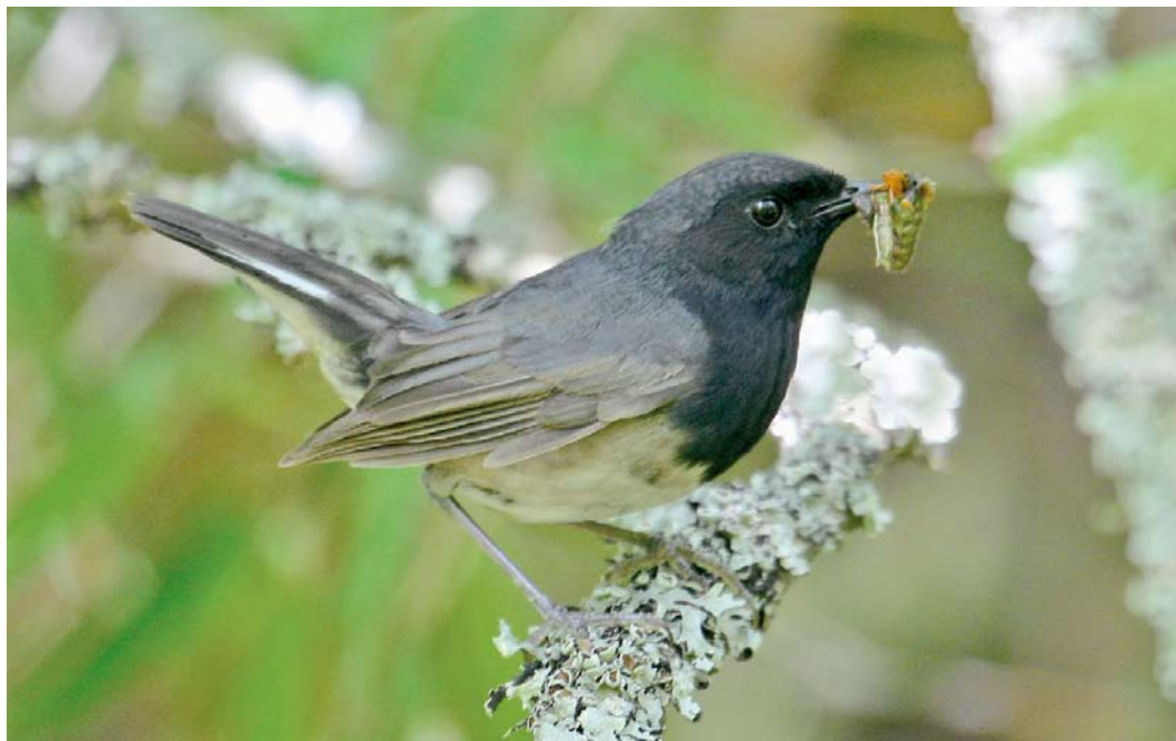
38 Blackthroat / Zwartkeelnachtegal Calliope obscura , male, Changqing NP, Shaanxi, China, 23 June 2012