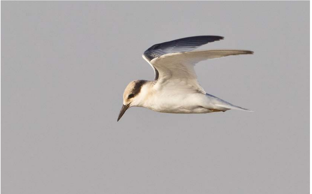
23 Saunders's Tern / Saunders' Dwergstern Sternula saundersi , juvenile, Ras Sudr, Sinai, Egypt, 25 July 2013 (Vincent Legrand)